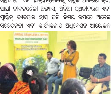
ସେନାଳୟ କର୍ମଚାରୀ, ରୁକ୍ମିଣିକିକ କର୍ମଚାରୀ, ଆଖପାଖ ସମ୍ପ୍ରଦାୟ ଏବଂ ଛାତ୍ରଛାତ୍ରୀମାନଙ୍କୁ ସବୁଜ ଆବରଣ ଦୃଷ୍ଟି, ସ୍ୱାସ୍ଥ୍ୟ ଜୀବନଶୈଳୀ ଅଭ୍ୟାସ, ଅଭିଆ ପ୍ରଚାରକରଣ ଏବଂ ପୁସ୍ତକ ବ୍ୟବହାର ହ୍ରାସ ଭଳି ବିଷୟ ଉପରେ ଅନେକ ସଚେତନତା ଏବଂ କାର୍ଯ୍ୟକଳାପ ଅଧିକାରୀ ଆୟୋଜନ କରିଥିଲା। ଏହି ପଦକ୍ଷେପଗୁଡ଼ିକ ବିଷୟରେ ମତ ଦେଇ, ଜିମ୍ନାଷ୍ଟିକ୍ସ ବିଶ୍ୱ ପରିବେଶ ଦିବସରେ ଅଧ୍ୟୟନ କରାଯାଇଛି। “ପରିବେଶିକ ଦାୟିତ୍ୱ ଆମ ପୁଂଠରେ ସାମାଜିକ ଦାୟିତ୍ୱ ରହିପାରିବ ନାହିଁ; ଆମେ ଏହାକୁ ଦୈନିକ ଆଚରଣର ଏକ ଅଂଶ କରିବାକୁ ବିଶ୍ୱାସ କରୁ। ଏହିପରି ପଦକ୍ଷେପ ମାଧ୍ୟମରେ, ଆମେ କର୍ମଚାରୀ, ସ୍ଥାନୀୟ ସମ୍ପ୍ରଦାୟ ଏବଂ ଭବିଷ୍ୟତ ପିଢ଼ିକୁ ସାମିଲ କରି ସ୍ୱାସ୍ଥ୍ୟ ପ୍ରତି ଏକ ସହକାରୀ ମାଲିକାନା ଭାବନାକୁ ସୂଚୁ କରିବାକୁ ଚେଷ୍ଟା କରୁଛୁ।

ଭୁବନେଶ୍ୱର, (ସବୁଧ୍ୱ) : ଭାରତର ଅଗ୍ରଣୀ ସେନାଳୟ ଶିଳ୍ପ ନିର୍ମାଣ ଜିମ୍ନାଷ୍ଟିକ୍ସ ବିଶ୍ୱ ପରିବେଶ ଦିବସ ୨୦୨୬ ପାଳନ କରିବା ପାଇଁ ଏହାର ହିସାବ ଏବଂ ଯାଜପୁର ସୁନିର୍ଭରଶୀଳତାରେ ସଚେତନତା, ଅପତନ ପରିଚାଳନା ଏବଂ ସବୁଜ ଆନ୍ଦୋଳନ ପଦକ୍ଷେପ ଏକ ଶୁଖିଲା ଆୟୋଜନ କରିଥିଲା। ଜଳବାୟୁ ପାଇଁ ଆମ ଭବିଷ୍ୟତ ସମନ୍ୱିତ ଏବଂ କାର୍ଯ୍ୟ ଆହୁାନର ପ୍ରତିକ୍ରିୟାରେ, ଅଧିକ କର୍ମଚାରୀ ଏବଂ ସାମ୍ପ୍ରଦାୟିକ ଅଗ୍ରଣୀତ ମାଧ୍ୟମରେ ଦାୟିତ୍ୱପୂର୍ଣ୍ଣ ପରିବେଶଗତ ଅଭ୍ୟାସଗୁଡ଼ିକୁ ଉତ୍ସାହିତ କରିବା ଉପରେ ଧ୍ୟାନ କେନ୍ଦ୍ରିତ କରାଯାଇଥିଲା। ପାଳନର ଏକ ଅଂଶ ଭାବରେ, କମ୍ପାନୀ ହିସାବରେ ଏକ ପୁସ୍ତକ-ପୁସ୍ତକ ଅଭିଯାନ ଆରମ୍ଭ କରିଥିଲା ଏବଂ ସ୍ଥାନୀୟ ବ୍ୟାଗରେ ପରିବର୍ତ୍ତନ ବିକ୍ରେତାମାନଙ୍କୁ ୧୦,୦୦୦ ପୁନଃବ୍ୟବହାରଯୋଗ୍ୟ କପା ବ୍ୟାଗ ବଣ୍ଟନ କରିଥିଲା। ଜିମ୍ନାଷ୍ଟିକ୍ସ ବିଶ୍ୱ ପ୍ରଦର୍ଶନ ନିମନ୍ତେ ବୋର୍ଡ ଦ୍ୱାରା ଅନୁମୋଦିତ ପୁନଃଚକ୍ରାକରଣ ଅଂଶଦ୍ୱାରା ଗୈରିନିର୍ମୂଳକ ନିକଟରେ ଏକ ବଡ଼ ପରିମାଣର ଉତ୍ପାଦନା ଫାହୁଡ଼ା ଅଭିଯାନ ମଧ୍ୟ ଆୟୋଜନ କରିଥିଲା, ଯାହା ଦ୍ୱାରା ପୁସ୍ତକ ପରିବର ଏବଂ ନିକଟସ୍ଥ ଆବାସିକ ଅଂଶକୁ ଦାୟିତ୍ୱପୂର୍ଣ୍ଣ ବିପର୍ଯ୍ୟୟ ଏବଂ ପୁନଃଚକ୍ରାକରଣ ପାଇଁ ପ୍ରାୟ ୧୦୦ କିଲୋଗ୍ରାମ ଲୋକଲୋଚନୀୟ ବର୍ଜ୍ୟବସ୍ତୁ ଫାହୁଡ଼ା କରାଯାଇଥିଲା। ଯାଜପୁରରେ, ଜିମ୍ନା