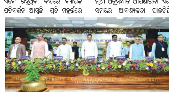
ଏବେ ରହିଥିବା ବିଶ୍ୱରେ ବ୍ୟାପକ ପଡ଼ିବନି ଆସୁଛି। ପ୍ରତି ମହୁଡ଼ିରେ ନୂଆ ଅନୁସନ୍ଧାନ ଆପଣାଇବା ଏବେ ସମ୍ଭବ ଆବଶ୍ୟକତା ପାଳିଛି।