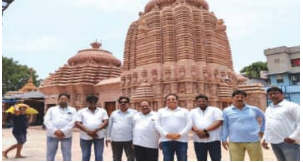
ମାନଙ୍କ ସହ ଆଲୋଚନା କରିବା ପରେ ବଜ୍ରପାତରୁ ସୁରକ୍ଷା ପାଇଁ ଆବଶ୍ୟକୀୟ ଆର୍ଥିକ କାର୍ଯ୍ୟ କରାଯାଇ ନ ଥିବା ଜାଣିବାକୁ ପାଇଥିଲେ। ମନ୍ଦିର ନିର୍ବାଣ ଓ ନବୀକରଣ କାର୍ଯ୍ୟରେ ସଫଳତା ଫଳା ଠିକାଦାର ମନ୍ଦିର

ର ମୁଖ୍ୟ ପୁସ୍ତକ କିମ୍ବା ପରିଚାଳନା କମିଟି ସହ ଆଲୋଚନା କରୁ ନ ଥିବାରୁ ନିର୍ବାଣ କାର୍ଯ୍ୟ ସଠିକ୍ ବା ଆବଶ୍ୟକତା ଅନୁଯାୟୀ ହୋଇପାରୁ