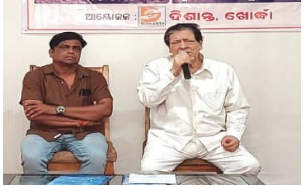
ନେଇ ଖୋର୍ଦ୍ଧା, ଚିତା, ରଜ ପିଠା, ପଣାଖେଳ ପ୍ରଭୃତି ପ୍ରତିଯୋଗିତା ଆୟୋଜନ କରାଯାଇଛି। ମହୋତ୍ସବ ସମୟରେ ସେମାନଙ୍କୁ ସମ୍ମାନିତ କରାଯିବ। ଏତଦ୍ୱ୍ୟତୀତ ବିଭିନ୍ନ କ୍ଷେତ୍ରରେ ପାରଦର୍ଶିତା ଅର୍ଜନ କରାଯିବ। ଶୁଖିଳିକା, ସୁପରିଚାଳନା ପାଇଁ ଅନୁଷ୍ଠାନ ପକ୍ଷରୁ ପ୍ରାୟ ୧୫୦୦ଟି ସେଲ୍‌ସୋଲୋ ନିଯୋଜିତ କରାଯିବ। ପ୍ରଯାପ ପାଇଁ ବ୍ୟବସ୍ଥା କରାଯିବ। ଏହି ସମ୍ମିଳନୀରେ ଦିଶାନ୍ତ ଅନୁଷ୍ଠାନର ସମସ୍ତ ସଦସ୍ୟ ଉପସ୍ଥିତ ଥିଲେ।

କରିଥିବା କଳାକାର, କ୍ରୀଡାବିତ, ଲେଖକ, ସାହିତ୍ୟିକ, ସାମ୍ବାଦିକ ଏବଂ ସାମାଜିକ କର୍ମୀଙ୍କୁ ଦିଶାନ୍ତ ରଜ ମହୋତ୍ସବ ସମ୍ମାନରେ ସମ୍ମାନିତ