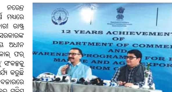
ଓଡ଼ିଶାରେ କୃଷି ରସାୟନ ପାଇଁ ଅପାର ସମ୍ଭାବନା ରହିଛି