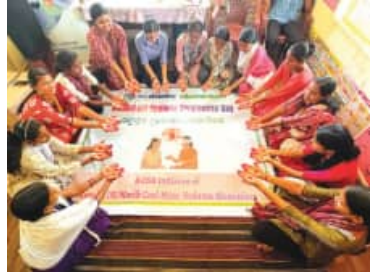
ଅନ୍ତର୍ଭୁକ୍ତ ଥିଲା। ଅଧିକାଂଶ ନେତୃତ୍ୱ ନେଇଥିଲେ, ହେମନ୍ତର ଗୋଷ୍ଠୀ ସ୍ୱାସ୍ଥ୍ୟ ଅଧିକାରୀ ସାମାଜିକ, ସିଏ ଛୋଟ ଛୋଟ ହସ୍ତକ୍ଷେପରେ ଆଗକୁ ବଢ଼ିବାର ଆବଶ୍ୟକତା ଉପରେ ଗୁରୁତ୍ୱାହୀନ କରିଥିଲେ

ଭୁବନେଶ୍ୱର, (ସବୁଧ୍ୱ) : ଭାରତର ସର୍ବବୃହତ ଆଲୁମିନିୟମ ଉତ୍ପାଦନକାରୀ ବେଦାନ୍ତ ଆଲୁମିନିୟମ କର୍ମାଗାର, କୁରାଲୋଇ ଏବଂ ଘୋରପାଲି ଅଞ୍ଚଳରେ ମାସିକ ଧର୍ମ (ରତ୍ନସ୍ତ୍ରୀ) ସ୍ମୃତି ଏବଂ କିଶୋର ସ୍ତ୍ରୀମାନଙ୍କୁ ପ୍ରୋତ୍ସାହିତ କରିବା ପାଇଁ ଏକ ସମ୍ପାଦନା କାର୍ଯ୍ୟକ୍ରମ କରିଆଣେ ଗୋଷ୍ଠି କର୍ମାଗାର ପ୍ରତି ଏହାର ପ୍ରତିବନ୍ଧକତା ଦୋହରାଇଛି, ଯାହା ୬୦୦ ରୁ ଅଧିକ ମହିଳା ଏବଂ କିଶୋରୀଙ୍କୁ ଉପକୃତ କରିଛି। ସ୍ଥାନୀୟ କର୍ତ୍ତୃପକ୍ଷ ଏବଂ ଆଗଧାଡ଼ିର କର୍ମୀମାନଙ୍କ ସହଯୋଗରେ ଆୟୋଜିତ ଏହି କାର୍ଯ୍ୟକ୍ରମର ଉଦ୍ଦେଶ୍ୟ ହେଉଛି ସଚେତନତା ଦୃଷ୍ଟି, ସ୍ୱଚ୍ଛତା ସାମଗ୍ରୀର ଉପଲବ୍ଧତା ଏବଂ ରତ୍ନସ୍ତ୍ରୀର ସ୍ୱାସ୍ଥ୍ୟ ବିଷୟରେ ଖୋଲାଖୋଲି ଆଲୋଚନାକୁ ପ୍ରୋତ୍ସାହିତ କରିବା। ରତ୍ନସ୍ତ୍ରୀର ସମୟରେ ପରିଷ୍କାର ପରିଚ୍ଛନ୍ନତା ଫାହୁଡ଼ାରେ କର୍ମ ସଚେତନତା, ପରିମଳ ସାମଗ୍ରୀର ସ୍ୱଚ୍ଛ ଉପଲବ୍ଧତା ଏବଂ ନିରନ୍ତର ସାମାଜିକ କଳକ କ୍ଷମା ପ୍ରଦାନ କରିବା ପାଇଁ ଲାଭିଛି, ପ୍ରାୟତଃ ଏଥିପାଇଁ ସମସ୍ତଙ୍କୁ ଖରାପ ଅଭ୍ୟାସରେ ପଡ଼ିଆ ଏବଂ