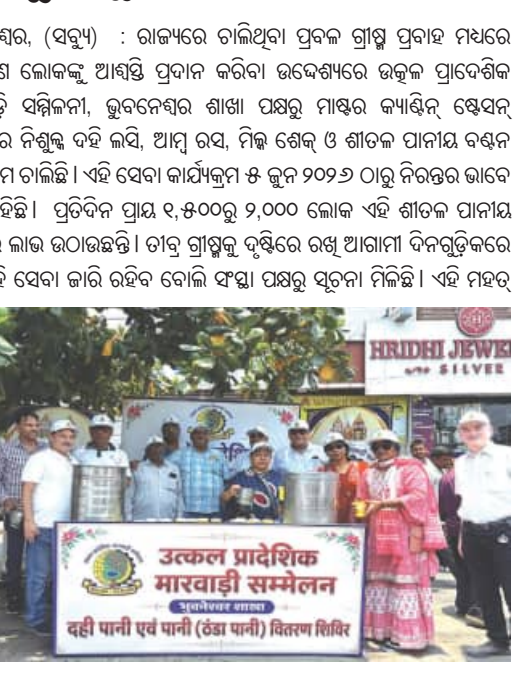
ଭୁବନେଶ୍ୱର, (ସବୁଧ୍ୱ) : ରାଜ୍ୟରେ ତାଲିଥିବା ପ୍ରକଳ ଗ୍ରାସ୍ତ୍ର ପ୍ରଦାନ ମଧ୍ୟରେ ସାଧାରଣ ଲୋକଙ୍କୁ ଆଶ୍ଚିତ ପ୍ରଦାନ କରିବା ଉଦ୍ଦେଶ୍ୟରେ ଉତ୍କଳ ପ୍ରାଦେଶିକ ମାରଖାଡ଼ି ସମ୍ମିଳନୀ, ଭୁବନେଶ୍ୱର ଶାଖା ପକ୍ଷରୁ ମାଷ୍ଟର କ୍ୟାଣ୍ଡିନି ସେସନ୍ ନିକଟରେ ନିଶୁଙ୍କୁ ଦହି ଲାଭି, ଆମ୍ବ ରସ, ମିଠା ଶେକ୍ ଓ ଶୀତଳ ପାନୀୟ ବଣ୍ଟନ କାର୍ଯ୍ୟକ୍ରମ ଚାଲିଛି। ଏହି ସେବା କାର୍ଯ୍ୟକ୍ରମ ୫ ଜୁନ୍ ୨୦୨୬ ଠାରୁ ନିରନ୍ତର ଭାବେ ଜାରି ରହିଛି। ପ୍ରତିଦିନ ପ୍ରାୟ ୧,୫୦୦ରୁ ୨,୦୦୦ ଲୋକ ଏହି ଶୀତଳ ପାନୀୟ ପାଇବେ ଲାଭ ରାଉତରାଜି। ତାଙ୍କୁ ଗ୍ରାସ୍ତ୍ରକୁ ଦୃଷ୍ଟିରେ ରଖି ଆଗାମୀ ଦିନଗୁଡ଼ିକରେ ମଧ୍ୟ ଏହି ସେବା ଜାରି ରହିବ ବୋଲି ଫାହୁଡ଼ା ପକ୍ଷରୁ ସୂଚନା ମିଳିଛି। ଏହି ମହତ୍ୱ