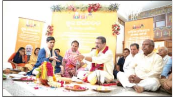
କରିଛନ୍ତି। ଏହି ଅବସରରେ ଗଣମାଧ୍ୟମକୁ ପ୍ରତିରୁଦ୍ଧ ଦେଇ ଶ୍ରୀ ପ୍ରଧାନ କହିଛନ୍ତି ଯେ, ପ୍ରଧାନମନ୍ତ୍ରୀ ଦେଶର ସେବା ପାଇଁ ନିଜକୁ

ଶରଣାପନ୍ନ ହୋଇ ଆଶୀର୍ବାଦ ଲାଭ କରିବାକୁ କେବେ ହେଲେ ଭୁଲିନାହାନ୍ତି। ମହାପ୍ରଭୁଙ୍କ ଶ୍ରୀଚରଣରେ ପ୍ରାର୍ଥନା କରି ଶ୍ରୀ ପ୍ରଧାନ କହିଛନ୍ତି ଯେ, ମହାପ୍ରଭୁଙ୍କ କୃପା ସମଗ୍ର ଦେଶବାସୀଙ୍କ ଉପରେ ରହିଛି ଏବଂ ଏହା ପ୍ରଧାନମନ୍ତ୍ରୀଙ୍କ ଉପରେ ମଧ୍ୟ ବଜ୍ରାୟ ରହିଛି। ପ୍ରଧାନମନ୍ତ୍ରୀଙ୍କ ସମର୍ପଣ ନେତୃତ୍ୱରେ ଆମ ଦେଶ ଜନସେବା ଓ ରାଷ୍ଟ୍ର ଗଠନର ମହାନ ଦାୟିତ୍ୱକୁ ସଫଳତାର ସହ ଆଗାକୁ ବଢ଼ାଇ ଚାଲି ନେତୃତ୍ୱରେ ୨୦୪୭ ସୁଦ୍ଧା ଭାରତ ଆହୁରି ବିକଶିତ, ସମୃଦ୍ଧ ଓ ପ୍ରଗତିଶୀଳ ହେବ ବୋଲି ଶ୍ରୀ ପ୍ରଧାନ ଆଶାପ୍ରକଟ କରିଛନ୍ତି।