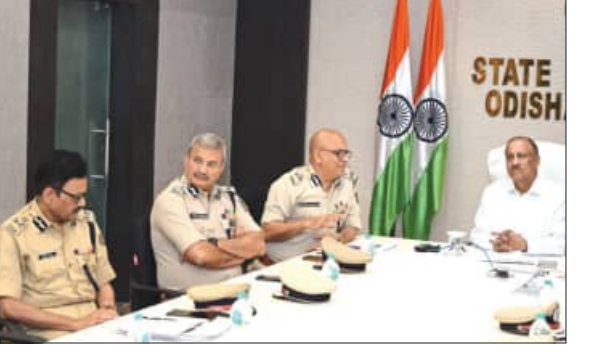
ଓ ଆଣ୍ଡି-ସାବୋଟାଜ୍ ବ୍ୟବସ୍ଥାକୁ ସମ୍ପୂର୍ଣ୍ଣ କ୍ରୟଶୀଳ ରଖିବାକୁ ନିର୍ଦ୍ଦେଶ ଦିଆଯାଇଛି। ମୟୂରଭଞ୍ଜ ପ୍ରମୁଖ ରାସ୍ତାମାନଙ୍କରେ ଆବଶ୍ୟକ ଟ୍ରାଫିକ୍ ଡ୍ରାଇଭର୍ସ ବ୍ୟବସ୍ଥା କରାଯିବ ଏବଂ କାର୍ଯ୍ୟକ୍ରମ ସମ୍ପର୍କରେ ନିକଟରେ ଅତିରିକ୍ତ ପାଳିଶୁଳା ତିହ୍ନଟ କରାଯାଇଛି। ଭିତ ନିୟନ୍ତ୍ରଣ ଓ ଜରୁରୀକାଳୀନ ପରିସ୍ଥିତିର