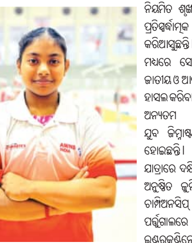
ପ୍ରାତି ଚ ଇଣ୍ଡିଆର ସ୍କୁଲରସିପ୍ ପାଇଁ ପାଇବେ। ଓଡ଼ିଶାର ଭୁବନେଶ୍ୱର ଦାସିଆ ପ୍ରାତି ଗତ ଦିନ ଏହି ବର୍ଷର ଏସିପିରେ ପ୍ରତିଷ୍ଠା ନେଇଛନ୍ତି। ଏହି ସମୟରେ ସେ

ଭୁବନେଶ୍ୱର, (ସବୁଧ୍ୱ) : ଭାରତୀୟ ଜିମ୍ନାଷ୍ଟିକ୍ସ ଇତିହାସରେ ଏକ ଐତିହାସିକ ସଫଳତା ସ୍ୱରୂପ ଓଡ଼ିଶା ଏଏମ୍/ଏନ୍ଏସ୍ ଇଣ୍ଡିଆ ଜିମ୍ନାଷ୍ଟିକ୍ସ ହାଇ ପରଫର୍ମାନ୍ସ ସେଣ୍ଟର (ଏଏମ୍/ଏନ୍ଏସ୍)ର ୧୬ ବର୍ଷୀୟା ପ୍ରାତି ଝଙ୍କାର ପ୍ରଥମ ଭାରତୀୟ ମହିଳା ଜିମ୍ନାଷ୍ଟିକ୍ସ ଭାବେ ଖୁବ୍ ଜିମ୍ନାଷ୍ଟିକ୍ସ ସ୍କୁଲରସିପ୍ ୨୦୨୬ ହାସଲ କରିଛନ୍ତି। ବିଶ୍ୱ ଜିମ୍ନାଷ୍ଟିକ୍ସ ସେଣ୍ଟରରେ ସବୁଠାରୁ ପ୍ରତିଷ୍ଠିତ ଏବଂ ପ୍ରତିଷ୍ଠାକର୍ତ୍ତା ସମ୍ମାନ ମଧ୍ୟରୁ ଅନ୍ୟତମ ଏହି ସ୍କୁଲରସିପ୍ ଇଣ୍ଡିଆର ସମସ୍ତ ଜିମ୍ନାଷ୍ଟିକ୍ସ ପେଡେରେସନ୍ (ଏସ୍ଆଇ) ଦ୍ୱାରା ଅଧ୍ୟାଧାରଣ ପ୍ରତିଭା, ଉଚ୍ଚ ପ୍ରଦର୍ଶନ କ୍ଷମତା ଓ ଆନ୍ତର୍ଜାତୀୟ ସମ୍ମାନ ପ୍ରାପ୍ତ କର୍ମ ସେନାକିଙ୍କୁ ପ୍ରଦାନ କରାଯାଇଥିଲା। ଏହି ବର୍ଷ, ବିଶ୍ୱର ୨୦ଟି ଦେଶରୁ ମାତ୍ର ୧୬ ଜଣ ଜିମ୍ନାଷ୍ଟିକ୍ସ ମଧ୍ୟରୁ ତଥ୍ୟ ହୋଇଥିଲା