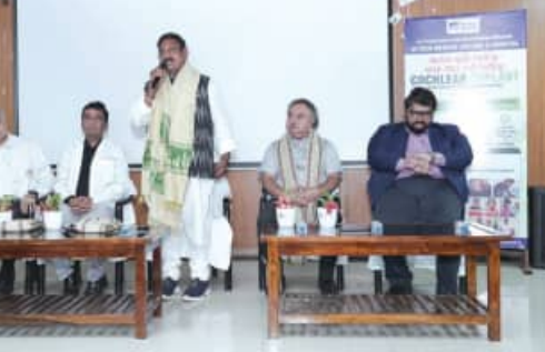
କହିପାରିବୁ ଓ ଶୁଣିପାରିବୁ ପ୍ରକାରୀ ପିଲାଙ୍କ ପାଇଁ ସେମାନଙ୍କ ପରିବାର ତିକ୍ତିତ ଥିବା ବେଳେ, ହାଇ-ଟେକ୍ ମେଡିକାଲ୍ କଲେଜ ଓ ହସ୍ପିଟାଲ୍ ଏବଂ ପିଲାଙ୍କ ଅଭ୍ୟାସରେ କରାଯାଇଛି। ଯାହାଦ୍ୱାରା ଆର୍ଥିକ ଦୃଷ୍ଟିରୁ ଅନୁଗ୍ରସ୍ୟ ପରିବାରଗୁଡ଼ିକ ଉପରୁ ଆର୍ଥିକ ବୋଧକୁ ପ୍ରଥମେ ମାତ୍ରରେ ହ୍ରାସ କରିପାରିଛି।

ଭୁବନେଶ୍ୱର, (ସବୁଧ୍ୱ) : ହାଇ-ଟେକ୍ ମେଡିକାଲ୍ କଲେଜ ଏବଂ ହସ୍ପିଟାଲ୍ କର୍ଷ୍ଣ, ନାଶା, ଗଲା ବିଭାଗ ଗୁରୁତର ଶ୍ରବଣ ଶକ୍ତି ହରାଇଥିବା ପିଲାମାନଙ୍କର ଶ୍ରବଣ ଏବଂ ଯୋଗାଯୋଗ କ୍ଷମତାର ପୁନରୁଦ୍ଧାର କରିବା ଦିଗରେ ଉଲ୍ଲେଖନୀୟ ସଫଳତା ହାସଲ କରିପାରିଛି। ବିଗତ ଏକ ବର୍ଷ ମଧ୍ୟରେ, ହସ୍ପିଟାଲ୍ ସଫଳତାର ସହ ୧୦ଟି କଲିୟର ଇମ୍ପ୍ଲୁଷ୍ ସର୍ଜରୀ ସମ୍ପନ୍ନ କରିଛି, ଯାହା ଶ୍ରବଣ ବାଧୁତ ଶିଶୁମାନଙ୍କ ପାଇଁ ଏକ ନୂତନ ଆଶା ଏବଂ ଉନ୍ନତ ଜୀବନଶୈଳୀ ଆଣିଦେଇଛି। ସର୍ଜରୀ ଏବଂ ସମର୍ପିତ ପୁନର୍ବାସ ପରେ, ସମସ୍ତ ଶିଶୁ ଏବେ ସଫଳତାର ସହ ଶବ୍ଦ ଶୁଣିବାକୁ ସକ୍ଷମ ହେଉଛନ୍ତି। ଆୟୁଷ୍ମାନ ଭାରତ ଯୋଜନାରୁ ପ୍ରଦତ୍ତ ଅର୍ଥ ସହ ହାଇ-ଟେକ୍ ମେଡିକାଲ୍ କଲେଜ ପକ୍ଷରୁ ଆବଶ୍ୟକୀୟ ଅର୍ଥ ପ୍ରଦାନ କରାଯାଇ ଏହି ଅଭ୍ୟାସରେ କରାଯାଇଛି। ଯାହାଦ୍ୱାରା ଆର୍ଥିକ ଦୃଷ୍ଟିରୁ ଅନୁଗ୍ରସ୍ୟ ପରିବାରଗୁଡ଼ିକ ଉପରୁ ଆର୍ଥିକ ବୋଧକୁ ପ୍ରଥମେ ମାତ୍ରରେ ହ୍ରାସ କରିପାରିଛି।