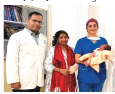
ସୃଷ୍ଟି ହୋଇପାରେ। ପ୍ରାରମ୍ଭିକ ପରାକ୍ଷା ସମୟରେ ହଠାତ୍ ମହିଳାଙ୍କ ହାର୍ଟ ବନ୍ଦ ହୋଇଯାଇଥିଲା। ସଙ୍ଗେ ସଙ୍ଗେ ଡାକ୍ତରୀ ଚିକିତ୍ସା ଡାକ୍ତରୀ ଦଳ ସିପିଆର ସହିତ ଜୀବନ ରକ୍ଷାକାରୀ ଚିକିତ୍ସା ଆରମ୍ଭ କରି ତାଙ୍କୁ ପୁଣି ଜୀବନ ଦେଇଥିଲେ। ଏହାପରେ ତାଙ୍କୁ ଭେଣ୍ଟିଲେଟର ସହାୟତାରେ ଆସିଥିଲେ ଭର୍ତ୍ତି କରାଯାଇଥିଲା।

ଭୁବନେଶ୍ୱର, (ସବୁଧ୍ୱ) : ସଠିକ ସମୟରେ ଚିକିତ୍ସା ଓ ଡାକ୍ତରୀ ଦଳର ନିରନ୍ତର ଉଦ୍ୟମ ପରେ ମଣିପାଲ ହସ୍ପିଟାଲ ଭୁବନେଶ୍ୱରରେ ଜଣେ ଗର୍ଭବତୀ ମହିଳା ଓ ତାଙ୍କ ନବଜାତ ଶିଶୁଙ୍କ ଜୀବନ ରକ୍ଷା କରାଯାଇଛି। ଗର୍ଭାବସ୍ଥାର ଶେଷ ସମୟରେ ମହିଳା ଜଣକ ଗୁରୁତର ଜଟିଳତାର ଶିକାର ହେବା ସହ ହଠାତ୍ ତାଙ୍କ ହାର୍ଟ ବନ୍ଦ ହୋଇଯାଇଥିଲା। ତେବେ ମଣିପାଲ ହସ୍ପିଟାଲର ଡାକ୍ତରମାନଙ୍କ ଚତୁରତା ଯୋଗୁଁ ମା' ଓ ଶିଶୁ ଉଭୟ ସୁସ୍ଥ ଅଛନ୍ତି। ଡେକାନାଲ ଜିଲ୍ଲାର ବାଲୁଗା ଗାଁର ଜଣେ ମହିଳା ଗର୍ଭାବସ୍ଥାର ଶେଷ ସମୟରେ ଥିବା ବେଳେ ରାତିରେ ହଠାତ୍ ଗୁରୁତର ଅସୁସ୍ଥ ଅନୁଭବ କରିଥିଲେ। ପରାକ୍ଷା ପରେ ତାଙ୍କ ଉଚ୍ଚତାପ ୨୦୦/୧୪୦ ଏଫଏସଏଚ୍ ପ୍ରତି ଡାକ୍ତରୀ ପଡ଼ିଥିଲା, ଯାହା ମା' ଓ ଶିଶୁଙ୍କୁ ଶିଶୁ ଉଭୟଙ୍କ ପାଇଁ ଅତ୍ୟନ୍ତ ବିପଦଜନକ ଥିଲା। ପ୍ରଥମେ ନିକଟସ୍ଥ ଏକ ସ୍ତ୍ରୀମାନଙ୍କ ନର୍ସିଂହୋମରେ ତାଙ୍କୁ ନିଆଯାଇଥିଲା। ସେଠାରେ ଡାକ୍ତରମାନେ ତାଙ୍କର ସ୍ୱାସ୍ଥ୍ୟାବସ୍ଥା ସୁସ୍ଥ ହେବା ପରେ ଡାକ୍ତରୀ ଓ କ୍ରିଟିକାଲ କେୟାର ଦୁଇଟି ଥିବା ଏକ ବଡ଼ ହସ୍ପିଟାଲକୁ ରୁଗ୍ଣ ସ୍ଥାନାନ୍ତର କରିବାକୁ ପରାମର୍ଶ ଦେଇଥିଲେ। ପରିବାର ଲୋକେ ତାଙ୍କୁ ଗୁରୁତ ମଣିପାଲ ହସ୍ପିଟାଲ ଭୁବନେଶ୍ୱରକୁ ନେଇଆସିଥିଲେ। ମଣିପାଲ ହସ୍ପିଟାଲ