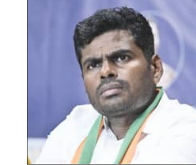
ଗଠନ କରିବେ ନୂଆ ଦଳ ଅବଦୁଲ କଲାମ ହେବେ ଆଦର୍ଶ

ନୂଆଦିଲ୍ଲୀ, ୫.୬ (ଏକେନି) : ତାମିଲନାଡୁ ରାଜନୀତିରେ ବଡ଼ ହଟତମଟ ବେଖିବାକୁ ମିଳୁଛି । ବିଜେପିର ପୂର୍ବତନ ତାମିଲନାଡୁ ସରକାରୀ କେ ଆନ୍ଧ୍ରାମଲା ବିଜେପିରୁ ଛାଡ଼ି ଦେଇଛନ୍ତି । ତାଙ୍କ ଇଚ୍ଛାକୁ ବଳାଇ ରାଷ୍ଟ୍ରୀୟ ସରକାରୀ ନାମ ନିର୍ବାଚନ ଗ୍ରହଣ କରିଛନ୍ତି । ଆନ୍ଧ୍ରାମଲା ୨ ଡାକ୍ଷିଣରେ, ସୁରାଷ୍ଟ୍ର ମନ୍ତ୍ରୀ ଅମିତ ଶାହା, କାତାୟ ସାଧାରଣ ସମାପକ ବିଏଲ୍ ସରୋଷଙ୍କୁ ଭେଟି ନିଜର ଇଚ୍ଛା ପୋଷିଥିଲେ । ସେ କଲର ପ୍ରାର୍ଥନା ସଦସ୍ୟ ପଦକୁ ଛାଡ଼ି ଦେଇଛନ୍ତି । ସେ ନୂଆ ଦଳ ଗଠନ କରିବେ ବୋଲି ନିଷ୍ପତ୍ତି ନେଇଛନ୍ତି ।