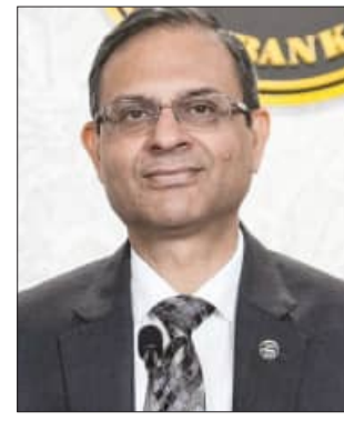
ହୋଇଥିବାରୁ ଏକଳ ନିଷ୍ପତ୍ତି ନିଆଯାଇଛି । ମଧ୍ୟପ୍ରାନ୍ତରେ ଯୁଦ୍ଧ ପରିସ୍ଥିତି ଯୋଗୁଁ ବିଶ୍ୱରେ ଶକ୍ତିକ୍ଷେତ୍ରରେ ବଦଳିଛି । ତେଣୁ

ନୂଆଦିଲ୍ଲୀ, ୫.୬ (ଏକେନି) : ଭାରତୀୟ ରିଜର୍ଭ ବ୍ୟାଙ୍କ (ଆର୍ବିଆଇ) ର ପୂର୍ବନାମ କମିଟି ବୈଠକରେ ରେପୋ ହାରକୁ ୫.୨୫%ରେ ଅପରିବର୍ତ୍ତିତ ରଖିବାକୁ ନିଷ୍ପତ୍ତି ନିଆଯାଇଛି । ଏହା ଘର, ଗାଡ଼ି ଓ ବ୍ୟକ୍ତିଗତ କାର୍ଯ୍ୟ ପାଇଁ ରଖି ନେଇଥିବା ଉପରୋକ୍ତ ପାଇଁ ଏକ ବଡ଼ ଆକୃଷ୍ଟ ମିଳିଛି । ଆର୍ବିଆଇର ଗଭୀର ସଞ୍ଚୟ ମାଲହୋତ୍ରାଙ୍କ ଅଧ୍ୟକ୍ଷତାରେ ୬ ଜଣିଆ ପୂର୍ବନାମ କମିଟିର ବୈଠକ ଅନୁଷ୍ଠିତ ହୋଇଥିଲା । କମିଟି ବୈଠକରେ ରେପୋରେଟ୍ ଅପରିବର୍ତ୍ତିତ ରଖିବା ପାଇଁ ନିଷ୍ପତ୍ତି ହୋଇଥିଲା ।