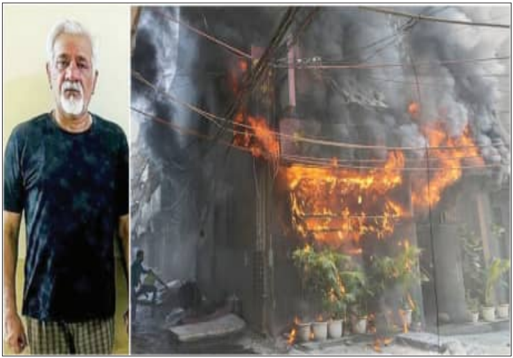
ଦିଲ୍ଲୀର ମାଲିକର ନଗରସ୍ଥିତ "ସୋରିଶ୍ ସେ" ବେଡ୍-ଏଣ୍ଡ-ବ୍ରେକଫାଷ୍ଟ ହୋଟେଲରେ ରୁଧିରା ଘଟଣାରେ ଘଟଣାସ୍ଥଳରେ ଥାନା ପହଞ୍ଚିବା ପରେ...