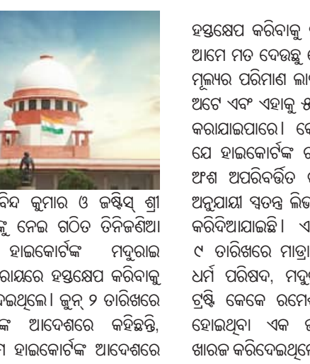
କର୍ଣ୍ଣାଟକର ନୂଆ ମୁଖ୍ୟମନ୍ତ୍ରୀ ତି.କେ. ଶିବକୁମାରଙ୍କୁ ନେଇ ଗଠିତ ତିନିଜଣିଆ ଖଣ୍ଡପୀଠ ହାଇକୋର୍ଟଙ୍କ ମନ୍ତୁରାଜ ଖଣ୍ଡପୀଠର ରାୟରେ ହସ୍ତକ୍ଷେପ କରିବାକୁ ମନା କରିଦେଇଥିଲେ।

ନୂଆଦିଲ୍ଲୀ: ରମଜାନ ମାସରେ ଅନୁଷ୍ଠିତ ମୁସଲିମ ଉତ୍ସବକୁ ଅନୁମତି ଦେଇ ତିରୁପୁରମକୁମ୍ଭୀର ପାହାଡ଼ରେ ହିନ୍ଦୁ ଉତ୍ସବମାନଙ୍କୁ ଦାମ କାଳିଦାରେ ବାଧା ଦେଇଥିବା ଅଭିଯୋଗରେ ସମ୍ପୂର୍ଣ୍ଣ ଅଧିକାରୀଙ୍କ ବିରୋଧରେ କାର୍ଯ୍ୟାନୁଷ୍ଠାନ ଦାବି କରି ମାତ୍ରାସ ହାଇକୋର୍ଟରେ ଆବେଦନ କରାଯାଇଥିଲା।