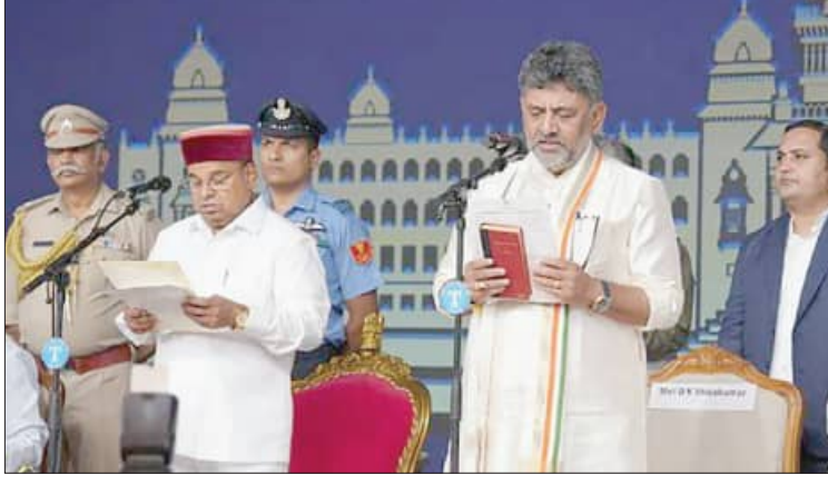
ଉତ୍ସବକୁ ଶିବ କୁମାର ନିମନ୍ତଣ କରିଥିଲେ । ଶପଥ ନେବା ପୂର୍ବରୁ ସେ ମହାନ୍ତମାନଙ୍କ ଆଶୀର୍ବାଦ ନେଇଥିଲେ । ଶିବ କୁମାରଙ୍କ ଶପଥ ପାଠ ଉତ୍ସବରେ କଂଗ୍ରେସ୍ ଅଧ୍ୟକ୍ଷ ମଲ୍ଲିକାର୍ଜୁନ ଖତ୍ତର, ସାମ୍ବଦ ରାଭୁଲ୍ ଗାଧି, ବରିଷ୍ଠ ନେତା କେସି ଭେନୁଗୋପାଳ, ରଣଦୀପ ସୁର୍ଯ୍ୟେଖାଲା, କଂଗ୍ରେସ୍ ଶାସିତ ରାଜ୍ୟମାନଙ୍କର ମୁଖ୍ୟମନ୍ତ୍ରୀମାନଙ୍କ ୦ରୁ ଆରମ୍ଭ କରି ଅନେକ ବରିଷ୍ଠ ନେତା ଓ ସମର୍ଥକ ଉପସ୍ଥିତ ରହିଥିଲେ । ଶପଥ ନେବା ପୂର୍ବରୁ ସେ ସମସ୍ତଙ୍କୁ ମଞ୍ଚ ଉପରେ ସମ୍ବର୍ଦ୍ଧନା କରିଥିଲେ ।

କେଟି ଆଶୀର୍ବାଦ ନେଇଥିଲେ । ଶିବ କୁମାରଙ୍କ ଶପଥ ପାଠ ଉତ୍ସବରେ ସବୁ ଧର୍ମର ଧର୍ମଗୁରୁଙ୍କୁ ଦେଖିବାକୁ ମିଳିଛି । ହିନ୍ଦୁ, ପୃଥ୍ୱୀଲିପି ଓ ଖ୍ରୀଷ୍ଟିୟାନ ଧର୍ମର ଧର୍ମ ଗୁରୁମାନେ ବିଭିନ୍ନ ମନ୍ତ୍ର ପାଠ କରି ଶପଥ ପାଠ ଉତ୍ସବକୁ ଆହୁରି ସ୍ୱତନ୍ତ୍ର କରିଛନ୍ତି । ବିଭିନ୍ନ ମଠର ମହାନ୍ତଙ୍କୁ ନିଜ ଶପଥ ପାଠ