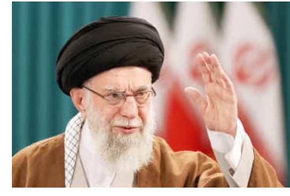
ପଞ୍ଚାଙ୍ଗରେ ରାଜନୈତିକ ଦେଖାଯାଇଛି । ଅନ୍ତର୍ଜାତୀୟ ଏବଂ ସୁରକ୍ଷା କାରଣରୁ ଏହି ଶେଷକୃତ୍ୟ ପ୍ରକ୍ରିୟାରେ ବିଳମ୍ବ ହୋଇଥିବା ବେଳେ ବର୍ତ୍ତମାନ ପର୍ଯ୍ୟବେକ୍ଷକମାନେ ଏହି ବିଶାଳ ଆୟୋଜନ ଉପରେ ତୀକ୍ଷ୍ଣ ନଜର ରଖିଛନ୍ତି ।

ଜରାନ ପ୍ରଶାସନର ଆକଳନ ଅନୁଯାୟୀ, ଏହା ଦେଶର ଇତିହାସରେ ସବୁଠାରୁ ବଡ଼ ଅନ୍ତେଷ୍ଟି କ୍ରିୟା ମଧ୍ୟରୁ ଏକ ହେବ, ଯେଉଁଥିରେ ସାମିଲ ହେବା ପାଇଁ ପ୍ରାୟ ୨ କୋଟି ଶୋକାଳୁଳ ଜନତା ମସହାଦରେ ସୁରକ୍ଷା ବ୍ୟବସ୍ଥାକୁ ଅତି କଡ଼ାକଡ଼ି କରାଯାଇଛି । ଧାର୍ମିକ ନେତାମାନେ ଆଧୁନିକ ଜରାନ ଗଠନରେ ଖେମିନିକ ଅବଦାନକୁ ସ୍ମରଣ କରୁଥିବା ବେଳେ ଏହି କାର୍ଯ୍ୟକ୍ରମକୁ ଜାତୀୟ ଏକତାର ଏକ ମାଧ୍ୟମ ଭାବେ