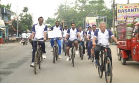
ଅଧିକୃମ କରି ନୂଆପାଠୀ କନ୍ୟାମୟ ଠାରେ ସମାପ୍ତ ହୋଇଥିଲା । ଏଥିରେ ବିଶ୍ୱବିଦ୍ୟାଳୟର ୮୦ରୁ ଅଧିକ ଶିକ୍ଷକ, ଅଣଶିକ୍ଷକ କର୍ମଚାରୀ ଓ ଛାତ୍ରଛାତ୍ରୀ ଉଭାସର ସହ ଅଂଶଗ୍ରହଣ କରିଥିଲେ । ସାଇକେଲ ଦ୍ରବ୍ୟହାର ଦ୍ୱାରା ଶାରୀରିକ ସୁସ୍ଥତା ବୃଦ୍ଧି, ପ୍ରତ୍ୟକ୍ଷ ହ ରାସ ଓ ସ୍ଥାୟୀ ପରିବହନ ବ୍ୟବସ୍ଥାକୁ ପ୍ରୋତ୍ସାହନ ମିଳୁଥିବା ସମ୍ପର୍କରେ ଜନସଚେତନତା ସୃଷ୍ଟି କରିବା ଏହି କାର୍ଯ୍ୟକ୍ରମର ପ୍ରମୁଖ ଉଦ୍ଦେଶ୍ୟ ଥିଲା । ଏହି କାର୍ଯ୍ୟକ୍ରମ ମାଧ୍ୟମରେ ଫକୀର ମୋହନ ବିଶ୍ୱବିଦ୍ୟାଳୟ ପରିବେଶ ସଚେତନତା, ସୁସ୍ଥ ଜୀବନଶୈଳୀ ଓ ପ୍ରାକୃତିକ ସମ୍ପଦର ଦାୟିତ୍ୱଶୀଳ ବ୍ୟବହାର ପ୍ରତି ନିଜର ଦାୟିତ୍ୱ ଓ ପ୍ରତିବଦ୍ଧତାକୁ ପ୍ରମାଣିତ କରିଛି ।