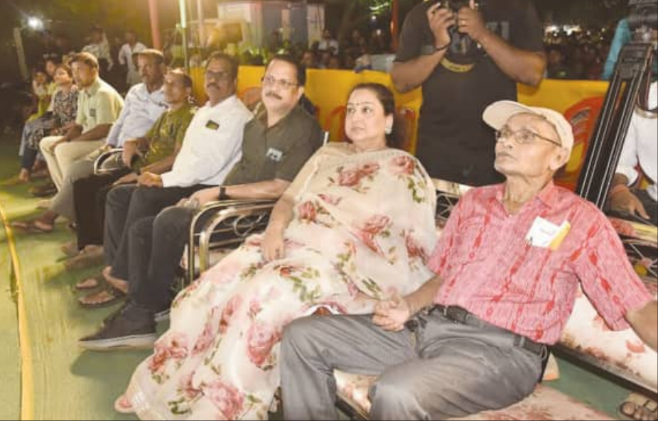
ଉତ୍ସବରେ ନିମନ୍ତ୍ରିତ ବିଶିଷ୍ଟ ବ୍ୟକ୍ତିଗଣ