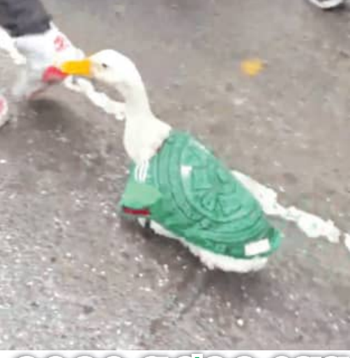
ବଚକର ପୁଟବଲ ପ୍ରେମ

ମେ କ୍ଷିକୋରେ ଫିଫା ଖାଲୁ କପର ଆରମ୍ଭ ସହିତ ପୁରୁଷଙ୍କୁ ପ୍ରତି ଲୋକଙ୍କ ଭଲପାଇବା ଖୁବ୍ ଅଧିକ ଦେଖିବାକୁ ମିଳୁଛି । ଏକ ପୋଷା ବଚକ ଜର୍ସି ପିନ୍ଧି ଏହି ଉତ୍ସବରେ ସାମିଲ ହେବାର ଏକ ଅତି ନିଆରା ଦୃଶ୍ୟ ସୋସିଆଲ ମିଡ଼ିଆରେ ଖୁବ୍ ଭାଇରାଲ ହେଉଛି । ମେକ୍ସିକୋ ସିଟିର ରାସ୍ତାରେ ଚାଲିଥିବା ଏହି ସେଲିବ୍ରିଟିସନ ମଧ୍ୟରେ ଏକ ସ୍ୱତନ୍ତ୍ର ବଚକ ସମସ୍ତଙ୍କ ଦୃଷ୍ଟି ଆକର୍ଷଣ କରିଛି । ସୋସିଆଲ ମିଡ଼ିଆରେ ଭାଇରାଲ ହେଉଥିବା ଏହି ଭିଡିଓରେ ଜଣେ ମା-ପୁଅ ରାସ୍ତାରେ ଚାଲି ଚାଲି ଯାଉଥିବା ବେଳେ ସେମାନଙ୍କ ପଛେ ପଛେ ଏହି ପୋଷା ବଚକଟି ମଧ୍ୟ ଚାଲୁଥିବାର ନଜର ଆସିଛି । ବଚକଟିକୁ ମେକ୍ସିକୋର ଜର୍ସି ପିନ୍ଧିଥିବାର ଦେଖିବାକୁ ମିଳୁଛି, ଯାହା ସୋସିଆଲ ମିଡ଼ିଆରେ ବିଶେଷଭାବେ ଭାଇରାଲ ହେଉଛି । ଲୋକମାନେ ଭିଡିଓଟିକୁ ଖୁବ୍ ଭଲପାଇବା ଦେଖିଥିବା ଦେଖିବାକୁ ମିଳୁଛି ।