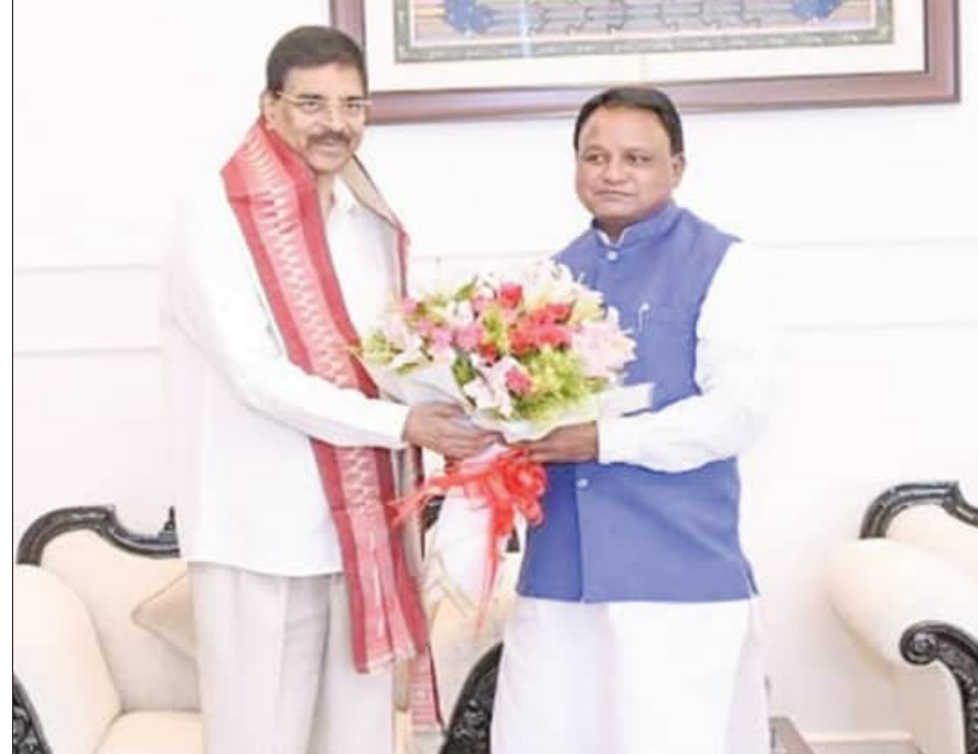
ଲୋକ ଭବନରେ ମୁଖ୍ୟମନ୍ତ୍ରୀ ମୋହନ ଚରଣ ମାଝୀ ରାଜ୍ୟପାଳ ଡଃ ହରିବାବୁ କନ୍ୟାପାଟିଲଙ୍କୁ ସାକ୍ଷାତ କରି ଜନ୍ମଦିନର ଶୁଭେଚ୍ଛା ଜଣାଇଛନ୍ତି ।

ଡେଲାଇ, (ସବୁ): ଡେଲାଇ ଜିଲ୍ଲାର ଅନ୍ତର୍ଗତ ଖଣ୍ଡମଙ୍ଗଳପୁର ଗ୍ରାମର ଜଣେ ୮ ବର୍ଷର ନାବାଳକଙ୍କୁ ପିତାପାଟଣା ଗ୍ରାମ ଛକଠାରୁ ଉଦ୍ଧାର କରାଯାଇଛି । ତେବେ ମିଳିଥିବା ସୂଚନା ମୁତାବକ ନାବାଳକ ଜଣକ ମଙ୍ଗଳମୁଖୀ ଭାବରେ ଉଦ୍ଧାର ହୋଇଛନ୍ତି । ନାବାଳକ ବାପା ତାଙ୍କୁ ଖଣ୍ଡମଙ୍ଗଳପୁର ଗାଁକୁ ନେଇ ଯାଇଥିଲେ । ଗାଁ ଘରେ ରହିବନି ଯିବି ଧରି ମାଉସା ଘରେ ରହିବ ସେଥିପାଇଁ ଘରୁ ଏକ୍ସିଟିଆ ପିପିଲି-ଡେଲାଇ ରାସ୍ତା ଦେଇ ଡେଲାଇ ଷ୍ଟେସନ ଲେଗୁଲ କ୍ରାସି ପାର ହୋଇ ପିତାପାଟଣା ଛକ ନିକଟରେ ପହଞ୍ଚିଥିଲା । ତାଙ୍କୁ ଗାଳିଚାରେ ଉପରେ ସହେହ ପ୍ରକାଶ ହେବାକୁ ସ୍ଥାନୀୟ ଯୁବକ ତାଙ୍କୁ ରଖି ଡେଲାଇ ପୁଲିସକୁ ଖବର ଦେଇଥିଲେ ।