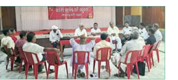
ଶୃଙ୍ଖଳା ପରିସ୍ଥିତି ନିୟନ୍ତ୍ରଣ ଦାବିରେ ଜିଲ୍ଲାବ୍ୟାପୀ ବିଶେଷ ପ୍ରଦର୍ଶନ କରିବା ପାଇଁ ପ୍ରସ୍ତାବ ଗ୍ରହଣ କରାଯାଇଛି । ସେହିଭଳି ମନରେଗାରେ କାମ, ତାଷାଙ୍କୁ ସାର ଓ ଅନ୍ୟାନ୍ୟ ଉପକରଣ ଯୋଗାଇ ଦେବା ପାଇଁ ସରକାର ଦୃଢ଼ କାର୍ଯ୍ୟାନୁଷ୍ଠାନ ଗ୍ରହଣ କରିବା

ବୁଢ଼ପୁର, (ସବୁ୍ୟ) : ଆଇନ ଶୃଙ୍ଖଳା ବିପର୍ଯ୍ୟୟ ଓ ରାଜନୈତିକ ଚର୍ଚ୍ଚା ଉପରେ ସିପିଏମର ଦୁଇ ଦିନିଆ ଜିଲ୍ଲା କମିଟି ବୈଠକ ଆହୁରି ହୋଇଯାଇଛି । ଏହି ବୈଠକରେ ଜିଲ୍ଲାର ରାଜନୈତିକ ଓ ସାଙ୍ଗଠନିକ ଅବସ୍ଥା ସମ୍ପର୍କରେ ପର୍ଯ୍ୟାଲୋଚନା କରାଯାଇଥିଲା । ଶେଷରେ ବାର୍ଦ୍ଧକ୍ୟ ଭରା, ପେଟ୍ରୋଲ ଡିଜେଲ ଓ ଗ୍ୟାସର ଦର ବୃଦ୍ଧି, ବିଦ୍ୟୁତ ବିଭ୍ରାଟ ଓ ଆଇନ