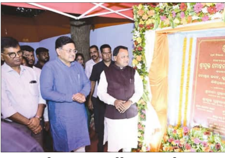
ଭୁବନେଶ୍ୱର ମୁକ୍ତି ୨ରେ ଜନଶ୍ରୀୟ ଭବନର ଭିତ୍ତି ପ୍ରସ୍ତର ସ୍ଥାପନ କରୁଛନ୍ତି ମୁଖ୍ୟମନ୍ତ୍ରୀ ମୋହନ ଚରଣ ମାଝା

ଭୁବନେଶ୍ୱର(ସବୁ): ଜୟଦେବ ବିହାର-ନନ୍ଦନକାନନ ରାସ୍ତା ଭିତରୁ ମିଳିବ ମୁକ୍ତି । ମାତ୍ର ୧୦ ମିନିଟ୍‌ରେ ସିଆରପି ଛକରୁ ବାହାରି ଇନପୋସିଟିରେ ପହଞ୍ଚି ହେବ । ବହୁ ପ୍ରତିଷ୍ଠିତ ଏକାମ୍ର କାନନରୁ ଓଜଆରସି ଯାଏଁ ନୂଆ ରାସ୍ତା ଆଜି ଉଦ୍ଘାଟିତ ହୋଇଛି । ଆଇଏଏଏସ୍ ଜୟଦେବ ବିହାର ନୂତନ ରାସ୍ତାକୁ ଉଦ୍ଘାଟନ କରିଛନ୍ତି ମୁଖ୍ୟମନ୍ତ୍ରୀ ମୋହନ ଚରଣ ମାଝା । ରାଜ୍ୟ ସରକାରଙ୍କ ଦୁଇ ବର୍ଷ ପୂର୍ଣ୍ଣ ଅବସରରେ ଏହି ରାସ୍ତାକୁ ଉଦ୍ଘାଟନ କରାଯାଇଛି । ରାଜଧାନୀରେ ଗ୍ରାମିକ ଭିତକୁ କମାଇବ ଏହି ରାସ୍ତା । ବିଶେଷ କରି ଜୟଦେବ ବିହାରରୁ ପଡିଆ ପର୍ଯ୍ୟନ୍ତ ଯାଉଥିବା ଯାତ୍ରୀଙ୍କ ପାଇଁ ଏହା ହେବ ବିକଳ ରାସ୍ତା । ଉଦ୍ଘାଟନ କାର୍ଯ୍ୟକ୍ରମରେ ଭୁବନେଶ୍ୱର ସଂସଦ ଅପରାଜିତ ଷଡ଼ଙ୍ଗୀ, ପୂର୍ଣ୍ଣ ମନ୍ତ୍ରୀ ପୃଥ୍ୱୀରାଜ ହରିଚନ୍ଦନ, ଉପମୁଖ୍ୟମନ୍ତ୍ରୀ ପ୍ରତାପା ପରିଡା, ବିଏମସି କମିଶନରଙ୍କ ସମେତ ବରିଷ୍ଠ ଅଧିକାରୀ ଉପସ୍ଥିତ ଥିଲେ ।