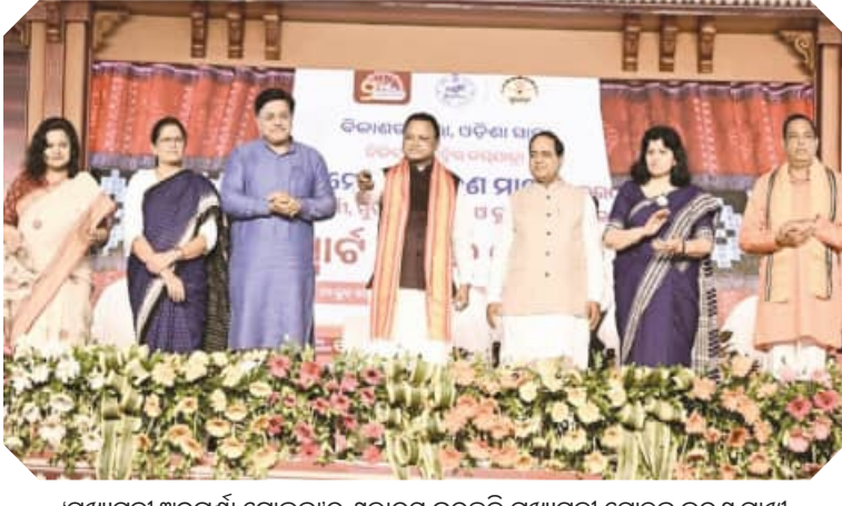
ମୁଖ୍ୟମନ୍ତ୍ରୀ ଅନୁପୂର୍ଣ୍ଣା ଯୋଜନା ଶୁଭାରମ୍ଭ କରୁଛନ୍ତି ମୁଖ୍ୟମନ୍ତ୍ରୀ ମୋହନ ଚରଣ ମାଝା