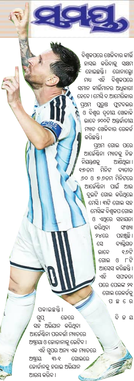
ପକାଇଛନ୍ତି । ଗୁପ୍ତ କେନ୍ଦ୍ରରେ ସହ ଅଭିଯାନ କରିଥିବା ଆଜେର୍ସିନା ପରବର୍ତ୍ତୀ ମ୍ୟାଚରେ ଅଷ୍ଟ୍ରାଲିଆ ଓ କୋଚିନାକୁ ଭେଟିବ । ଏହି ଗୁପ୍ତ ଅନ୍ୟ ଏକ ମ୍ୟାଚରେ ଅଷ୍ଟ୍ରାଲିଆ ୩-୧ ଗୋଲରେ କୋଚିନାକୁ ହରାଇ ଅଭିଯାନ ଆରମ୍ଭ କରିବ ।

ରଣକ୍ଷମତାକୁ କେବି ମେସିଙ୍କୁ ସୁନ୍ଦର ପାସ ଦେଇଥିଲେ । ଏହାକୁ ମେସି ଚମତ୍କାର ଭାବେ ନିୟନ୍ତ୍ରଣ କରି ଆଲଜେରିଆ ଗୋଲପୋଷ୍ଟ ଭିତରକୁ ବଲ ମାରି ଥିଲେ । ପ୍ରାୟ କିମ୍ବଦନ୍ତୀ କେନେଡାଲନ ଜିଡାନଙ୍କ ପୁଅ ଲୁକା ଜିଡାନ ଆଲଜେରିଆ ପାଇଁ ଗୋଲକିପର ଭୂମିକା ତୁଳାଇଛନ୍ତି । ମେସିଙ୍କ ସତ୍ତ୍ୱେ ଅଟକାଇବାର ସେ ସମର୍ଥ ହୋଇନଥିଲେ । ପ୍ରଥମ ବିଶ୍ୱକପ ଗୋଲର ୨୦ ବର୍ଷ ପୂର୍ତ୍ତୀ ଅବସରରେ ମେସି ଏହି ଗୋଲ କରିଥିଲେ । ୨୦୦୬ ଜୁନ ୧୨ରେ ସର୍ବଶ୍ରେଷ୍ଠ ମନେହେଉଥିବା ବିଶ୍ୱକପ ପ୍ରଥମ ବିଶ୍ୱକପ ଗୋଲ କରିଥିଲେ । ଏଥିସହ ସେ କ୍ରିଷ୍ଟିଆନୋ ରୋନାଲ୍ଡୋଙ୍କ ପରେ ୫ଟି ଭିନ୍ନ ବିଶ୍ୱକପରେ ଗୋଲ କରିଥିବା ଦ୍ୱିତୀୟ ପୁରୁଷ ଖେଳାଳି ହୋଇଥିଲେ । ମେସି ଆଉ ଏକ ଐତିହାସିକ ସମ୍ପର୍କରେ ହାସଲ କରିଛନ୍ତି । ସେ ବିଶ୍ୱର ପ୍ରଥମ ପୁରୁଷ ଗୋଲ ଭାବେ ୬ଟି