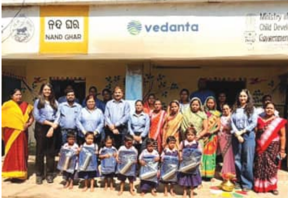
ଭାବରେ ପୁନଃବନ୍ଧନ କରିଛି। ବେଦାନ୍ତ ଆଲୁମିନିୟମ ଝାରସୁଗୁଡା ଜିଲ୍ଲାର ୨୫୦ ଟି ନୟନର ପ୍ରତିଷ୍ଠା କରିଛି, ଯାହାକି ୪,୦୦୦ ରୁ ଅଧିକ ପିଲାଙ୍କୁ ପ୍ରାରମ୍ଭିକ ଶିକ୍ଷା, ଚିତ୍ତ ଇଂସାନ୍ତକୁ ଶିକ୍ଷଣ ମୂଲ୍ୟ ଏବଂ ଶିକ୍ଷଣ ସହାୟକ ଭାବରେ ନିର୍ମାଣ ବୈଶିଷ୍ଟ୍ୟ ସହିତ ସଜ୍ଜିତ ହୋଇଥାଏ କାହିଁ, ମହଲା ଏବଂ ସ୍ଥାନଗୁଡ଼ିକ କାର୍ଯ୍ୟକଳାପ-ଉଚିତ

ଭୁବନେଶ୍ୱର, (ସବୁ) : ପ୍ରାଚ୍ୟ ଶୈଶବ ଶିକ୍ଷା ଏବଂ ବିକାଶକୁ ଆଗକୁ ବଢାଇବା ପାଇଁ ଏହାର ପ୍ରତିବନ୍ଧକତାକୁ ସୁଦୃଢ କରି, ଭାରତର ସର୍ବବୃହତ ଆଲୁମିନିୟମ ଉତ୍ପାଦକ ବେଦାନ୍ତ ଆଲୁମିନିୟମ ଝାରସୁଗୁଡା ଜିଲ୍ଲାର ୧୨୫ ଟି ବେଦାନ୍ତ ନୟନରେ ଶୁଳ୍ଭ ବ୍ୟାପ ଏବଂ ପାଣି ବୋତଲର ବନ୍ଧନ ଅଭିଯାନ ଆରମ୍ଭ କରାଯାଇଛି। ଏହି ପଦକ୍ଷେପର ଏକ ଅଂଶ ଭାବରେ, କମ୍ପାନୀ ନେତୃତ୍ୱ ଜିଲ୍ଲାର ଗ୍ରାମଗୁଡ଼ିକୁ ଗସ୍ତ କରି ଦୁଇଟି ଛଅ ବର୍ଷ ବୟସର ୨,୩୦୦ ରୁ ଅଧିକ ପିଲାଙ୍କୁ ଶିକ୍ଷଣ କିଟ୍ ବଣ୍ଟନ କରାଯାଇଥିଲା। ଅନାଥ ଅଗ୍ରଣୀୟ ପାଠକୃଷ୍ଣସନର ତତ୍ତ୍ୱବାଧାନରେ ନିୟୋଜିତ ଏବଂ ମହିଳା ଏବଂ ଶିଶୁ ବିକାଶ ମନ୍ତ୍ରାଳୟର ସହିତ ମିଳିତ ଭାବରେ କାର୍ଯ୍ୟକାରୀ ହୋଇଥିବା, ନୟ ନ ହେଉଛି ବେଦାନ୍ତ ଗୁପ୍ତର ପ୍ରମୁଖ ସମ୍ପ୍ରଦାୟ ବିକାଶ ପ୍ରକଳ୍ପ।