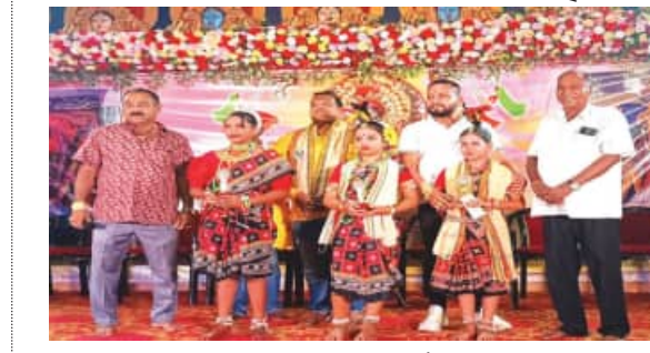
ଏହି ପରିପ୍ରେକ୍ଷାରେ ପ୍ରତ୍ୟେକ ଦିନ ସକାଳ ୯ ଘଟିକା ଠାରୁ ରାତ୍ର ୮ ଘଟିକା ପର୍ଯ୍ୟନ୍ତ ମା ଧାକୁଲେଇଙ୍କ ପାଠରେ ବିଭିନ୍ନ ପ୍ରକାରର ପ୍ରତିଯୋଗିତା କରାଯାଇ ବିଜୟ ପ୍ରତିଯୋଗିତାକୁ ପୁରସ୍କୃତ କରାଯାଇଥିଲା । ପ୍ରାୟ ୬୦ ଟି ଦୋଳି ଓ ମାନବକାରୀ ଲାଗିଥିବାରୁ ଶହଶହ ସଂଖ୍ୟାରେ ଯୁବତା ଓ ମହିଳାଙ୍କ ସମାଗମ ହୋଇଥିଲା । ଏଭଳି ସ୍ଥିତିରେ ମହିଳାଙ୍କ ସୁରକ୍ଷା ଓ ସେମାନେ କିଭଳି ଆନନ୍ଦ

କଟକ, (ସପ୍) : ମା ଧାକୁଲେଇ ରଜ ମହୋତ୍ସବ ଯୁବକ ସଂଘ ଦ୍ୱାରା ଚାରି ଦିନ ଧରି ରଜ ଉତ୍ସବ ପାଳିତ ହୋଇଯାଇଛି ।