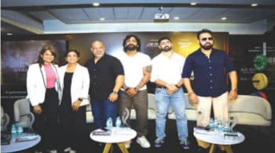
ଅଧିକ ଏହି କାର୍ଯ୍ୟକ୍ରମକୁ ସମଗ୍ର ଦେଶର ପିଟ୍‌ନେସ୍ ଉତ୍ସାହୀ, ଆଥଲେଟ୍, କିମ୍ ଯାଉଥିବା ବ୍ୟକ୍ତି ଏବଂ ବୈନିଦିନ ବାଲେଶ୍ୱରୀମାନଙ୍କୁ ଗୋଟିଏ ସ୍ଥାନରେ ଏକତ୍ରିତ କରିବା ନିମନ୍ତେ ଏକ ଦୃଢ଼ବାକାୟ ଅଭିଯାନ ଭାବରେ ପରିକଳ୍ପନା କରାଯାଇଛି । ଏହି ଏକ-ଦିବସୀୟ ଚମ୍ପିଆନସିପ୍ ନିମନ୍ତେ ପଞ୍ଜିକରଣ ଆରମ୍ଭ ହୋଇଛି ଏବଂ ଏହାର ପ୍ରଥମ ସଂସ୍କରଣ ପୂର୍ଣ୍ଣାଙ୍ଗରେ ଡିସେମ୍ବର ୩୦, ୨୦୨୨ରେ ଅନୁଷ୍ଠିତ ହେବ । ଏହାର ପ୍ରଥମ ସଂସ୍କରଣ ନିମନ୍ତେ ଅଂଗ୍ରହଣକୁ ପ୍ରଥମ ୫୦୦ ପ୍ରଦେଶରେ ସାମିତ ରଖାଯିବ । କାର୍ଯ୍ୟକ୍ରମ ନିମନ୍ତେ ପଞ୍ଜିକରଣ କରିବାକୁ ଅଂଗ୍ରହଣକାରୀ www.lastonestanding.in ପରିଦର୍ଶନ କରିପାରିବେ ।

ଭୁବନେଶ୍ୱର, (ସବୁ) : ଭାରତରେ ପିଟ୍‌ନେସ୍ ଉପକରଣର ସ୍ୱଚ୍ଛତା ଉତ୍ପାଦନ କ୍ଷେତ୍ରରେ ଏକ ଅଗ୍ରଣୀ କମ୍ପାନୀ ଜେରାଇ ପିଟ୍‌ନେସ୍ ଲିମିଟେଡ୍ ବିକଳ୍‌ ଏହାର ପକ୍ଷସ୍ୱରୂପ ଓ ପିଟ୍‌ନେସ୍ ସାମଗ୍ରୀର ଅଂଶାଦାର ଭାବରେ ନେଇ ଏହି ଧରଣର ପ୍ରଥମ ଜାତୀୟତ୍ୱର ସାମଗ୍ରୀ ଓ ସହନଶୀଳତା ଚମ୍ପିଆନସିପ୍ 'ଲାଷ୍ଟ ଷ୍ଟାଣ୍ଡି' ଶୁଭାରମ୍ଭ ସମ୍ପର୍କରେ ଘୋଷଣା କରିଛି । ଏକ ପିଟ୍‌ନେସ୍ ପ୍ରତିଯୋଗିତା ଯଥେଷ୍ଟ