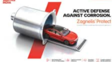
ପ୍ରସ୍ତୁତ କରାଯାଇଛି । ଯେଉଁଥିରେ ଚେସିସ୍ ପାର୍ଟସ୍, ତୋର ଭିତର ପ୍ୟାନେଲ୍, ହୁଡ୍/ବନେଟ୍ ଭିତର ପ୍ୟାନେଲ୍ ଏବଂ ଡେକ୍‌ଲିଟ୍/ଚେକ୍‌ଗେଟ୍ ଭିତର ପ୍ୟାନେଲ୍ ଅନ୍ତର୍ଭୁକ୍ତ । ବିଶ୍ୱ ସ୍ତରରେ, ଜାଗନେଲିଷ୍ଟ ପ୍ରୋଟେକ୍ଟ କୋଟି ପାରମ୍ପରିକ ଗାଲଭାମାଲକ୍‌ଡ୍ (ଜିଆଇ) କୋଟି ତୁଳନାରେ ଯଥେଷ୍ଟ ଅଧିକ କ୍ଷମ

କାର୍ଯ୍ୟକ୍ଷମତା ମାଧ୍ୟମରେ ଉନ୍ନତ ଲାଭ ପ୍ରଦାନ କରିବ । ପ୍ରାରମ୍ଭିକ ସ୍ତରରେ ମୋଟର କର୍ମ ଉପରେ ଗୁରୁତ୍ୱ ଦେଇ ଏହାର ଶୁଭାରମ୍ଭ କରାଯାଇଥିଲେ ମଧ୍ୟ, ଜାଗନେଲିଷ୍ଟ ପ୍ରୋଟେକ୍ଟ କୁ ବ୍ୟାପକ ପରିମାଣରେ ଅଟୋମୋଟିଭ୍ ପ୍ରୟୋଗ ପାଇଁ ମଧ୍ୟ ପ୍ରସ୍ତୁତ କରାଯାଇଛି । ଯେଉଁଥିରେ ଚେସିସ୍ ପାର୍ଟସ୍, ତୋର ଭିତର ପ୍ୟାନେଲ୍, ହୁଡ୍/ବନେଟ୍ ଭିତର ପ୍ୟାନେଲ୍ ଏବଂ ଡେକ୍‌ଲିଟ୍/ଚେକ୍‌ଗେଟ୍ ଭିତର ପ୍ୟାନେଲ୍ ଅନ୍ତର୍ଭୁକ୍ତ । ବିଶ୍ୱ ସ୍ତରରେ, ଜାଗନେଲିଷ୍ଟ ପ୍ରୋଟେକ୍ଟ କୋଟି ପାରମ୍ପରିକ ଗାଲଭାମାଲକ୍‌ଡ୍ (ଜିଆଇ) କୋଟି ତୁଳନାରେ ଯଥେଷ୍ଟ ଅଧିକ କ୍ଷମ