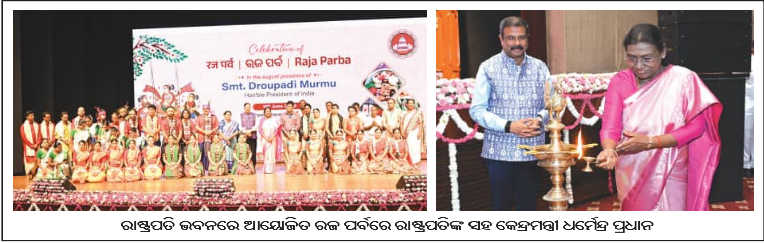
ରାଷ୍ଟ୍ରପତି ଭବନରେ ଆୟୋଜିତ ରଜ ପର୍ବରେ ରାଷ୍ଟ୍ରପତିଙ୍କ ସହ କେନ୍ଦ୍ରମନ୍ତ୍ରୀ ଧର୍ମେନ୍ଦ୍ର ପ୍ରଧାନ