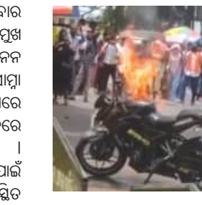
ଯାଇଥିଲେ । ବାଇକର ଇଞ୍ଜିନରୁ ପ୍ରାୟେ ଧୂଆଁ ବାହାରିଥିଲା । କିଛି ସେକେଣ୍ଡ ମଧ୍ୟରେ ନିଆଁ ବ୍ୟାପି ଯାଇଥିଲା । ସେହି ସମୟରେ ଚେଟ ନିକଟରେ ଶହ ଶହ ପର୍ଯ୍ୟଟକଙ୍କ

ବାରଙ୍ଗ, (ସବୁ) : ବୁଧବାର ମହାନ୍ତ ସମୟରେ ରାଜ୍ୟର ପ୍ରମୁଖ ପର୍ଯ୍ୟଟନ ସ୍ଥଳୀ ନୟନକାନନ ପ୍ରାଣୀ ଉଦ୍ୟାନର ମୁଖ୍ୟ ଚେଟ ସାମ୍ରା ଏକ ଜନବହଳ ପୂର୍ଣ୍ଣ ରାସ୍ତାରେ ଏକ କଳା ରଙ୍ଗର ବାଇକରେ ହଠାତ ନିଆଁ ଲାଗିଯାଇଥିଲା । ଘଟଣାସ୍ଥଳରେ କିଛି ସମୟ ପାଇଁ ଆଡକିଟ ଖେଳିଯାଇଥିଲା । ଉପସ୍ଥିତ ଲୋକଙ୍କ କହିବା ମୁତାବକ, ଚେଟ ସମ୍ମୁଖରେ ଏକ ବାଇକରେ ଜଣେ ଯୁବକ ତାଙ୍କ ବାହକଙ୍କ ସହିତ ଗାଡ଼ିଟି ରାସ୍ତା କଡ଼ରେ ଛିଡ଼ା କରି ପାଖରେ ଥିବା ଦୋକାନକୁ