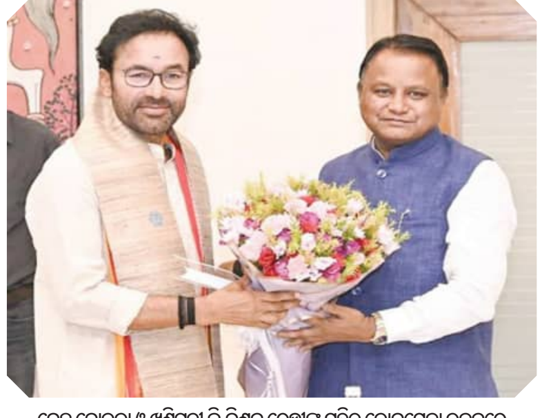
କେନ୍ଦ୍ର କୋଇଲା ଓ ଖଣିମନ୍ତ୍ରୀ କି.କିଶନ ରେଡ୍ଡୀଙ୍କ ସହିତ ଲୋକସେବା ଭବନରେ ଆଲୋଚନା କରୁଛନ୍ତି ପୁଖ୍ୟମନ୍ତ୍ରୀ ମୋହନ ଚରଣ ମାଝୀ ।