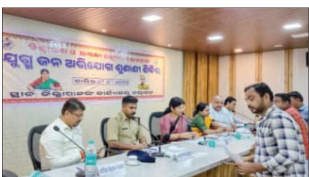
ସରପଞ୍ଚମନ୍ତ୍ରୀ ରେ ଅନୁଷ୍ଠିତ ଜନ ଅଭିଯୋଗ ଶୁଣାଣି ଶିବିରରେ ଆଗତ ୧୩୩ ଗୋଟି ଅଭିଯୋଗ ମଧ୍ୟରୁ ୧୨୭ଟି ବ୍ୟକ୍ତିଗତ