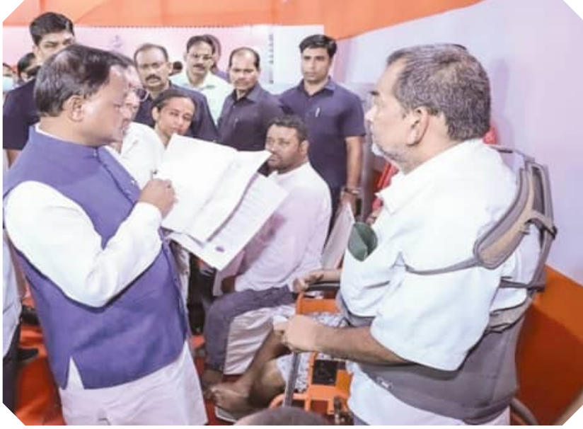
ଭୁବନେଶ୍ୱରରେ ସାଧାରଣ ଲୋକଙ୍କ ଅଭିଯୋଗ ଶୁଣାଣି କରୁଛନ୍ତି ପୁଖ୍ୟମନ୍ତ୍ରୀ ମୋହନ ଚରଣ ମାଝୀ ।