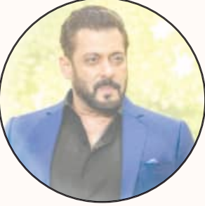
ସଲମାନ ଖାନ, ଅଭିନେତା

ପୂର୍ଣ୍ଣକ୍ରମେ ନିଜ ପାଇଁ କରି ନଥିଲୁ । ମୋ ପାଖରେ ଏକକି ଭଲପାଉଥିବା ପରିବାର ଓ ଆପଣଙ୍କ ଭଳି ଶୁଭାକାଂକ୍ଷୀମାନେ ଅଛନ୍ତି ତେଣୁ ମୁଁ କେବେ ବି ଏକ୍ସିଟିଆ ହୋଇ ପାରିବି ନାହିଁ । ବେଳେବେଳେ ମଣିଷଙ୍କ ଭିତରେ ବି ଚିତା ଲାଗିଥାଏ ।