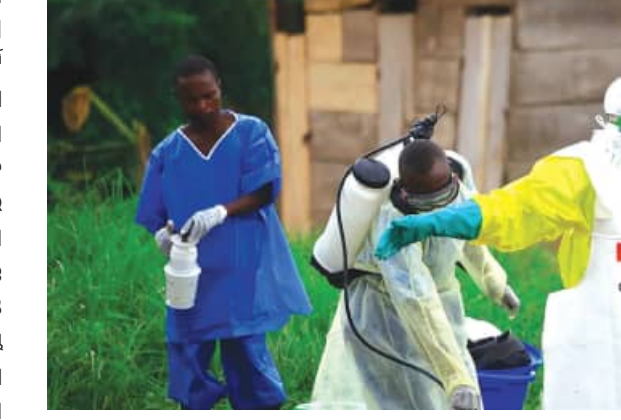
ତେବେ ଦୁତୀୟ ଥର ପାଇଁ ଏହା ଦୁର୍ଭିକ୍ଷରୋଗୀ ଭାବରେ ଘୋଷଣା ହୋଇଛି । ଉତ୍ତର କିଲୁର ବିଦ୍ୟୁତ୍ଘାତ ରାଜଧାନୀ ଗୋମା, ଗୋମାକୁଳୁ, ବୁଟେମ୍ବୋ ଏବଂ

ନାଇଜିରୀରେ ବୁନିଆରେ ଆକ୍ରାନ୍ତ ଚିହ୍ନ ହୋଇଛି । ବିଶ୍ଵ ସ୍ଵାସ୍ଥ୍ୟ ସଂଗଠନର ମହାନିର୍ଦ୍ଦେଶକ ଟେଡ୍ରୋସ ଆଧାନମ୍ ଘେଡ୍ରେସ୍ ସମ୍ମାନକାରୀ ଦିନ ଜେନେଭାରେ