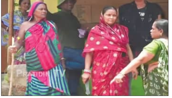
ନୋଟିସ୍ ନଦେଇ ହଟାତ ଆସି ଆମ ଘରଦାର ଭାଙ୍ଗୁଛନ୍ତି । ଆମେ ୪୦ବର୍ଷରୁ ଊର୍ଦ୍ଧ୍ୱ ଏହି ସ୍ଥାନରେ ରହିଆସୁଥିବାରୁ ଏ ଉଚ୍ଛେଦ ଖରାରେ କେଉଁଠି ରହିବୁ । ଉଚ୍ଛେଦକାରୀ ଦଳକୁ ଆମକୁ ଧରିବା ପରେ ଫେରିଆସିଥିଲେ ।