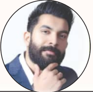
ଅକ୍ଷୟ ଶର୍ମା, ଅଭିନେତା

ଦୟାକରି ଆମକୁ ପ୍ରାଇଭେଟି ଦିଅନ୍ତୁ । ଆମ ଭିତରେ କୌଣସି ବିବାଦ ନାହିଁ କି ଆଲୁମନି ନେଶଦେଶ ହେବାର ନାହିଁ । ଗୁଜବ ପ୍ରଚାର କରନ୍ତୁ ନାହିଁ ।