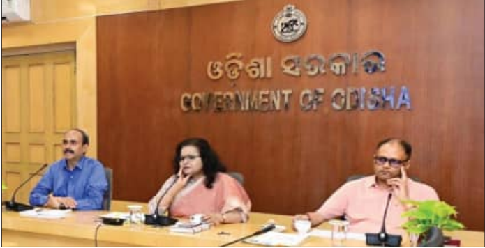
ମାସିକ ବୈଠକ କରି ବିଭାଗୀୟ କାର୍ଯ୍ୟ ସମୀକ୍ଷା ପୂର୍ବକ ସମ୍ପର୍କରେ ପ୍ରସ୍ତାବରେ ରହିଥିବା ବିଭିନ୍ନ ସମସ୍ୟାର ସମାଧାନ କରିବାକୁ ଜିଲ୍ଲାପାଳମାନଙ୍କୁ ସେ ନିର୍ଦ୍ଦେଶ ଦେଇଛନ୍ତି । ବୈଠକରେ ଯୋଜନା ଓ ସଂଯୋଜନ ବିଭାଗ ତରଫରୁ ସିଏମ-ସମ୍ପଦା ପ୍ରଗତି ସମୀକ୍ଷା ପ୍ଲଟଫର୍ମରେ ଖଣି ପ୍ରଭାବିତ ଅଞ୍ଚଳଗୁଡ଼ିକର ସାମଗ୍ରିକ ବିକାଶ ପାଇଁ