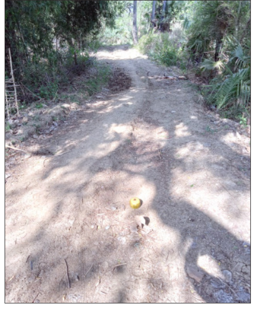
ନିମ୍ନ ମାନର ହେବା ଯୋଗୁଁ କିଛି ଦୂର ମାଟି, ମୋଟୁମୋଟୁ ପକାଯାଇ କାମ ବନ୍ଦ କରାଯାଇ

ଭାବେ କରାଯାଇ ଥିଲା । ଫଳରେ ୨୦୨୩-୨୦୨୪ ଆର୍ଥିକ ବର୍ଷରେ ଷୋଳନା ଅବଳ କରାଯାଇ ଆରମ୍ଭ ହୋଇଥିବା ରାସ୍ତାର ପୁରୁଣା ସୁରକ୍ଷା ଯୋଜନା କରାଯାଇ ନିର୍ମାଣ କରାଯାଇ ପାରିବ ବୋଲି ଜଣାପଡ଼ିଛି ।