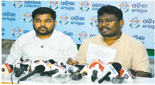
ବୋର୍ଡର ନିର୍ବାଚନ ନ ହୋଇ ବୋର୍ଡ ଗଠନ ହେଇ ନଥିବା ବେଳେ ଉପସ୍ଥିତ ଗୁଣ୍ଡପୁର ବିଧାନ ସଭାରେ ଗଠନ ହୋଇ ପ୍ରଶ୍ନ ଉଠାଇଛି ଗୁଣ୍ଡପୁର ବିଧାନ ସଭାରେ ଗଠନ ।

ସମୟରେ ଲଢ଼ାଇ ଚିଠି ବିଧାନକୁ ଅଧିଯୋଗ କରିବା କରାଯାଉଥିବା ଅଭିଯୋଗ କରିବା ସହ ବିଧାନକୁ ବୈଠକରେ ଉପସ୍ଥିତ କରିବାକୁ ନେଇ ପ୍ରଶ୍ନ ଉଠାଇଛି ଗୁଣ୍ଡପୁର ବିଧାନ ସଭାରେ ଗଠନ ।