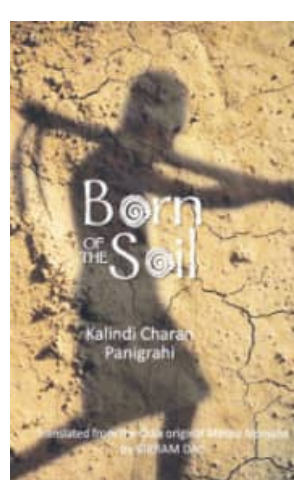
Born of the Soil

କିନ୍ତୁ ଏହି ଆଦର୍ଶବାଦୀ ଜୀବନରୁ ଘର ଭିତରେ ହିଁ ବିରୋଧର ସମ୍ମୁଖୀନ ହୁଏ । ବରକୁଙ୍କ ଛୋଟ ଭାଇ ଛକଡ଼ି, ତାଙ୍କ ସ୍ତ୍ରୀ ନେତ୍ରମଣିଙ୍କ ପ୍ରଭାବରେ,