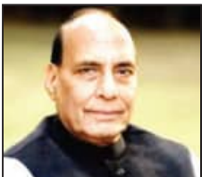
ଶ୍ରୀ ରାଜନାଥ ସିଂ ପ୍ରତିରକ୍ଷା ମନ୍ତ୍ରୀ

“ହେ ନୁତନ, ଦେଖା ଦିଏ ଆଉ-ବାର, କୋହେରୋ ପ୍ରୋଥୋମୋ ଶୁଭୋକ୍ଷୋଃ”- ହେ ନବୀନ, ପୂଣିଥରେ ସାମ୍ରାଜ୍ୟ ଆସି, ଠିକ୍ ସେହିପରି ଯେପରି ଜନ୍ମ ସମୟରେ ସେହି ପ୍ରଥମ ଶୁଭ ମୁହୂର୍ତ୍ତ ଆସିଥିଲା। ଗୁରୁଦେବ ରବୀନ୍ଦ୍ର ନାଥ ଟାଗୋରଙ୍କର ଏକ ପତ୍ରିକା କେବଳ ଏକ କବିତାର ଅଂଶବିଶେଷ ନୁହେଁ, ବରଂ ବିଭିନ୍ନ ସମୟରେ ସ୍ୱତନ୍ତ୍ରପୂର୍ବ ଭାବେ ବଦଳୁଥିବା ଏବଂ ନୂତନ ରୂପ ନେଉଥିବା ବଙ୍ଗୀୟ ଆତ୍ମାର ଆହ୍ୱାନ ମଧ୍ୟ । ଗୁରୁଦେବ ଭଲ ଭାବେ ଜାଣିଥିଲେ ଯେ ବଙ୍ଗ ସମୟ ସହିତ ପରିବର୍ତ୍ତିତ ହୁଏ ନାହିଁ, ବରଂ ଏହା ବାରମ୍ବାର ଉନ୍ନତ ଏବଂ ନୂତନ ରୂପରେ ପ୍ରସ୍ତୁତି ହୋଇଥାଏ । ଗୁରୁଦେବଙ୍କ ଜନ୍ମଦିନରେ ଗାନ କରାଯାଇଥିବା ଏହି କବିତାଟି ନବଜାଗରଣ ଏବଂ ନବଦେଶର ପ୍ରତୀକ । ଏହି ପ୍ରଥମ ପୃଷ୍ଠାକୁ ଛୁଇଁବା ଧାରଣାକୁ ଭାଙ୍ଗି ନୂତନ, ଉଜ୍ଜ୍ୱଳ ଏବଂ ସୁଜନଶୀଳ ଚିନ୍ତାଧାରା ଗ୍ରହଣ କରିବା ପାଇଁ ଏକ ଆହ୍ୱାନ ମଧ୍ୟ । ଏହା ଏକ ସୁଖଦ ସଂଯୋଗ ଯେ ଗୁରୁଦେବ ରବୀନ୍ଦ୍ରନାଥ ଟାଗୋରଙ୍କ ୧୬୫ତମ ଜନ୍ମଦିନରେ କିଛି ଦିନ ପୂର୍ବରୁ, ପଶ୍ଚିମବଙ୍ଗ ଅନେକ ଦଶନ୍ଧି ପରେ ଏକ ନବଜାଗରଣର ସାକ୍ଷୀ ହେଉଛି । ମଇ ୪ ତାରିଖରେ, ଭାରତୀୟ ଜନତା ପାର୍ଟି (ବିଜେପି) ପଶ୍ଚିମବଙ୍ଗ ବିଧାନସଭା ନିର୍ବାଚନରେ ଏକ ଐତିହାସିକ ବିଜୟ ହାସଲ କରିଛି । କିନ୍ତୁ ବିଜେପି ଏବଂ ପ୍ରଧାନମନ୍ତ୍ରୀ ନରେନ୍ଦ୍ର ମୋଦୀଙ୍କ ପାଇଁ, ଏହି ନିର୍ବାଚନ କେବେବି କେବଳ ଏକ ରାଜନୈତିକ ପ୍ରତିଯୋଗିତା ନଥିଲା । ଏହା ଏ ମହାନ ଭୂମିର ହଜିଯାଇଥିବା ଗୌରବକୁ ପୁନରୁଦ୍ଧାର କରିବାର ଏକ ସୁଯୋଗ ଥିଲା - ଏପରି ଏକ ସଭ୍ୟତାର ଅଧିକାର ଥିଲା ଯାହା ନିର୍ବାଚନ ସମାପନ ଏବଂ ଗଣନା ଠାରୁ ଉନ୍ନତ । ଆଜି, ଯେତେବେଳେ ପଶ୍ଚିମବଙ୍ଗର ଚେତନା ଏବଂ ଗୌରବର ନୂତନ ସୂର୍ଯ୍ୟୋଦୟ ହେଉଛି, ଆମକୁ ବୁଝିବାକୁ ପଡ଼ିବ ଯେ ବଙ୍ଗ କ’ଣ ଏବଂ ବଙ୍ଗ ଚେତନାର ନବଜାଗରଣ କାହାକୁ କୁହାଯାଏ । ଏଥିପାଇଁ ବଙ୍ଗର ଶହ ଶହ ବର୍ଷ ପୁରୁଣା ଚେତନାକୁ ବୁଝିବା ଏବଂ ଜାଣିବା ଆବଶ୍ୟକ । ବଙ୍ଗ ସାମାଜିକ ଚେତନାର କେନ୍ଦ୍ର ହେବା ପୂର୍ବରୁ, ଜ୍ଞାନ ଏବଂ ଆଧ୍ୟାତ୍ମିକତାର ଏକ ପବିତ୍ର ଭୂମି ଥିଲା । ପଞ୍ଚଦଶ ଶତାବ୍ଦୀରେ, ନବଦ୍ୱୀପର ରଞ୍ଜା ନଦୀ କୂଳରେ, ଜଣେ ଯୁବ ସନ୍ନ୍ୟାସୀ