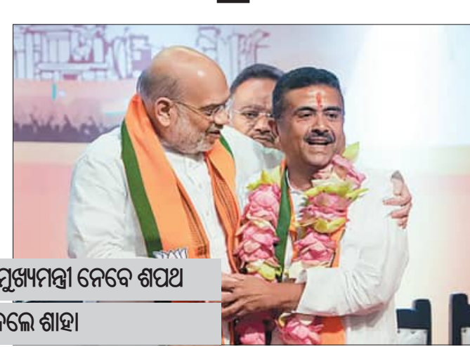
ଆଜି ଶୁଭେନ୍ଦୁଙ୍କ ସହ ଦୁଇ ଉପମୁଖ୍ୟମନ୍ତ୍ରୀ ନେବେ ଶପଥ

ନୂଆଦିଲ୍ଲୀ, ୮।୫ (ଏକେଭି) : ପଣ୍ଡିତଙ୍କର ପ୍ରଥମ ବିଜେପି ମୁଖ୍ୟମନ୍ତ୍ରୀ ଭାବେ ଶୁଭେନ୍ଦୁ ଅଧିକାରୀ ଶପଥ ନେବେ । ପଣ୍ଡିତଙ୍କ ବିଧାନସଭା ନିର୍ବାଚନ ମଣ୍ଡଳୀରେ ବିଜେପିର ବିପୁଳ ବିଜୟ ପରେ ଆଜି ବିଜେପି ବିଧାନ ସଭାରେ ବିଜେପି ଅଧିକାରୀ ଶପଥ ନେବେ ।