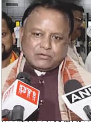
ପ୍ରଥମ ବିଜେପି ବିଧାନ ସଭା ସଭ୍ୟ ଶ୍ରୀ ମୋହନ ଚରଣ ମାତା

ଭୁବନେଶ୍ୱର, ୮।୫ (ସବୁ୍ୟ) : ପଣ୍ଡିତଙ୍କର ଆଜିକାଠିଆଳି ବହୁତ ଅନୁମୋଦନ ଓ ଶୁଭେଚ୍ଛା ଅଛି । ଆଜିର ଏହି ଦିନକୁ ସମ୍ମାନ କରିବାରେ ବିଜେପି ନେତା, କାର୍ଯ୍ୟକର୍ତ୍ତାଙ୍କୁ ଯେତେ ଧନ୍ୟବାଦ ଦେଲେ ବି କମ୍ ହେବ । ୨୦୧୧ ମସିହାରେ ମାତ୍ର ୩ ସିଟ୍‌ରୁ ଆରମ୍ଭ କରି ଆଜି ୨୦୦ ପାର ହେବା ଆମ ପାଇଁ ଏକ ଅଭିସ୍ମରଣୀୟ ଯାତ୍ରା ବୋଲି ମୁଖ୍ୟମନ୍ତ୍ରୀ ମୋହନ ଚରଣ ମାତା କହିଛନ୍ତି ।