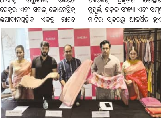
ତନେଇରା ଏବଂ ଗଠନ ମଧ୍ୟରେ ଏକ ସବୁଜନ ସୃଷ୍ଟି କରନ୍ତୁ । ପତଳା କପଡ଼ା ଆକାଶ ପରି ଝଲସିଥାଏ । ଅନ୍ୟପକ୍ଷରେ ଜଟିଳ ରୁଣା ଏବଂ ଏସ୍ମୋଡୋରା କାର୍ଯ୍ୟ ଯୋଗ୍ୟକରେ ଗଭୀରତା ଏବଂ ବିଶ୍ୱାସଯୋଡ଼ିଥାଏ ।

ଭୁବନେଶ୍ୱର, (ସବୁ୍ୟ) : ଟାଟା ପ୍ରଡକ୍ଟ ତନେଇରା ସାବିତ୍ରୀ ବ୍ରଦର ଉତ୍ପାଦ ଲାନ୍ଚିଂ ସହିତ ଗ୍ରାହକଙ୍କ ପାଇଁ ଆଣିଛି ସ୍ୱତନ୍ତ୍ର 'ଇନାୟ' ସମ୍ପର୍କ । ଏହାସହିତ ସ୍ୱତନ୍ତ୍ର ପେଷ୍ଟିକ୍ ଅପର ଉପଲକ୍ଷ । ଅପର ଅନ୍ତର୍ଗତ ଗ୍ରାହକ ଚଳିତମାସ ୫ରୁ୧୦ ଚାରିଶ ପର୍ଯ୍ୟନ୍ତ ରାଜ୍ୟରେ ଥିବା ଯେକୌଣସି ତନେଇରା ଷ୍ଟୋରରୁ ୨ଟି ପ୍ରଡକ୍ଟ କ୍ରୟ ଉପରେ ୧୫% ଏବଂ ୩ଟି ପ୍ରଡକ୍ଟ କ୍ରୟରେ ୨୦% ରିହାତି ପାଇପାରିବେ । ନିର୍ଦ୍ଦିଷ୍ଟ ଉତ୍ପାଦ ଉପରେ ଏ ଅପର ଉପଲକ୍ଷ । ସାବିତ୍ରୀ ବ୍ରଦର ସାମାଜିକ ଓ ସାଂସ୍କୃତିକ ମହତ୍ତ୍ୱ ରୁଚି ଗ୍ରାହକଙ୍କୁ ପରମ୍ପରା ସହ କଡ଼ିତ ଅର୍ଥପୂର୍ଣ୍ଣ ଅନୁଭୂତି ଦେବା ଲାଗି ଗ୍ରାହକ ପ୍ରତିବଦ୍ଧତାରେ ପ୍ରତୀକ୍ଷା ହେଉଛି ଏ ଅପର । ଇନାୟ କଲେକ୍ସନରେ