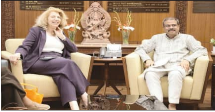
ଗେର୍ଭାର୍ଡସ୍କୁ ଭେଟି ଉଭୟ ଦେଶ ମଧ୍ୟରେ ଉଚ୍ଚଶିକ୍ଷା ଏବଂ ଗବେଷଣା କ୍ଷେତ୍ରରେ ଏବଂ ନେଦରଲାଣ୍ଡ ଆସନ୍ତା ଶିକ୍ଷା ସହଯୋଗର ନୂତନ ଦିଗ ଉପରେ ବର୍ଷରୁ ହାଇଡ୍ରୋଜେନ, ସେମିକଣ୍ଡକ୍ଟର,

ଆର୍ଟିସିପିଆଲ୍ ଇଣ୍ଟେଲିଜେନ୍ସ, ସହରା ବିକାଶ ଏବଂ କୃଷି ଭଳି ଗୁରୁତ୍ୱପୂର୍ଣ୍ଣ କ୍ଷେତ୍ର ଗୁଡ଼ିକରେ ଫାନ୍ଦିତ ଭାବେ କାର୍ଯ୍ୟ କରିବେ । ଏହି ଭାଗିଦାରି ମାଧ୍ୟମରେ ନୂତନତା, ଗବେଷଣା ଏବଂ ଜ୍ଞାନର ଆଦାନ-ପ୍ରଦାନ ପାଇଁ ନୂତନ ମାର୍ଗ ପ୍ରଣୟ ହେବ, ଯାହା ଶିକ୍ଷା କ୍ଷେତ୍ରରେ ଏକ ଉତ୍ତମ ପରିବେଶ ସୃଷ୍ଟି କରିବ । ଶ୍ରୀ ପ୍ରଧାନ କହିଛନ୍ତି ଯେ, ଏହି ମିଳିତ ପ୍ରୟାସ ଦ୍ୱାରା ଦେଶର ଶିକ୍ଷା ବ୍ୟବସ୍ଥାକୁ ଆନ୍ତର୍ଜାତୀୟ ସ୍ତରରେ ଯୋଡ଼ିବା ସହ ଏକ ଭବିଷ୍ୟତ ଗଠନ କରିବା ଦିଗରେ ଆମର ପ୍ରତିବଦ୍ଧତାକୁ ପ୍ରତିଫଳିତ କରୁଛି । ଉଚ୍ଚଶିକ୍ଷା ଏବଂ ଗବେଷଣା କ୍ଷେତ୍ରରେ ଭାରତ ଓ ନେଦରଲାଣ୍ଡ ମଧ୍ୟରେ ସହଯୋଗର ଏକ ନୂତନ ଅଧ୍ୟାୟ ଆରମ୍ଭ କରିବ ବୋଲି ଶ୍ରୀ ପ୍ରଧାନ ଆଶାବାଦୀ କହିଛନ୍ତି ।