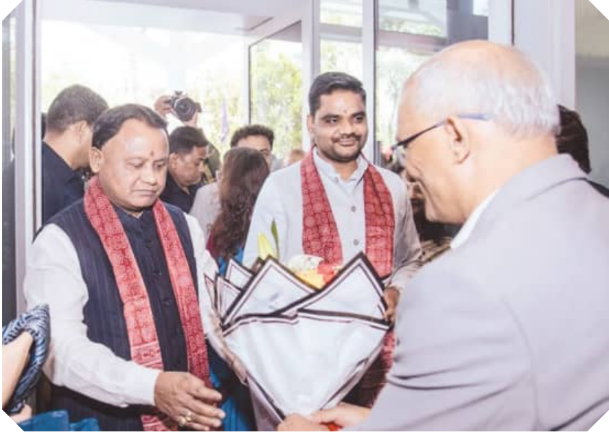
ଅହମ୍ମଦାବାଦରେ ପୁଖ୍ୟମନ୍ତ୍ରୀ ମୋହନ ଚରଣ ମାଝୀଙ୍କୁ ସ୍ୱାଗତ କରାଯାଇଛି ।