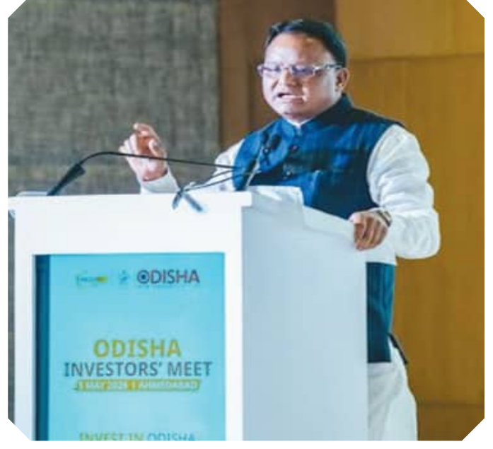
ଅହମ୍ମଦାବାଦରେ ଉଚ୍ଚପଦ ବିନୋଦ କୁମାରଙ୍କୁ ପୁଖ୍ୟମନ୍ତ୍ରୀ