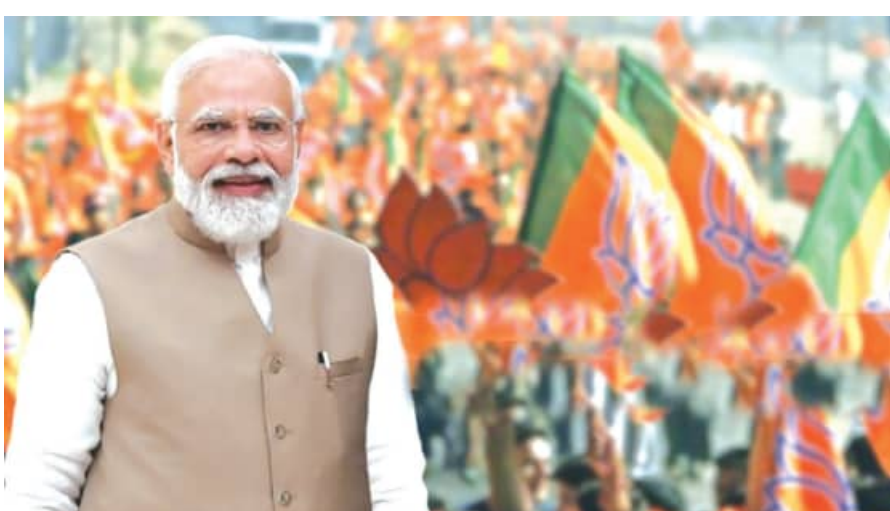
ପରେ ମଧ୍ୟ ନିର୍ବାଚନ ଫଳାଫଳ କଂଗ୍ରେସ ନେତୃତ୍ୱାଧୀନ ମେଣ୍ଟର ଭବିଷ୍ୟତକୁ ନେଇ ଅନିଶ୍ଚିତତା

ନୂଆଦିଲ୍ଲୀ: ପଶ୍ଚିମବଙ୍ଗରେ ଦୀର୍ଘ ୧୫ ବର୍ଷର ଟିଏମସି ଶାସନ ପରେ ବିଜେପି ପୁଣ୍ୟମନ୍ତ୍ରୀ ମମତା ବାନାର୍ଜୀଙ୍କ ଦୁର୍ଗମ୍ଭୀର କଂଗ୍ରେସଠାରୁ ବଞ୍ଚାଇ ନେଇଛି । ପଶ୍ଚିମବଙ୍ଗ ବିଜୟ ସହ ବିଜେପି ନେତୃତ୍ୱାଧୀନ ଏନଡିଏ ମେଣ୍ଟର ନେତୃତ୍ୱ ୨୧ଟି ରାଜ୍ୟକୁ ବୃଦ୍ଧି ପାଇଛି । ଏହାର ଅର୍ଥ ଏନଡିଏ ଦ୍ୱାରା ଶାସିତ ରାଜ୍ୟଗୁଡ଼ିକର ସଂଖ୍ୟା ୨୧କୁ ବୃଦ୍ଧି ପାଇଛି । ଅନ୍ୟପକ୍ଷ କେନ୍ଦ୍ରରେ ପ୍ରମୁଖ ବିରୋଧୀ ମେଣ୍ଟ ତଥା ଇଣ୍ଡିଆ ମେଣ୍ଟ ତାମିଲନାଡୁରେ ପରାଜି ହୋଇଥିଲେ ସୁଦ୍ଧା କେରଳରେ ଜିତିବା ପରେ ଦେଶର ଛଅଟି ରାଜ୍ୟରେ ଏହାର ନେତୃତ୍ୱ ବଜାୟ ରଖିଛି । ତେବେ କେରଳରେ ନିର୍ଦ୍ଦାୟକ ପ୍ରଦର୍ଶନ