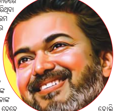
ବୋଲି ଘୋଷଣା କରିଥିଲେ । ସେ ଆର୍ଥିକ ଦୁର୍ବଳ ଶ୍ରେଣୀର ମହିଳାଙ୍କ ପାଇଁ ଏକ ଉତ୍ତମ ମାନର ଶୁକ୍ଳ ସୁନା ଦେବେ ବୋଲି ଘୋଷଣା କରାଯାଇଛି । ଏଥିସହ ମହିଳାଙ୍କ ଦ୍ୱାରା ପରିଚାଳିତ ସ୍ୱପ୍ନ ସହାୟକ ଗୋଷ୍ଠୀ ପାଇଁ ଦଳ ୫ ଲକ୍ଷ ଟଙ୍କା ପର୍ଯ୍ୟନ୍ତ ସ୍ୱପ୍ନ ମୁକ୍ତ ଋଣ ଦେବେ ଘୋଷଣା କରିଥିଲେ । ଦଳ ନିର୍ବାଚନ ଜିତିଲେ ଏବଂ ଦୁର୍ଗାପୁଜା ପର୍ବରେ ପ୍ରତିଶ୍ରୁତି ଦେଇଥିଲା । ନିର୍ବାଚନ ଲଢ଼ାୟାରରେ ଶିଖା ଉପରେ ବିଶେଷ ଗୁରୁତ୍ୱ ଦିଆଯାଇଥିଲା । ସରକାରୀ ଏବଂ ସରକାରୀ ଅନୁଦାନ ପ୍ରାପ୍ତ ସ୍କୁଲ ଗୁଡ଼ିକରେ ପାଠ ପଢ଼ୁଥିବା ପିଲାମାନଙ୍କ ମା' ଏବଂ ଅଭିଭାବକଙ୍କୁ ଦଳ ବାର୍ଷିକ ୧୫ ହଜାର ଟଙ୍କା ଦେବ ବୋଲି ପ୍ରସ୍ତାବ ଦେଇଥିଲା ।

ଚେନ୍ନାଇ : ତାମିଲନାଡୁର ରାଜନୀତିରେ ପ୍ରଥମ ଥର ପ୍ରବେଶ କରିଥିବା ତିରିକେ ଏକକ ବୁହରମ ଗଠନ ହେବା ସହ ସରକାର ବଳ କରିବାକୁ ଯାଉଛି । ପ୍ରଥମ ନିର୍ବାଚନ ଏଣ୍ଡରେ ଏବେ ବହୁ ସମ୍ଭବତା ହାସଲ କରିଥିବା ବିଜୟକେ ତିରିକେର ନିର୍ବାଚନ ପ୍ରତିଶ୍ରୁତି ଉପରେ ଏବେ ସମସ୍ତଙ୍କ ନଜର । ବିଜୟ ଚାକ୍ ନିର୍ବାଚନ ପ୍ରତିଶ୍ରୁତିରେ ମହିଳାଙ୍କ ବିବାହ ପାଇଁ ୮ ଗ୍ରାମ୍ ସୁନା ଦେବେ ମହିଳାଙ୍କ ପାଇଁ ଏକ ଉତ୍ତମ ମାନର ଶୁକ୍ଳ ସୁନା ଦେବେ ବୋଲି ଘୋଷଣା କରାଯାଇଛି । ଏଥିସହ ମହିଳାଙ୍କ ଦ୍ୱାରା ପରିଚାଳିତ ସ୍ୱପ୍ନ ସହାୟକ ଗୋଷ୍ଠୀ ପାଇଁ ଦଳ ୫ ଲକ୍ଷ ଟଙ୍କା ପର୍ଯ୍ୟନ୍ତ ସ୍ୱପ୍ନ ମୁକ୍ତ ଋଣ ଦେବେ ଘୋଷଣା କରିଥିଲେ । ଦଳ ନିର୍ବାଚନ ଜିତିଲେ ଏବଂ ଦୁର୍ଗାପୁଜା ପର୍ବରେ ପ୍ରତିଶ୍ରୁତି ଦେଇଥିଲା । ନିର୍ବାଚନ ଲଢ଼ାୟାରରେ ଶିଖା ଉପରେ ବିଶେଷ ଗୁରୁତ୍ୱ ଦିଆଯାଇଥିଲା । ସରକାରୀ ଏବଂ ସରକାରୀ ଅନୁଦାନ ପ୍ରାପ୍ତ ସ୍କୁଲ ଗୁଡ଼ିକରେ ପାଠ ପଢ଼ୁଥିବା ପିଲାମାନଙ୍କ ମା' ଏବଂ ଅଭିଭାବକଙ୍କୁ ଦଳ ବାର୍ଷିକ ୧୫ ହଜାର ଟଙ୍କା ଦେବ ବୋଲି ପ୍ରସ୍ତାବ ଦେଇଥିଲା ।