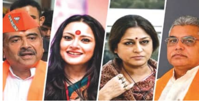
ବିଜେପିର ମୁଖ୍ୟସି, ପ୍ରଧାନମନ୍ତ୍ରୀ ୨୦ରୁ ଅଧିକ ରାଜ୍ୟରେ ସମ୍ବୋଧନ କରିଥିଲେ । ପୁଣ୍ୟମନ୍ତ୍ରୀ କରାଯିବ ବୋଲି କହିଥିଲେ । ତେଣୁ ବିଜେପି ବେଙ୍ଗଲରେ ଜିତିବାକୁ ଯାଉଥିବା ଦଳ କିଏ ପୁଣ୍ୟମନ୍ତ୍ରୀ ହେବେ, ତାକୁ ନେଇ ଚର୍ଚ୍ଚା ଆରମ୍ଭ ହୋଇଯାଇଛି ।