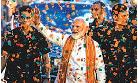
ଏକଜେଣ୍ଡାକୁ ଲୋକଙ୍କ ନିକଟରେ ପହଞ୍ଚାଇବା ପାଇଁ ସେମାନେ ହେଉଛନ୍ତି ଆମ ଦକ୍ଷ ପ୍ରଚାରକ । ପଶ୍ଚିମବଙ୍ଗ ବିଧାନସଭା ନିର୍ବାଚନ ସମ୍ବନ୍ଧରେ ମନେ ରହିବ । ଜନତାଙ୍କ ଶକ୍ତିର ବିଜୟ

ଅଗା ଏବଂ ଆକାଂକ୍ଷା ପୂରଣ କରାଯିବାକୁ ଉଦ୍ୟମ କରାଯିବ । ଆମେ ଏକ ଏକକ ସରକାର ଦେବୁ, ଯାହା ସମାଜର ସମସ୍ତ ବର୍ଗକୁ ଅବସର ଏବଂ ସମ୍ମାନ ସୁନିଶ୍ଚିତ କରିବ ।