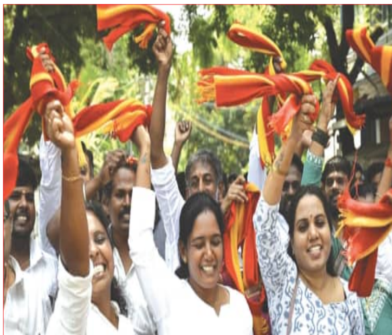
ନିର୍ବାଚନ ଫଳାଫଳ ଘୋଷଣା ପରେ ପଶ୍ଚିମବଙ୍ଗ, ଆସାମ ଓ ତାମିଲନାଡୁରେ ବିଜୟା ଦଳର ଶୋଭାଯାତ୍ରା ।