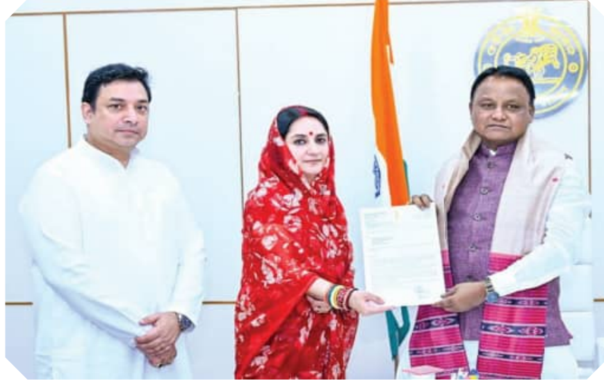
କଳାହାଣ୍ଡି ସାଂସଦ ଶ୍ରୀମତୀ ମାଳବିକା ଦେବୀ ଲୋକସେବା ଭବନରେ ମୁଖ୍ୟମନ୍ତ୍ରୀ ମୋହନ ଚରଣ ମାଝୀଙ୍କ ସହିତ ତାଙ୍କ ସଂସଦୀୟ କ୍ଷେତ୍ରର ବିକାଶ ମୂଳକ କାର୍ଯ୍ୟକ୍ରମ ସମ୍ପର୍କରେ ଆଲୋଚନା କରୁଛନ୍ତି ।