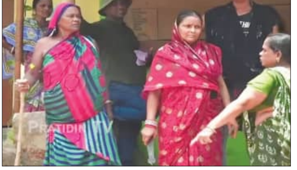
ନୋଟିସ୍ ନଦେଇ ହଟାଟ ଆସି ଆମ ଘରଦ୍ୱାରା ଭାଙ୍ଗିଛନ୍ତି । ଆମେ ୪୦ବର୍ଷରୁ ଉର୍ଦ୍ଧ୍ୱ ଏହି ସ୍ଥାନରେ ରହିଆସୁଥିବାରୁ ଏ ଉଚ୍ଛେଦକାରୀ ଦଳକୁ ରହିବୁ । ଉଚ୍ଛେଦକାରୀ ଦଳକୁ ସାମିଲ ଥିବା ଜିଏ ଜଣେ ଅଫିସରଙ୍କ