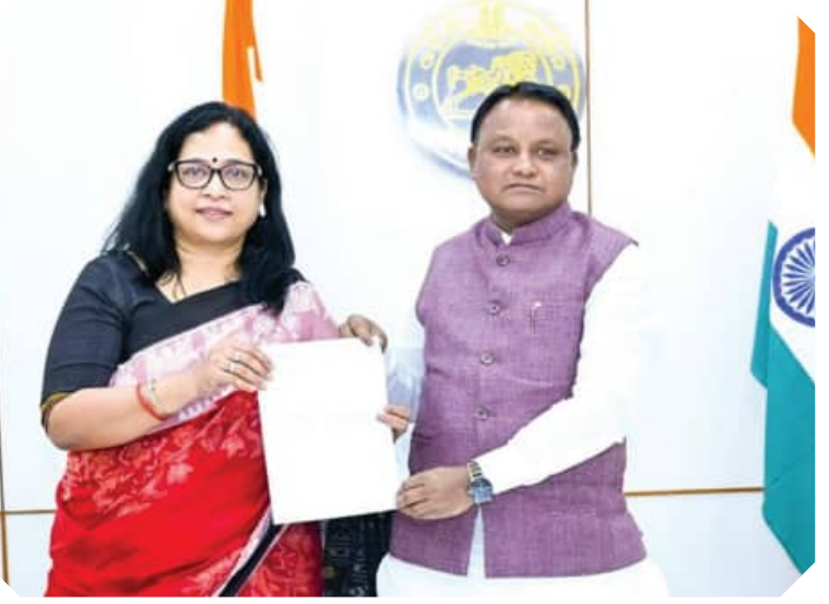
ଆସା ସାଂସଦ ଅନିତା ଶୁକ୍ଳଦର୍ଶିନୀ ଲୋକସେବା ଭବନରେ ମୁଖ୍ୟମନ୍ତ୍ରୀ ମୋହନ ଚରଣ ମାଝୀଙ୍କ ସହିତ ତାଙ୍କ ସଂସଦୀୟ କ୍ଷେତ୍ରର ବିକାଶ ସମ୍ପର୍କରେ ଆଲୋଚନା କରୁଛନ୍ତି ।