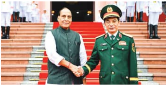
ସାମୁଦ୍ରିକ ସୁରକ୍ଷା, ସାମରିକ ତାଲିମ, ପ୍ରତିରକ୍ଷା ଶିଳ୍ପ ଏବଂ ଅଞ୍ଚଳିକ ସ୍ଥିରତା ସମେତ ଦୁଇ ଦେଶ ମଧ୍ୟରେ ଅନେକ ଗୁରୁତ୍ଵପୂର୍ଣ୍ଣ ପ୍ରସଙ୍ଗ ଉପରେ ଆଲୋଚନା ହୋଇଥିଲା । ବୈଠକ

ହନୋଇ : ଭାରତୀୟ ପ୍ରତିରକ୍ଷା ମନ୍ତ୍ରୀ ରାଜନାଥ ସିଂହ ବର୍ତ୍ତମାନ ଭିଏତନାମ ଗସ୍ତରେ ଅଛନ୍ତି । ମଙ୍ଗଳବାର ଭାରତ ଏବଂ ଭିଏତନାମ ମଧ୍ୟରେ ଦୁର୍ଘ୍ଟିମୁକ୍ତି ପ୍ରକଳ୍ପ (ଏଆଇ) ଏବଂ କାଣ୍ଟନ୍ ପ୍ରମୁକ୍ତିବିଦ୍ୟା କ୍ଷେତ୍ରରେ ଏକ ପ୍ରମୁଖ ଦୃଷ୍ଟି ସାକ୍ଷରତ ହୋଇଛି । ଏହା ଦୁଇ ଦେଶ ମଧ୍ୟରେ ସମ୍ପର୍କକୁ ମଜବୁତ କରିବ ଏବଂ ଭବିଷ୍ୟତର ପ୍ରମୁକ୍ତିବିଦ୍ୟାରେ ସହଯୋଗ ପାଇଁ ପଥ ଖୋଲିବ ବୋଲି ବିଶ୍ଵାସ କରାଯାଉଛି । ପ୍ରତିରକ୍ଷା ମନ୍ତ୍ରୀ ଏହାକୁ ଭାରତ ଏବଂ ଭିଏତନାମ ମଧ୍ୟରେ ରଣନୈତିକ ସହଭାଗୀତାରେ ଏକ ପ୍ରମୁଖ ଏବଂ ଭବିଷ୍ୟତପୂର୍ଣ୍ଣ ପଦକ୍ଷେପ ଭାବରେ ବର୍ଣ୍ଣନା କରିଛନ୍ତି । ସେ କହିଛନ୍ତି ଯେ ଦୁଇ ଦେଶ ମଧ୍ୟରେ ସମ୍ପର୍କ ନିରନ୍ତର ମଜବୁତ ହେଉଛି ଏବଂ ଭାରତ ଏହି ସହଭାଗୀତାକୁ ଆଗକୁ