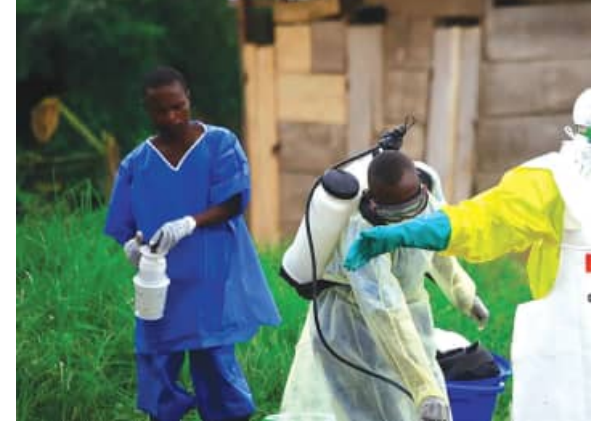
ତେବେ ଦୁତୀୟ ଥର ପାଇଁ ଏହା ଦୁର୍ଘଟଣାଗୁଣା ଭାଇରସ ବୋଲି ଚିହ୍ନଟ ହୋଇଛି । ଉତ୍ତର କିଲୁର ବିଦ୍ୟୁତ୍ଘା ରାଜଧାନୀ ଗୋମା, ଗୋମାକୁ, ବୁଟେମ୍ବୋ ଏବଂ

ନାଇଜିରୀରେ ବୁନିଆରେ ଆକ୍ରାନ୍ତ ଚିହ୍ନ ହୋଇଛନ୍ତି । ବିଶ୍ଵ ସ୍ଵାସ୍ଥ୍ୟ ସଂଗଠନର ମହାନିର୍ଦ୍ଦେଶକ ଟେଡ୍ରୋସ ଆଧାନମ୍ ଘେଡ୍ରେସ୍ ସମ୍ବଳକାର ଦିନ ଜେନେଭାରେ