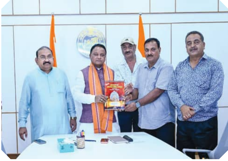
ସମ୍ବଲପୁର ବିଭିନ୍ନ ଶାତଳକ୍ଷଣା କମିଟିର ସଦସ୍ୟ ମାନେ ଲୋକସେବା ଭବନରେ ମୁଖ୍ୟମନ୍ତ୍ରୀ ମୋହନ ଚରଣ ମାଝୀଙ୍କୁ ଆଗାମୀ ଶାତଳକ୍ଷଣା ଉତ୍ସବ ପାଇଁ ନିମନ୍ତ୍ରଣ କରୁଛନ୍ତି ।