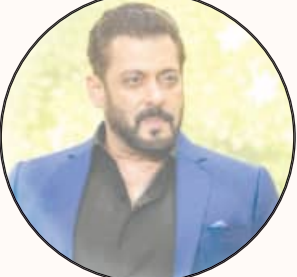
ସଲମାନ ଖାନ, ଅଭିନେତା

ପୂର୍ଣ୍ଣକ୍ରମେ ନିଜ ପାଇଁ କରି ନଥିଲୁ । ମୋ ପାଖରେ ଏକକି ଭଲପାଉଥିବା ପରିବାର ଓ ଆପଣଙ୍କ ଭଳି ଶୁଭାକାଂକ୍ଷୀମାନେ ଅଛନ୍ତି ତେଣୁ ମୁଁ କେବେ ବି ଏକ୍ସିଟିଆ ହୋଇ ପାରିବି ନାହିଁ । ବେଳେବେଳେ ମଣିଷଙ୍କ ଭିତରେ ବି ଚିତା ଲାଗିଥାଏ ।