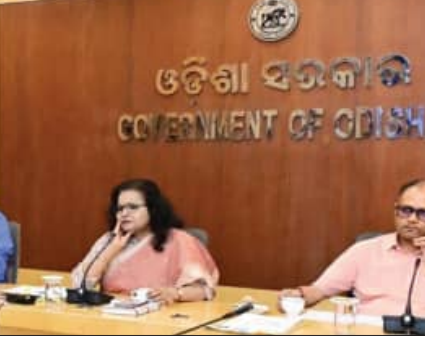
ମାସିକ ବୈଠକ କରି ବିଭାଗୀୟ କାର୍ଯ୍ୟ ସମୀକ୍ଷା ପୂର୍ବକ ସମ୍ପର୍କରେ ପ୍ରସ୍ତାବରେ ରହିଥିବା ବିଭିନ୍ନ ସମସ୍ୟାର ସମାଧାନ କରିବାକୁ ଜିଲ୍ଲାପାଳମାନଙ୍କୁ ସେ ନିର୍ଦ୍ଦେଶ ଦେଇଛନ୍ତି । ବୈଠକରେ ଯୋଜନା ଓ ସଂଯୋଗ ବିଭାଗ ତରଫରୁ ସିଏମ୍-ସମ୍ପଦା ପ୍ରଗତି ସମୀକ୍ଷା ପ୍ଲଟଫର୍ମରେ ଖଣି ପ୍ରଭାବିତ ଅଞ୍ଚଳଗୁଡ଼ିକର ସାମଗ୍ରିକ ବିକାଶ ପାଇଁ

ବୈଠକରେ ମୁଖ୍ୟ ଶାସନ ସଚିବ ଅର୍ଥ ବିଭାଗ ସଂପର୍କରେ ସମୀକ୍ଷାରେ ଚିହ୍ନିତ-ଡିପୋଜିଟ୍ ଅନୁପଦା ବୃଦ୍ଧି କରି ରାଜ୍ୟର ଆର୍ଥିକ ଅଭିବୃଦ୍ଧିକୁ ବୃଦ୍ଧି କରିବାକୁ ଗୁରୁତ୍ୱ ଦେଇଛନ୍ତି । ଏଥି ସହ ବିଭିନ୍ନ ବିଭାଗର ଜିଲ୍ଲାସ୍ତରୀୟ ଅଧିକାରୀମାନଙ୍କ ସହିତ