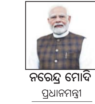
ନରେନ୍ଦ୍ର ମୋଦି ପ୍ରଧାନମନ୍ତ୍ରୀ

ସୁରୋପାୟ ସଂଘ ଏବଂ ଭାରତ ମଧ୍ୟରେ ମୁକ୍ତ ବାଣିଜ୍ୟ ରାଜିନାମା (ଏଫଟିଏ) ଉଭୟ ଦିଗରେ ବାଣିଜ୍ୟ ଓ ନିବେଶ ବଢ଼ାଇବାର ମାର୍ଗ ଖୋଲିଥାଏ । ୨୦୨୧ ସୁଦ୍ଧା ଭାରତ ଓ ଇଟାଲୀ ମଧ୍ୟରେ ବ୍ୟବସାୟିକ କାରବାରକୁ ୨୦ ବିଲିୟନ ଯୁରୋ ଠାରୁ ଆଗକୁ ବଢ଼ାଇବା ଲାଗି ଆମେ ଲକ୍ଷ୍ୟ ରଖିଛୁ । ଏଥିରେ ପ୍ରତିରକ୍ଷା ଓ ଏକୋନୋମି, ସ୍ୱଚ୍ଛ ପ୍ରଯୁକ୍ତି ବିଦ୍ୟା, ଯନ୍ତ୍ରାଣ, ସାମାଜିକ ସମାଜିକ, ରାସାୟନ, ଔଷଧ, ବୟନ, କୃଷି-ଖାଦ୍ୟକ୍ଷେତ୍ର ଏବଂ ପର୍ଯ୍ୟଟନ ସମେତ ଅନେକ କ୍ଷେତ୍ର ଉପରେ ବିଶେଷ ଧ୍ୟାନ ଦିଆଯିବ । “ମେଡ଼ ଇଟାଲୀ” ସବୁବେଳେ ସାଥୀ ଦୃଷ୍ଟିରେ ରଖିବାକୁ ପ୍ରତୀକ୍ଷାକାରୀ ଖ୍ୟାତି ଅର୍ଜନ କରିଛି । ଆଜି “ମେଡ଼ ଇଟାଲୀ” କାର୍ଯ୍ୟକ୍ରମର ଉଚ୍ଚ ଗୁଣବତ୍ତା ଆଧାରିତ ଲକ୍ଷ୍ୟ ସହ ଏହାର ସାମାଜିକ ଚାଳନା ଦେଖିବାକୁ ମିଳୁଛି । ଏହି ପରିପ୍ରେକ୍ଷାରେ, ଭାରତ ପାଇଁ ଉତ୍ପାଦନରେ ଇଟାଲୀୟ କମ୍ପାନୀଗୁଡ଼ିକର ଆଗ୍ରହ ବୃଦ୍ଧି ପାଇବା ଏବଂ ଇଟାଲୀୟ କ୍ଷେତ୍ର ଉପରେ ବିଶେଷ ଆଗ୍ରହ ପ୍ରକାଶ ମଜବୁତ ହେବ । ଏକ ସକାରାତ୍ମକ ସଂକେତ ଦେଉଛି । ବର୍ତ୍ତମାନ କ୍ରମପକ୍ଷକୁ ମିଶାଇଲେ ୧୦୦ରୁ ଅଧିକ ଉଦ୍ୟୋଗ ଉଭୟ ଦେଶରେ କାର୍ଯ୍ୟ କରୁଛନ୍ତି । ଏହା ଆମ ଯୋଗାଣ ଶୃଙ୍ଖଳର ଏକାକରଣକୁ ଆହୁରି ଅଧିକ ମଜବୁତ କରିବ ।