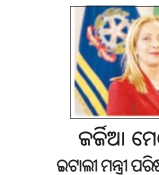
ଜର୍ଜିଆ ମେଲୋନି ଇଟାଲୀ ମନ୍ତ୍ରୀ ପରିଷଦର ଅଧକ୍ଷ

ବୈଷୟିକ ନବସୂତ୍ରନ ଆମ ଭାଗୀଦାରୀ ସବୁଠି ସ୍ୱରୂପରେ ଆଧାର । ଆମାମୀ ଦକ୍ଷିଣରେ ବିଶ୍ୱରେ ଏକ ବଡ଼ ବୈଷୟିକ ପରିବର୍ତ୍ତନ ଦେଖାଦେବ । ଏଥିରେ କୂର୍ତ୍ତମ ଦୃଷ୍ଟିମତା, ଦ୍ୱାନ୍ଦ୍ୱମକମ୍ପ୍ୟୁଟିଂ, ଅତ୍ୟାଧୁନିକ ଉତ୍ପାଦନ, ଗୁରୁତ୍ୱପୂର୍ଣ୍ଣ ଶକ୍ତି ଏବଂ ଡିଜିଟାଲ ମୋଡିଲ ଇତିହାସିକ ଭାବରେ ହୁତ ପ୍ରଗତି ହେବ । ଭାରତରେ ହୁତ ଗତିରେ ବହୁଥିବା ନବସୂତ୍ରନ ପରିବେଶ ଏବଂ ବହୁସଂଖ୍ୟକ ଲୁଣ୍ଠନା ଯୋଗାଣ ତଥା ଇଟାଲୀର ଉଚ୍ଚତମ ଶିଳ୍ପ କ୍ଷମତା ଏବଂ କ୍ଷେତ୍ରରୁ ଉଦ୍ଭବ ହେଉଥିବା ସହଯୋଗକୁ ସ୍ୱାଭାବିକ ଏବଂ ରଣନୀତିକ କରିଥାଏ । ତୁଳନାତ୍ମକ ବିଶ୍ୱବିଦ୍ୟାଳୟ ଏବଂ ଗବେଷଣା ପ୍ରତିଷ୍ଠାନ ମଧ୍ୟରେ ବର୍ଦ୍ଧିତ କାରାଦାତା ମଧ୍ୟ ଏହାକୁ ଆହୁରି ମଜବୁତ କରିବ ।