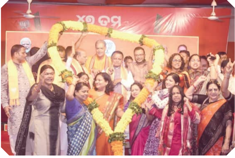
ନିର୍ବାଚନ ପାଇଁ ପ୍ରାର୍ଥନା ପରେ ଭୁବନେଶ୍ୱର ବିଜେପି ମୁଖ୍ୟାଳୟରେ ବିକସ ଉତ୍ସବ