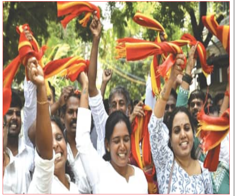
ନିର୍ବାଚନ ଫଳାଫଳ ଘୋଷଣା ପରେ ପଶ୍ଚିମବଙ୍ଗ, ଆସାମ ଓ ତାମିଲନାଡୁରେ ବିଜୟା ଦଳର ଶୋଭାଯାତ୍ରା ।