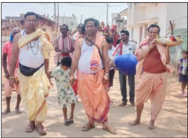
ଧରି ପ୍ରତିଷ୍ଠା ଉତ୍ସବ ଅନୁଷ୍ଠିତ ହେବାକୁ ଥିବା ବେଳେ ପୂଜା କର୍ତ୍ତା ରୁପେ କହେଇ ସଗର ସପନୀକ

ଖପ୍ରାଖୋଳ, (ସବୁ୍ୟ): ଖପ୍ରାଖୋଳ ବ୍ଲକ୍ ବୃଦ୍ଧିବାହାଳ ଗାଁର ନବ ନିର୍ମିତ ମାଉସୀ ମା ମନ୍ଦିରର ପ୍ରତିଷ୍ଠା ଉତ୍ସବ ଅବସରରେ କୁସୁଧାର କଳସ ଶୋଭାଯାତ୍ରା ଅନୁଷ୍ଠିତ ହୋଇଥିଲା । ଏହି ଅବସରରେ ପ୍ରଥମେ ଶତାଧିକ ପୁରୁଷ ମହିଳା ଏକତ୍ରିତ ହୋଇ ସକାଳିନ ଦଳ ସହିତ ଗାଁ ପୋଖରୀକୁ ଗଲା । ଆବାହନ ସହିତ କଳସ ଶୋଭାଯାତ୍ରାରେ ମାଉସୀ ମା ମନ୍ଦିର ନିକଟରେ ପହଞ୍ଚି ଥିଲେ । ପବିତ୍ର ବେଦ ମନ୍ତ୍ର ସହିତ ଅଧିବାସ କାର୍ଯ୍ୟ, ବଧୂ ନଉତି ସ୍ଥାପନ ଆଦି ଅନୁଷ୍ଠିତ ହୋଇଥିଲା । ତିନି ଦିନ