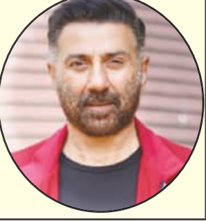
ସନ୍ଦି ଦେଓଲ, ଅଭିନେତା

ପିଲୁ ଲାଲର ଆସିବା ପୂର୍ବରୁ ମୁଁ କାଣିଥିଲି ଅଭିନେତାଙ୍କ ବିଷୟରେ କ'ଣକ'ଣ ସବୁ ଲେଖା ହୁଏ । ଏସବୁକୁ ସହିବାକୁ ହୋଇଥାଏ । ହେଲେ ବେଳେବେଳେ ଅଧିକ ମିଛ ଲେଖା ହୋଇଥାଏ ଯାହାକୁ ପଢି ରାଗ ଆସିଥାଏ ।