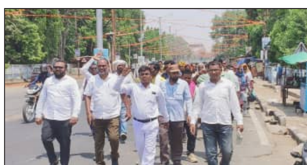
କରୁଥିବା ଅଧିକାରୀଙ୍କ ବିରୋଧରେ ତୁଟ କାର୍ଯ୍ୟାନୁଷ୍ଠାନ ତୁର୍ନାତିଗ୍ରହଣ ଅଧିକାରୀ ଓ କର୍ମଚାରୀଙ୍କୁ ଚିତ୍କୃତ କରି ସେମାନଙ୍କ ବିରୋଧରେ ଆଇନଗତ କାର୍ଯ୍ୟାନୁଷ୍ଠାନ ଚାଷୀଙ୍କ ପାଇଁ ଏକ ସ୍ତ୍ରୀୟା ଓ ନିରନ୍ତର ଜଳସେଚନ ବ୍ୟବସ୍ଥା ନିଶ୍ଚିତ କରିବା

ସ୍ଥାନରେ ସୌର ଶକ୍ତି ଚାଳିତ ପ୍ରକଳ୍ପ ଗୁଡ଼ିକ ଅଧିପତ୍ୟରେ ଅଛି । ହୋଇ ରହିଥିବାକୁ ଚାଷୀମାନେ ଚଳିତ ଚାଷ ଋତୁରେ ପାଣି ପାଇବାକୁ ବଞ୍ଚିତ ହେଉଛନ୍ତି । ଫଳରେ ସେମାନେ ବ୍ୟାପକ ଆର୍ଥିକ କ୍ଷତିର ସମ୍ମୁଖୀନ ହେଉଥିବ । ଦାବିପତ୍ରରେ ଦର୍ଶାଯାଇଛି ଚାଷୀଙ୍କ ପ୍ରମୁଖ ୬ ଦମ୍ପା ଦାବି ରହିଛି । ତନମଧ୍ୟରୁ ସମସ୍ତ ଅଚଳ ବୋର୍ଡ଼ଫେଲକୁ ରୁଗ୍ଣ ବିଦ୍ୟୁତ୍ ସଂଯୋଗ ପ୍ରଦାନ ବିଦ୍ୟୁତ୍ ସଂଯୋଗ ସମ୍ଭବ ନଥିବା ସ୍ଥାନରେ ଯଥାଶୀଘ୍ର ସୌର ପମ୍ପ ସ୍ଥାପନା ଅସମ୍ପୂର୍ଣ୍ଣ ପ୍ରକଳ୍ପ ଗୁଡ଼ିକର ରୁଗ୍ଣ ସମାପ୍ତି ଖନନ ସରିଥିବା ସମସ୍ତ ବୋର୍ଡ଼ଫେଲକୁ କାର୍ଯ୍ୟକ୍ଷମ ଅଚଳ ହୋଇ ପଡ଼ିଛି । ଅନେକ