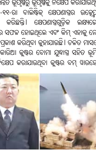
ବାଲିଷ୍ଟିକ୍ କ୍ଷେପଣାସ୍ତ୍ର ହାସଲ-୧୧ ପରୀକ୍ଷା କରିଥିଲା। ଏହା ୬:୫୫ ୬ ହେକ୍ଟର (୧୬ ରୁ ୧୭.୨ ଏକର) ଅଞ୍ଚଳକୁ ପାଇଁ କରିପାରେ ବୋଲି କିମ୍ କହିଥିଲେ। ଉଭୟ କୋରିଆ ପୂର୍ବରୁ କୃଷ୍ଣର ବୋମା ମୁକ୍ତାସ୍ତ୍ର ପରୀକ୍ଷା କରିଛି, କିନ୍ତୁ ବିଶେଷଜ୍ଞମାନେ କହୁଛନ୍ତି, ଇରାନ ଯୁଦ୍ଧ ଉଭୟ କୋରିଆକୁ କୃଷ୍ଣର ମୁକ୍ତାସ୍ତ୍ର ମାଲିକାନା ପ୍ରଦର୍ଶନ କରିବାକୁ ଏବଂ ଉନ୍ନତ କୃଷ୍ଣର ମୁକ୍ତାସ୍ତ୍ର ବିକଶିତ କରିବା ପାଇଁ ପ୍ରୟାସକୁ ବରାମ୍ବିତ କରିବାକୁ ପ୍ରେରଣା ଦେଉଛି। ଚଳିତ ଯୁଦ୍ଧରେ କୃଷ୍ଣର ମୁକ୍ତାସ୍ତ୍ର ବିନାଶକାରୀ ରୂପ ଦେଖିବାକୁ ମିଳିଛି। ଇରାନକୁ ଏପରି ଅସ୍ତ୍ର ବ୍ୟବହାର କରି ଉପାଧିକାର ବାହୁ ପ୍ରତିରକ୍ଷା ପ୍ରଶାଳୀର ମୂଳାବଳି କରିଛି।

ଦକ୍ଷିଣ କୋରିଆର ଗୁପ୍ତଚର ସଂସ୍ଥା କହିଛି କିମ୍ ଝିଅ କିମ୍ ଜୁଏ ଏବଂ ନିଜ ଉତ୍ତରାଧିକାରୀ ଭାବରେ ବିଦେଶକୁ ଯିବେ। କେସିଏନ୍ଏ ଅନୁଯାୟୀ, କିମ୍ କୃଷ୍ଣର ବମ୍ବ ମୁକ୍ତାସ୍ତ୍ର ଏବଂ ପ୍ରାନ୍ତନେତୃତ୍ୱରେ ମାନ୍ଦି, ଯୁଦ୍ଧାସ୍ତ୍ର ବହନ କରୁଥିବା