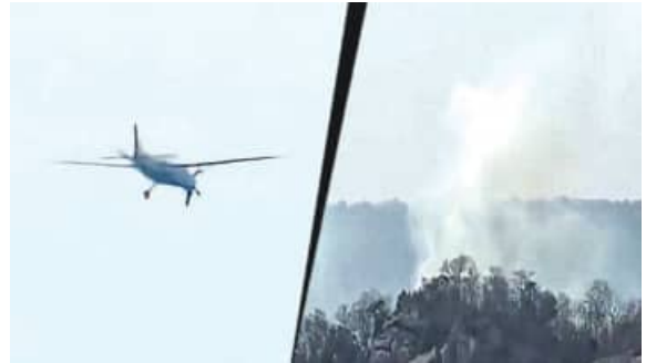
ବେଳେ ଗୋଟିଏ ଗଛରେ ପିଟି ହୋଇଯାଇଥିଲା। ଏହାପରେ ବିମାନଟି ଜଙ୍ଗଲ ମଧ୍ୟରେ ହିଁ

ନୂଆଦିଲ୍ଲୀ : ଛତିଶଗଡ଼ର ଯଶପୁର ଜିଲ୍ଲାରେ ବଡ଼ ବିମାନ ଦୁର୍ଘଟଣା। ଏଠାକାର ପାହାଡ଼ିଆ ଅଞ୍ଚଳରେ ଗୋଟିଏ ପ୍ରାଇଭେଟ୍ ବିମାନ କ୍ରାଣ ହୋଇ ଯାଇଛି। ବିମାନଟି ଜଙ୍ଗଲିଆ ଅଞ୍ଚଳରେ ଖସି ପଡ଼ିଥିବାରୁ ଏଥିରେ ଅନେକ ମୃତାହତ ହୋଇଥିବା ଆଶଙ୍କା ପ୍ରକାଶ ପାଇଛି। ଏବେ ବିମାନକୁ ଜଙ୍ଗଲ ମଧ୍ୟରେ ଠାବ କରିବା ପାଇଁ ପ୍ରୟାସ ଚାଲିଛି। ପ୍ରାଥମିକ ତଥ୍ୟ ଅନୁସାରେ, ବିମାନଟି ଜଙ୍ଗଲିଆ ଅଞ୍ଚଳ ଅତିକ୍ରମ କରୁଥିବା