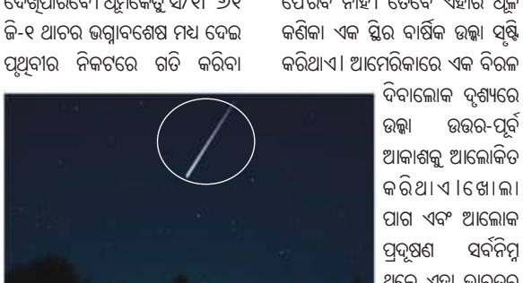
ସମୟରେ ଏକଲି ଘଟଣା ଘଟିଥାଏ। ଏହି ଧୂମକେତୁ ଯାହା ପ୍ରାୟ ପ୍ରତି ୪୧୫ ବର୍ଷରେ ପୃଥିବୀ ଚାରିପାଖରେ ପରିକ୍ରମା କରିଥାଏ। ଏହି ଧୂମକେତୁ ୨୨୮୩ ମସିହା ପର୍ଯ୍ୟନ୍ତ ଆଉ

ନୂଆଦିଲ୍ଲୀ : ବାର୍ଷିକ ଲିଭିଂ ଉଲ୍‌କାବର୍ଷା ଆରମ୍ଭ ହୋଇଛି, ଯାହା ଆକାଶ ପର୍ଯ୍ୟବେକ୍ଷକମାନଙ୍କୁ ରାତିର ଆକାଶରେ ଉଲ୍‌କା ପଡ଼ୁଥିବାର ଦେଖିବାର ସୁଯୋଗ ପ୍ରଦାନ କରିଛି। ଏପ୍ରିଲ ୧୬ ରୁ ଏପ୍ରିଲ ୨୫ ପର୍ଯ୍ୟନ୍ତ ସକ୍ରିୟ ଉଲ୍‌କାବର୍ଷା ଏପ୍ରିଲ ୨୧-୨୨ ରାତିରେ ଶୀର୍ଷରେ ପହଞ୍ଚିବ ବୋଲି ଆଶା କରାଯାଉଛି, ଯେତେବେଳେ ସର୍ବାଧିକ ଏକ୍ସଟ୍ରା ୧୦ରୁ ୧୮ ପର୍ଯ୍ୟନ୍ତ ଉଲ୍‌କା ଦୃଶ୍ୟମାନ ହେବ। ଭାରତର ପର୍ଯ୍ୟବେକ୍ଷକମାନେ ଅନୁକୂଳ ପରିସ୍ଥିତିରେ, ବିଶେଷକରି ସୁଯୋଗୀୟ ପୂର୍ଣ୍ଣଚନ୍ଦ୍ର ଭୋର୍ ଗର୍ତ୍ତା ରୁ ଟା ମଧ୍ୟରେ ସର୍ବୋତ୍ତମ ଭାବେ ଅକ୍ଷର ଆକାଶରେ ଏହି ମହାଜାଗତିକ ଦୃଶ୍ୟ