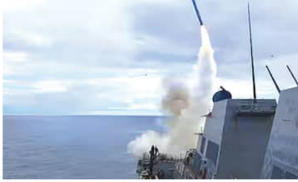
ବିବରଣୀ ପ୍ରକାଶ କରିନାହିଁ। ଓମାନ ସାଗରରେ ଆମେରିକୀୟ ସେନା ଏକ ଇରାନୀ ମାଲବାହୀ ଜାହାଜକୁ ନିୟନ୍ତ୍ରଣ କରିବା ପରେ ଏହି ପୂର୍ଣ୍ଣାଙ୍ଗ ପରିସ୍ଥିତି ସୃଷ୍ଟି ହୋଇଛି। ଆମେରିକା ରାଷ୍ଟ୍ରପତି

ତେହେରାନ : ହର୍ମୁଜ ପ୍ରଶାଳୀ ନିକଟରେ ଆମେରିକୀୟ ସେନା ଏକ ଇରାନୀ ପତାକାଯୁକ୍ତ ବାଣିଜ୍ୟିକ ଜାହାଜକୁ ଅଟକାଇ ଜବତ କରିବାର କିଛି ଘଣ୍ଟା ପରେ ସୋମବାର ଇରାନ ଦାବି କରିଛି, ଓମାନ ସାଗରରେ ଆମେରିକୀୟ ସାମରିକ ଜାହାଜ ଉପରେ ଡ୍ରୋନ୍ ଆକ୍ରମଣ କରାଯାଇଛି। ଇତିମଧ୍ୟରେ ଦୁଇସପ୍ତାହ ପାଇଁ ଲାଗୁ ହୋଇଥିବା ଅସ୍ତବିରତି ସମୟ ସାମାନ୍ୟତା ଶେଷ ହେବାକୁଥିବା ବେଳେ ଉଭୟ ପକ୍ଷ ପୁଣି ଯୁଦ୍ଧପୂର୍ଣ୍ଣ ହେବାର ଲାଗିଛନ୍ତି। ଇରାନର ଅର୍ଦ୍ଧ-ସରକାରୀ ତସନିମ ନ୍ୟୁଜ୍ ଏଜେନ୍ସି ଅନୁଯାୟୀ, ଦିନକ ପୂର୍ବରୁ ଇରାନୀ ଜାହାଜ ଉପରେ କରାଯାଇଥିବା ଆମେରିକୀୟ କାର୍ଯ୍ୟାନୁଷ୍ଠାନର ପ୍ରତିଶୋଧ ସ୍ୱରୂପ ଏହି ଡ୍ରୋନ୍ ଆକ୍ରମଣ କରାଯାଇଛି। ତେହେରାନ ଦାବି କରିଛି, ଆମେରିକୀୟ ନୌସେନା