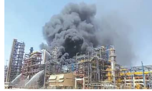
ଲିଃ(ଏଚପିସିଏଲ) ମିଳିତ ଭାବେ ପରିଚାଳନ କରୁଛନ୍ତି। ରିଫାଇନାରୀ ସଂପୂର୍ଣ୍ଣ କାର୍ଯ୍ୟକ୍ଷମ ହୋଇଥିଲେ ଭାରତର ଶକ୍ତି ସୁରକ୍ଷା ମଜବୁତ ହୋଇଥାଆନ୍ତା। ବାହ୍ୟ ରାଷ୍ଟ୍ର ଉପରେ ଭାରତ ନିର୍ଭରଶୀଳତା ହ୍ରାସ ପାଇଥାଆନ୍ତା ଓ ଘରୋଇ ଉତ୍ପାଦନର କ୍ଷମତା

ଏହି ପ୍ରତିଷ୍ଠାନକୁ ରାଜସ୍ଥାନ ସରକାର ଓ ହିନ୍ଦୁସ୍ତାନ ପେଟ୍ରୋଲିମ କର୍ପୋରେସନ ଦ୍ୱାରା ପ୍ରାୟ ୧୫୦ କୋଟି ଟଙ୍କାରେ ତିଆରି କରାଯାଇଥିଲା। ଏହା ପୂର୍ଣ୍ଣାଙ୍ଗରେ ଉଦ୍‌ଘାଟନ କରିବା ପାଇଁ ଗୋଟିଏ ଅଗୋଧୂତ ଟୈକ ରିଫାଇନାରୀର ଉଦ୍‌ଘାଟନ କରିବାର ଥିଲା। କିନ୍ତୁ ଏହାର ଦିନକ ପୂର୍ବରୁ ରିଫାଇନାରୀରେ ଘଟିଛି ଭୟଙ୍କର ଅଗ୍ନିକାଣ୍ଡ। ଏହା ଏତେ ଭୟଙ୍କର ରହିଛି ଯେ ପୂରା ଅଞ୍ଚଳ କଳା ଧୂଆଁରେ ଭରି ହୋଇ ଯାଇଛି। ପ୍ରାଥମିକ ରିପୋର୍ଟ ଅନୁସାରେ, ଅଗ୍ନିକାଣ୍ଡ ରିଫାଇନାରୀର ସିଡିଫ୍ଲୁ (କୃତ ତିଷ୍ଟିଲେସନ ଯୁନିଟ୍) ରେ ଘଟିଛି। ଏଥିରେ କେହି ମୃତାହତ ହୋଇଛନ୍ତି କି ନାହିଁ, ସେକଥା ଜଣାପଡ଼ିନାହିଁ।