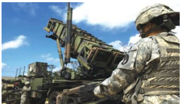
ଆମେରିକାର ସୁରକ୍ଷା ପ୍ରଶାଳୀରେ ଏକ ପ୍ରମୁଖ ଉପାଦାନ ହେଉଛି କ୍ଷେପଣାସ୍ତ୍ର ପ୍ରତିରକ୍ଷା ବ୍ୟବସ୍ଥା। ଲକ୍ଷ୍ୟ ହିଁ ମାର୍ଗଦର୍ଶନ ଚର୍ଚ୍ଚନା ଯାଇ ଅନୁଭୂତ୍ୟ ଏରିଆ ତିପେନ୍ସୁ (ଆର୍) ସିଷ୍ଟମକୁ ଶକ୍ତିଶାଳୀ ବୋଲି ବିବେଚନା କରାଯାଏ। ଏଥିରେ ପାଟ୍ରିଅଟ୍ ପିଏସି-୩ ବ୍ୟାଟେରିଆ ରହିଛି। ଆମେରିକା ଏହି ସିଷ୍ଟମ ମାଧ୍ୟମରେ ଉପସାଗରୀୟ ଦେଶଗୁଡ଼ିକୁ ସୁଦୂର ବାୟୁ ପ୍ରତିରକ୍ଷାର ପ୍ରତିଷ୍ଠିତ ଦେଇଥିଲା। ଆମେରିକା ଏହି ସିଷ୍ଟମଗୁଡ଼ିକୁ

ରିୟାଦ : ଆମେରିକା ଏବଂ ଇସ୍ରାଏଲ ଫେପ୍ରୁଆରି ୨୮ ତାରିଖରେ ଇରାନରେ ଆକ୍ରମଣ ଆରମ୍ଭ କରିଥିଲେ। ପରେ ଇରାନ ଇସ୍ରାଏଲ ଏବଂ ଉପସାଗରୀୟ ଦେଶଗୁଡ଼ିକରେ ଥିବା ଆମେରିକୀୟ ଘାଟି ଉପରେ କ୍ଷେପଣାସ୍ତ୍ର ଏବଂ ଡ୍ରୋନ୍ ମାଡ଼ କରି ପ୍ରତିଶୋଧ ନେଇଥିଲା। ଇରାନର ଏହି ପ୍ରତିଶୋଧମୂଳକ ଆକ୍ରମଣ ଆମେରିକାର ବାୟୁ ପ୍ରତିରକ୍ଷା ବ୍ୟବସ୍ଥା ଉପରେ ପ୍ରଶ୍ନ ଉଠାଇଛି। ଇରାନ କ୍ଷେପଣାସ୍ତ୍ର ଉପସାଗରୀୟ ଦେଶଗୁଡ଼ିକରେ ଲକ୍ଷ୍ୟସ୍ଥଳକୁ ବିପରୀ ଆକ୍ରମଣ କରିଛି ସେନେର ଅନେକ ବିଶେଷଜ୍ଞ ଥାଉଁ ଭଳି ଆମେରିକୀୟ ବାୟୁ ପ୍ରତିରକ୍ଷା ପ୍ରଶାଳୀ ଆଡ଼କୁ କଣା ଛଡ଼ା ବୋଲି ଅଭିହିତ କରିଛନ୍ତି। ଉପସାଗରୀୟ ଦେଶଗୁଡ଼ିକ ପ୍ରଶ୍ନ କରିଛନ୍ତି, ସେମାନେ କୋଟି କୋଟି ଡଲାର ଖର୍ଚ୍ଚ କରି ଠିକ୍ ଜିନିଷରେ କିଶିଛନ୍ତି କି ନାହିଁ। ରିପୋର୍ଟ ଅନୁଯାୟୀ,