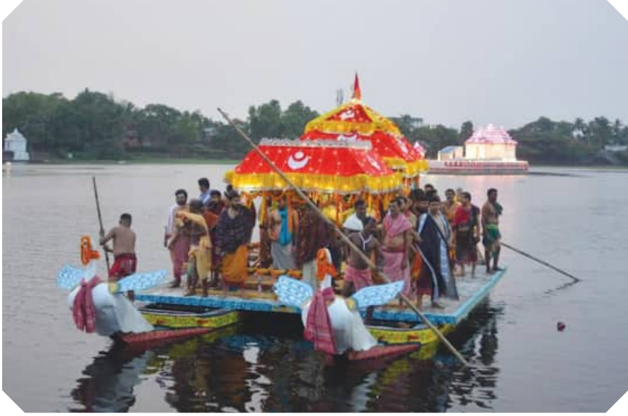
ପୁରୁଣା ଭୁବନେଶ୍ୱର ବିନ୍ଦୁ ସରୋବରରେ ପବିତ୍ର ତହନ ଯାତ୍ରା