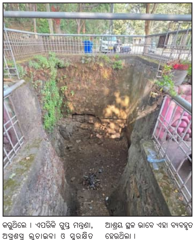
କରୁଥିଲେ । ଏପରିକି ଗୁପ୍ତ ମନୁଷ୍ୟ, ଅସ୍ତ୍ରଶସ୍ତ୍ର ଲୁଚାଇବା ଓ ସୁରକ୍ଷିତ ଆଶ୍ରୟ ସ୍ଥଳ ଭାବେ ଏହା ବ୍ୟବହୃତ ହେଉଥିଲା ।

ହୋଇଛି । ସବୁଜ ବନାନୀ ମଧ୍ୟରେ ସଂରକ୍ଷିତ ବୁଡ଼ଙ୍ଗର କଳ୍ପ ବା ପାହାଡ଼ ରହିଛି । ଏହା ସହରବାସୀଙ୍କୁ ଭରପୁର ଅନୁଭାବ ଯୋଗାଇଥାଏ । ପାହାଡ଼ ଉପରେ ଏକ ଗର୍ଭ ରହିଛି । ଏହି ଗର୍ଭକୁ ଜିଲ୍ଲା ପ୍ରଶାସନ ପକ୍ଷରୁ ଲୁହା ବାଡ଼ କରିଆରେ ଆବଦ୍ଧ କରାଯାଇଛି । ଏହା ବୀର ସୁରେନ୍ଦ୍ର ସାଏଙ୍କ ସ୍ମାରକୀ ସୁଡ଼ଙ୍ଗ ବୋଲି ଜଣାପଡ଼ିଛି । ତେବେ ସୁଡ଼ଙ୍ଗ ସମ୍ପର୍କରେ କୌଣସି ସର୍ବେକ୍ଷଣ ତଥ୍ୟ ଉଲ୍ଲେଖ କରାଯାଇନାହିଁ । ଏହାକୁ ନେଇ ଅନେକ ଲୋକଙ୍କର ଶୁଣିବାକୁ ମିଳେ । ଇଂରେଜ ମାନଙ୍କ ବିରୁଦ୍ଧରେ ସଂଗ୍ରାମ ସମୟରେ ସେ ଓ ତାଙ୍କ ସାଥୀମାନେ ଏଠାରେ ଏକ ଗୁପ୍ତ ସୁଡ଼ଙ୍ଗ ବ୍ୟବହାର କରୁଥିଲେ । ଯାହାକି ପାହାଡ଼ ଉପରକୁ ସୁରକ୍ଷିତ ଭାବେ ବାହାରିବା ଓ ଶତ୍ରୁପକ୍ଷକୁ ଚଳମା ଦେବାର ସହାୟକ ହେଉଥିଲା । ଏହାଦ୍ୱାରା ସେ ଗୋଟିଏ ସ୍ଥାନକୁ ଅନ୍ୟ ସ୍ଥାନକୁ ସହଜରେ ସ୍ଥାନାନ୍ତର