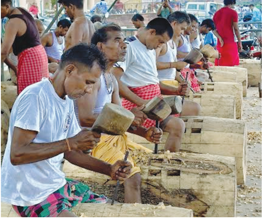
ପାଖେଲ ଆସୁଛି ମହାପ୍ରଭୁଙ୍କ ବିଶ୍ୱ ପ୍ରସିଦ୍ଧ ରଥଯାତ୍ରା ୨୦୨୬ । ରଥ ନିର୍ମାଣ କାର୍ଯ୍ୟରେ ନିମଗ୍ନ ବିଶ୍ୱକର୍ମୀ, ରଥ ନିର୍ମାଣ କାର୍ଯ୍ୟର ଷଷ୍ଠ ଦିବସ ରବିବାରରେ କରାଯାଇଛି ବିଶ୍ୱ ଅନୁକୂଳ ।