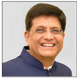
ପାଠ୍ୟ ଶୁଣା ଗୋୟାଲ

ସୋମବାର ଦିନ ସ୍ୱାକ୍ଷରୀତ ହେବାକୁ ଥିବା ଭାରତ-ନ୍ୟୁଜିଲ୍ୟାଣ୍ଡ ମୁକ୍ତ ବାଣିଜ୍ୟ ଚୁକ୍ତି (ଏଫଟିଏ), ବିକଶିତ ବିଶ୍ୱ ସହିତ ଭାରତର ସମ୍ପର୍କ କ୍ଷେତ୍ରରେ ଏକ ଐତିହାସିକ ମାଇଲସ୍ଥୁଣ ସ୍ଥାପନ କରିଛି । ଏହା ପ୍ରଧାନମନ୍ତ୍ରୀ ନରେନ୍ଦ୍ର ମୋଦିଙ୍କ ସେହି ଦୂରଦର୍ଶୀ ଚିନ୍ତାଧାରାର ଏକ ନିର୍ଣ୍ଣାୟକ ପଦକ୍ଷେପ, ଯେଉଁଥିରେ ବିଶ୍ୱସ୍ତରୀୟ ଅର୍ଥନୈତିକ ସହଭାଗିତାକୁ ଦେଶର କୃଷକ, ମହିଳା, ଯୁବପିଢ଼ି ଏବଂ ନିଯୁକ୍ତି ସୁଯୋଗ ସୃଷ୍ଟି କରୁଥିବା ଶିଳ୍ପଗୁଡ଼ିକ ପାଇଁ ପ୍ରକୃତ ଲାଭରେ ପରିଣତ କରିବାର ଲକ୍ଷ୍ୟ ରହିଛି ।