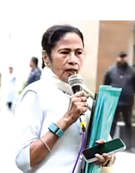
କରିବା ଏବଂ ଆଇ-ପ୍ୟାକ୍ ସହ ଜଡ଼ିତ ଫାଇଲ୍ ନେଇଯିବା ଘଟଣା ଅତ୍ୟନ୍ତ ଚିନ୍ତାଜନକ ବୋଲି କୋର୍ଟ

ନୂଆଦିଲ୍ଲୀ: ଆଇ ପ୍ୟାକ୍ ଚଢ଼ଉ ମାମଲାରେ ଆଜି ସୁପ୍ରିମକୋର୍ଟ ପଶ୍ଚିମବଙ୍ଗ ପ୍ରଶ୍ନମନ୍ତ୍ରୀ ମମତା ବାନାର୍ଜୀଙ୍କ ଉପରେ ପ୍ରବଳ ବର୍ଷିଛନ୍ତି । କୋଲକାତାରେ ଆଇ-ପ୍ୟାକ୍ ନିର୍ଦ୍ଦେଶକଙ୍କ ବାସଭବନରେ ଇଡି (ପ୍ରବର୍ତ୍ତନ ନିର୍ଦ୍ଦେଶକାୟ) ଚଢ଼ଉ କରିବା ସମୟରେ ମମତାଙ୍କ ହସ୍ତକ୍ଷେପ ପାଇଁ କୋର୍ଟ ଆଜି ତାଙ୍କୁ କଡ଼ା ସମାଲୋଚନା କରିଛନ୍ତି । ପ୍ରଶ୍ନମନ୍ତ୍ରୀ ମମତା ଚଢ଼ଉ ମଝିରେ ହଠାତ୍ ପ୍ରବେଶ