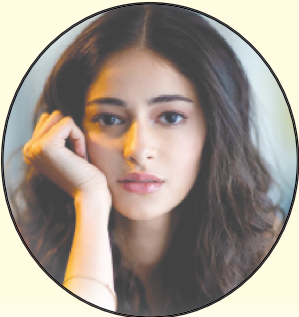
ଅନନ୍ୟା ପାଣ୍ଡେ, ଅଭିନେତ୍ରୀ

ଡ୍ରିମ୍ ଗର୍ଲ -୨ ଟିମ୍ ସହିତ କାମ କରି ବହୁତ ଖୁସି ଲାଗିଥିଲା । ଏହି ଟିମ୍ ସହିତ ମୁଁ ଇମୋସନାଲି ଜଡ଼ିତ ହୋଇଥିଲି, ତେଣୁ ସେତେବେଳେ ସୁଟିଂ ସରିବା ମୋତେ ଦୁଃଖ ଦେଇଥିଲା ।