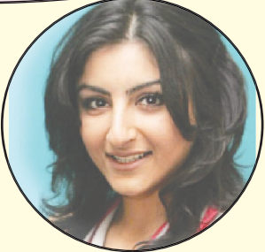
ସୋସିଆଲ କୋଡ୍, ଅଭିନେତ୍ରୀ

ମୁଁ ଆଜିକୁ କେବେ କ୍ୟାରିୟର କରିବାକୁ ଚାହିଁନି । କାରଣ ମୁଁ ଜାଣିଛି ମୋର ଟାଲେଣ୍ଟ ନାହିଁ । ମୁଁ ମଣିଷ ହିସାବରେ ବହୁତ ଲାଜକୁଳି ସ୍ତ୍ରୀବାଦ, ଯାହା ମୋତେ ଫିଲ୍ମ କରିବାକୁ ଅନୁମତି ଦେଇ ନଥିଲା ।