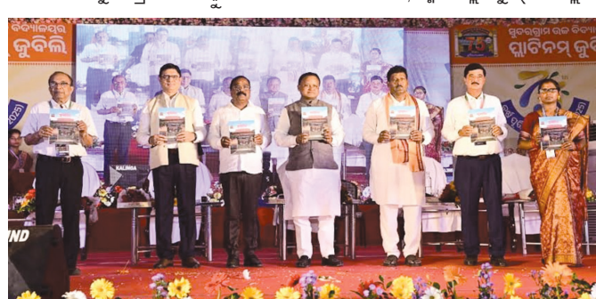
ଅନେକ ପୁରାତନ ଛାତ୍ର ଆଜି ବିଭିନ୍ନ ଉଚ୍ଚ ପଦବୀରେ ରହି ସମାଜ ସେବା କରୁଛନ୍ତି, ଯାହା ବିଦ୍ୟାଳୟ ପାଇଁ ଗର୍ବର ବିଷୟ । ବର୍ତ୍ତମାନ ସମୟନଗର ଛାତ୍ରଛାତ୍ରୀମାନେ ସେମାନଙ୍କୁ ଆଦର୍ଶ ଭାବେ ଗ୍ରହଣ କରି ନିଜ ଭବିଷ୍ୟତ ରଚିବା