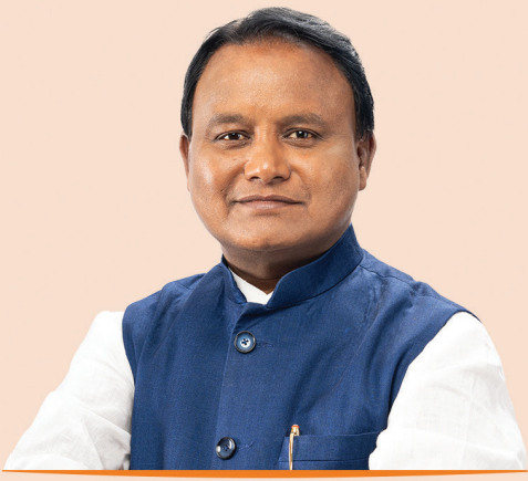
ଶ୍ରୀ ମୋହନ ଚରଣ ମାଝୀ ମୁଖ୍ୟମନ୍ତ୍ରୀ, ଓଡ଼ିଶା

ପବିତ୍ର ଅକ୍ଷୟ ତୃତୀୟା ଅବସରରେ ରାଜ୍ୟସ୍ତରୀୟ କୃଷକ ଦିବସ ଏବଂ ସିଏମ୍ ଜିଷାନ ସହାୟତା ରାଶି ହସ୍ତାନ୍ତର