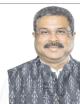
ସଂଶୋଧନ ବିଲ୍ ଉପରେ ଚର୍ଚ୍ଚା କରିବା ସମୟରେ, ଦେଶର ସବୁ ରାଜ୍ୟ ସମେତ ଓଡ଼ିଶାର ପ୍ରତିନିଧିତ୍ୱ ୫୦ ପ୍ରତିଶତ ବଢ଼ିବ ବୋଲି ମାନ୍ୟବର ଗୃହମନ୍ତ୍ରୀ ଶ୍ରୀ ଅମିତ ଶାହ ସ୍ୱର କରିଛନ୍ତି ।

। ଏହା ପକ୍ଷରେ ଓଡ଼ିଶାର ଲୋକସଭା ଆସନ ସଂଖ୍ୟା ୨୧ରୁ ବୃଦ୍ଧି ପାଇ ୩୨ ହେବ ଏବଂ ତତସହିତ ଅତିକମରେ ୧୧ ଜଣ ମହିଳା ନୂଆ ସାମ୍ବଦ ଭାବେ ଓଡ଼ିଶାକୁ ପ୍ରତିନିଧିତ୍ୱ କରିବାର ସୁଯୋଗ ପାଇବେ । ବର୍ତ୍ତମାନ ଦେଶର ଲୋକସଭା ସିଟ୍ ଆଧାରରେ ଓଡ଼ିଶାର ପ୍ରତିନିଧିତ୍ୱ ୩୮୭ ପ୍ରତିଶତ ଥିବା ବେଳେ ଏହି ଆସନ ବଢ଼ିଲେ ୩୯୯ ପ୍ରତିଶତକୁ ବୃଦ୍ଧି ପାଇବ, ଯାହା ଦ୍ୱାରା ଜାତୀୟ ସ୍ତରରେ ଓଡ଼ିଶାର ଭୂମିକା ସୁଦୃଢ଼ ହେବ । ନବୀନ ବାବୁଙ୍କ ଭଳି ବ୍ୟକ୍ତିଙ୍କ ଠାରୁ ଦେଶର ବିଲ୍ ଉପରେ ଚର୍ଚ୍ଚା କରିବା ସମୟରେ, ଦେଶର ସବୁ ରାଜ୍ୟ ସମେତ ଓଡ଼ିଶାର ପ୍ରତିନିଧିତ୍ୱ ୫୦ ପ୍ରତିଶତ ବଢ଼ିବ ବୋଲି ମାନ୍ୟବର ଗୃହମନ୍ତ୍ରୀ ଶ୍ରୀ ଅମିତ ଶାହ ସ୍ୱର କରିଛନ୍ତି ।