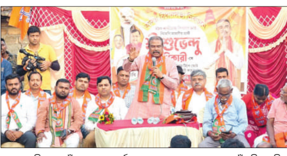
ପୁରଣ କରିବା ପାଇଁ ଏକମାତ୍ର ମାର୍ଗ । ଅପରପକ୍ଷରେ ମହିଳାମାନେ ସୁରକ୍ଷା, ସମ୍ମାନ ଏବଂ ଆର୍ଥିକ ସଶକ୍ତିକରଣ ଚାହୁଁଛନ୍ତି । ଟିଏମସି ସରକାରରେ ମହିଳାଙ୍କ ପ୍ରତି ହେଉଥିବା ଅସମ୍ମାନର

ସାକ୍ଷାତ ସମ୍ପ୍ରଦାୟ ତଥା ସମଗ୍ର ସାମ୍ପ୍ରଦାୟିକ ମୂଲ୍ୟବୋଧ ପ୍ରତି ଏକ ଆଘାତ । ବେଙ୍ଗଲବାସୀ ଏହି ଅହଂକାରର ଜବାବ ନିଶ୍ଚିତ ଭାବେ ବୋଲି ଶିକ୍ଷା ମନ୍ତ୍ରୀ କହିଛନ୍ତି । ଶ୍ରୀ ପ୍ରଧାନ ଆହୁରି କହିଛନ୍ତି ଯେ ମାନ୍ୟବର ପ୍ରଧାନମନ୍ତ୍ରୀ ନରେନ୍ଦ୍ର ମୋଦୀଙ୍କ ନେତୃତ୍ୱରେ ବିଜେପିର ଡବଲ୍ ଇଞ୍ଜିନ୍ ସରକାର ହିଁ ବିକାଶ ଏବଂ ସୁଶାସନକୁ ବୃଦ୍ଧିପ୍ରଦ କରିବେ । ପଶ୍ଚିମବଙ୍ଗ ଆଜି ଟିଏମସିର ହିଂସା, ଲୁଟ୍ ଏବଂ ଏକଛତ୍ରବାଦକୁ ସହିତ ନାହିଁ । ମୋ ୪ ଚାରିଶ କେବଳ ଏକ ନିର୍ବାଚନ ଚାରିଶ ନୁହେଁ, ବରଂ ଏହା ବଙ୍ଗଳାର ବିକାଶ, ସୁଶାସନ ଏବଂ ବିବାସର ଏକ ନୂତନ ଯାତ୍ରାର ଆରମ୍ଭ ବୋଲି ଶ୍ରୀ ପ୍ରଧାନ କହିଛନ୍ତି ।