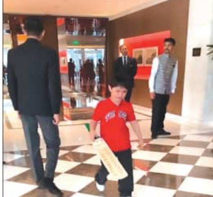
କଡ଼ା ପ୍ରୋଟୋକଲ ପାଳନ କରନ୍ତି। କୁନିଟିନିଆରୀ ସାଧାରଣତଃ ହୋଟେଲରେ ପ୍ରଶଂସକଙ୍କ ସେକ୍ଟି କିମ୍ବା ଅପେକ୍ଷା ଅନୁରୋଧକୁ ପ୍ରତ୍ୟାଖାନ କରିବାକୁ ପରାମର୍ଶ ଦିଆଯାଇଛି। ଦିଲ୍ଲୀ କ୍ୟାପିଟାଲ୍ସ ବିପକ୍ଷ ମ୍ୟାଚରେ ଆରବିବିର ବିଜୟ ସହ ବିରାଟ କୋହଲିଙ୍କ ପାଇଁ ମଧ୍ୟ ଗୁରୁତ୍ୱପୂର୍ଣ୍ଣ ଥିଲା। ଏହି ମ୍ୟାଚରେ କୋହଲି ୨୩ ରନ କରିଥିଲେ। ଏଥିସହ ସେ ଆଇପିଏଲରେ ୯ ହଜାର ରନ ପୂରଣ କରିବାରେ ପ୍ରଥମ ବ୍ୟାଟର ହୋଇଛନ୍ତି। ଦିଲ୍ଲୀ କ୍ୟାପିଟାଲ୍ସ ମାତ୍ର ୭.୫ ରନରେ ଅଲଆଉଟ୍ ହୋଇଥିଲା। ଆରବିବି ୬.୩ ଓଭରରେ ଲକ୍ଷ୍ୟ ହାସଲ କରିନେଇଥିଲା।

ପୁମ୍ପାଲ, ୨୮୪ (ଏକେନ୍ଦ୍ରି) : ଗତ ସୋମବାର ଦିଲ୍ଲୀ କ୍ୟାପିଟାଲ୍ସ ବିପକ୍ଷରେ ରୟାଲ୍ କ୍ୟାଲେଣ୍ଡର୍ସ ବେଙ୍ଗାଲୁରୁ ୯ ଓଭରରେ ବିଜୟ ହାସଲ କରିଥିଲା। ତେଣୁ ଦଳ ଏବେ ପୁଣି ଅପ ଥାନ ପାଇଁ ଦ୍ରୁତ ଦାବିଦାରୀ ପାଇଛି। ଏହି ମ୍ୟାଚରେ ଅଧିକ ରନ ହୋଇଥିଲେ ବି ବିରାଟ କୋହଲିଙ୍କ ପ୍ରଭାବଶାଳୀ ଇନିଂସ ଦେଖିବାକୁ ମିଳିଥିଲା। ବିରାଟ ଏହି ସିଜନରେ ଏପର୍ଯ୍ୟନ୍ତ ଚଳିତ ଫର୍ମରେ ଅଛନ୍ତି। ମ୍ୟାଚ ପରେ କୋହଲି ହୋଟେଲ ପହଞ୍ଚିବା ସମୟରେ ଏମିତି କିଛି କରିଛନ୍ତି ଯାହା ଜଣେ କୁନି ପ୍ରଶଂସକଙ୍କୁ ଆଘାତ ଦେଇଛି। ସ୍ଥିତି ଏମିତି ହୋଇଥିଲା ଯେ କୁନି ପିଲାଟି ବ୍ୟାଟ ଫିଲ୍ଡିଂ ଦେଇଥିଲେ। ଯାହାର ଭିତ୍ତି ସୋସିଆଲ ମିଡିଆରେ ଜୋରଦାର ଭାବରେ ହେବାରେ ଲାଗିଛି। ଏହି ଭିତ୍ତିରେ ଆରବିବି ରହିଥିବା ହୋଟେଲ ବାହାରେ ଜଣେ କୁନି ପିଲା ହାତରେ ବ୍ୟାଟ ଧରି ବିରାଟଙ୍କୁ ଅପେକ୍ଷା କରିଥିଲେ। ବାଉଁଶର ବିରାଟ କୋହଲିଙ୍କୁ ଅପେକ୍ଷା ପାଇଁ ତାଙ୍କୁସ୍ଥାନ ଦେଖାଯାଇଥିଲା। କୋହଲି ଦଳର ଅଧ୍ୟକ୍ଷ ସଦସ୍ୟ ସହିତ କଡ଼ା ସୁରକ୍ଷା ମଧ୍ୟରେ ହୋଟେଲରେ ପ୍ରବେଶ କରିଥିଲେ। ପିଲାଟି ଯେତେ ତାଙ୍କିଲେ ମଧ୍ୟ କୋହଲି ଅପେକ୍ଷା ନଦେଇ ଆଗକୁ ଚାଲିଯାଇଥିଲେ। କୋହଲି ହେଉ ପୋନ କରାଗଲେ, ହୁଏତ କୁନି ପ୍ରଶଂସକଙ୍କ ତାଙ୍କ ତାଙ୍କୁ ଶୁଣାଯାଇନଥାନ୍ତା। ତେବେ କୁନି ପ୍ରଶଂସକଙ୍କ ନିକଟରେ ବ୍ୟାଟ ଫିଲ୍ଡିଂଦେଇଥିଲେ। ସେ କାନ୍ଦୁଥିବାର ମଧ୍ୟ ଭିତ୍ତିରେ ଦେଖାଯାଇଛି। ସୁରକ୍ଷା ବୃତ୍ତିକୁ ଏତାଇବା ପାଇଁ ହୋଟେଲରେ ମଧ୍ୟ ଖେଳାଳି ଓ ସର୍ବୋଚ୍ଚ ଷ୍ଟାଟ