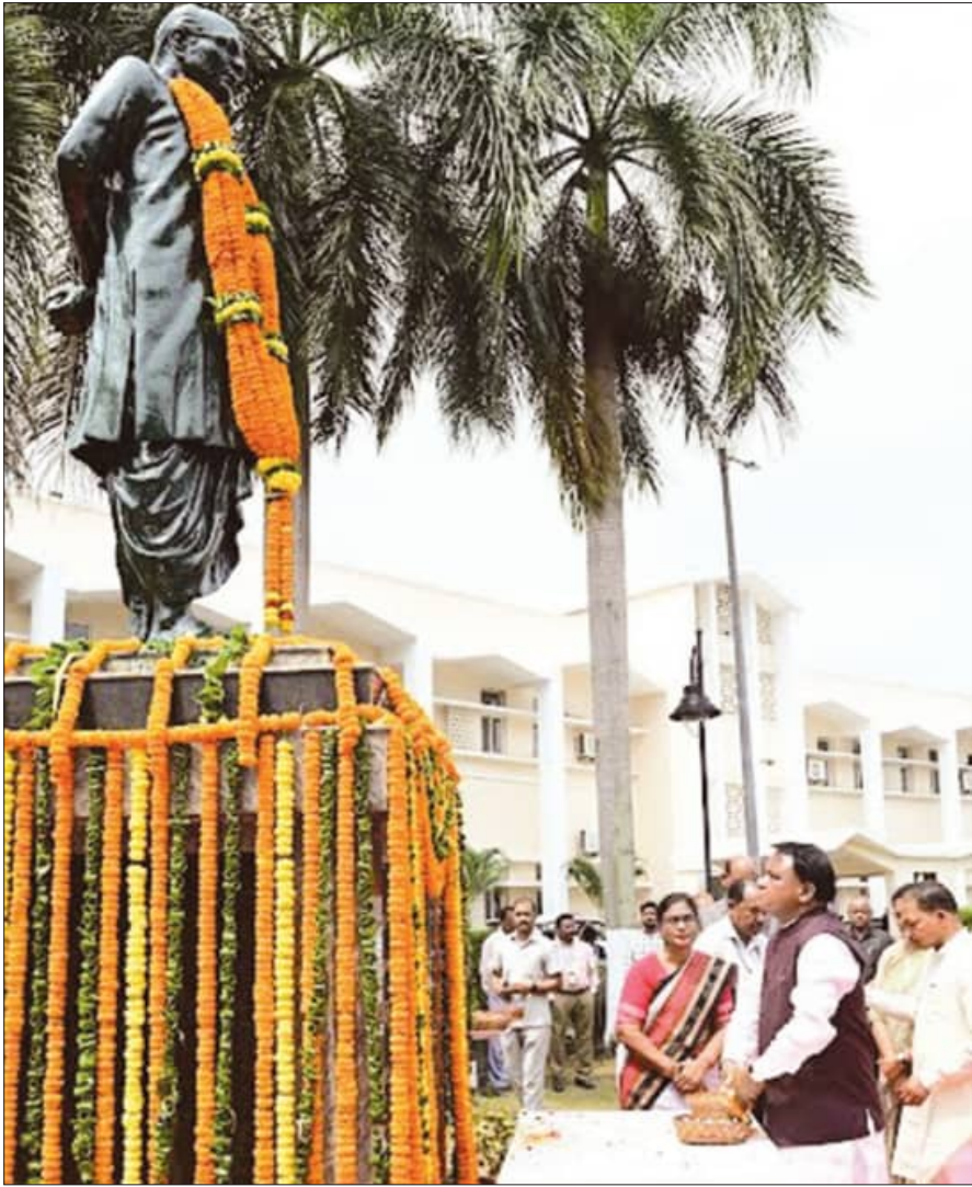
ପ୍ରବାଦ ପୁରୁଷ ବିଜୁ ପଟ୍ଟନାୟକଙ୍କ ଶ୍ରୀକ୍ଷ୍ମା ଆବରଣରେ ପୁଷ୍ୟମନ୍ତ୍ରୀ ମୋହନ ଚରଣ ମାଝୀ ଏବଂ ବିଶିଷ୍ଟ ଅତିଥିମାନେ ବିଜୁ ବାବୁଙ୍କ ପ୍ରତିମୂର୍ତ୍ତିରେ ଶ୍ରଦ୍ଧାଞ୍ଜଳି ଅର୍ପଣ କରୁଛନ୍ତି