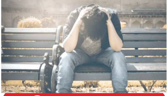
ନାଗରାଜ ମଞ୍ଚୁଲେ, ପିକ୍ଚୁମେକର ଓ ଅଭିନେତା

ପୁରା ଟିମ୍ ପାଇଁ ସମର୍ଥନ ଦେବା ପାଇଁ କାର୍ଯ୍ୟ କରିଛି । ସମସ୍ତ ସ୍ତରରୁ ସୁନ୍ଦର କାମ କରିଛନ୍ତି । ସେମାନଙ୍କ ସହିତ କାର୍ଯ୍ୟ କରି ଖୁବ୍ ଭଲ ଲାଗିଲା । ସମସ୍ତଙ୍କ ଅଭିନୟ ସହିତ ବ୍ୟବହାର ଖୁବ୍ ଭଲ ।