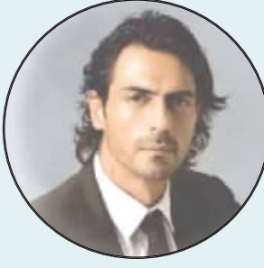
ଅର୍ଜୁନ ରାମପାଲ, ଅଭିନେତା

ମତେଲରୁ ଅଭିନେତା ହେବାର ଯାତ୍ରା ଖୁବ୍ ସଫଳପୂର୍ଣ୍ଣ ଥିଲା । ମୋତେ ସବୁବେଳେ ନେତେରିଭ ଭୂମିକା ସଫଳତା ଦେଇଛି । ଧୂଳିଶର ସିନେମା ମୋ ପାଇଁ ଲକ୍ଷ୍ୟ ଥିଲା ।