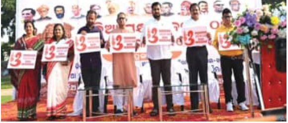
“ବନ୍ଦେ ଭଦ୍ରକ ଜନନୀ” ଗାନ କଲେ ଶ୍ରୀମତୀ ଉନ୍ମୋଚନ ଓ ଜନତା

କାନ୍ତକବିଙ୍କ ଦାୟଦଙ୍କୁ ସମ୍ବର୍ଦ୍ଧନା, ଓଡ଼ିଆ ପକ୍ଷର ଲୋଗୋ ଉନ୍ମୋଚନ । ଏହା ପର୍ଯ୍ୟଟନକୁ ଆକର୍ଷଣ କରିବ । ଏହା ପର୍ଯ୍ୟଟନକୁ ଆକର୍ଷଣ କରିବ ।