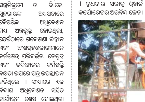
ଉଦ୍ୟାନ ପରିସରରେ ଥିବା ବିଜ୍ଞାନିକ ପ୍ରାଣକୃଷ୍ଣ ପରିଜାଙ୍କ ପ୍ରତିମୂର୍ତ୍ତିରେ ପୁଞ୍ଜମାଳ୍ୟ ଅର୍ପଣ କରିଥିଲେ । ଏହି କାର୍ଯ୍ୟକ୍ରମରେ ଅନ୍ୟମାନଙ୍କ ମଧ୍ୟରେ ପ୍ରାକ୍ତନ ପ୍ରଧାନ ଶିକ୍ଷକ