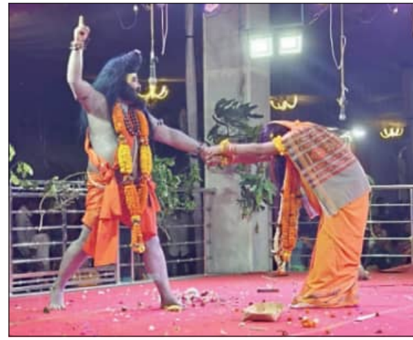
ରାବଣକୁ କହିବାପରେ ରାବଣ ପଞ୍ଚବଟିରୁ ସୀତାକୁ ହରଣ କରିବା ପାଇଁ ମାରିବ ଅପୁରୁ ପର୍ଣ୍ଣ ହରିଣ ରୂପରେ ପଞ୍ଚ ବଟିରୁ ପ୍ରାପ୍ୟ ହରିଣ ରୂପରେ ପଞ୍ଚ ପଞ୍ଚବଟିରୁ ପ୍ରାପ୍ୟ ହରିଣ କୁ ଦେଖୁ ସୀତା ଏହାକୁ ଧରିବା ପାଇଁ ଶ୍ରୀରାମ କୁ କୁହନ୍ତି। ଶ୍ରୀରାମ ଏହି

ଦଶପଲ୍ଲୀ, (ସବୁ୍ୟ) : ଦଶପଲ୍ଲୀ ର ଐତିହାସିକ ଲଙ୍କାପୋଡ଼ି ଯାତ୍ରାର ଷଷ୍ଠ ଦିବସରେ ପଞ୍ଚବଟିରୁ ସୀତାହରଣ ନାଟକ ମଞ୍ଚସ୍ଥ ହୋଇଯାଇଛି। ପୁରାଣ ଅନୁଯାୟୀ ରାମ, ଲକ୍ଷ୍ମଣ ଓ ସୀତା ଗୋଦାବରୀ ନଦୀ ତଟରେ ପଞ୍ଚବଟି ଅରଣ୍ୟରେ ବନ ବାସ ଜୀବନ ବିତାଉଥିଲେ। ସେଠାରେ ରାବଣ ଭଉଣୀ ଅପୁରି ସୁପଣଶା ସୁନ୍ଦରୀ ରୂପ ଧାରଣ କରି ରାମ, ଲକ୍ଷ୍ମଣଙ୍କୁ ବନ୍ଦୀକରି ବିବାହ କରିବାକୁ ମନ କରେ। ମାତ୍ର ଏହାକୁ ବିରୋଧ କରି ଶ୍ରୀରାମ କ ନିର୍ଦ୍ଦେଶ କ୍ରମେ ଲକ୍ଷ୍ମଣ ସୁପଣଶା ନ ନାସା ଓ କର୍ଣ୍ଣ ହେବନ କରନ୍ତି। ଏ କଥା ଜାଣି ବାପରେ ସୁପଣଶା ସମ୍ପର୍କୀୟ ଖର, ହୁଷକ, ତ୍ରିସରା ଶ୍ରୀରାମ ଓ ଲକ୍ଷ୍ମଣଙ୍କ ସହ ଯୁଦ୍ଧ କରି ପରାସ୍ତ ହୁଅନ୍ତି। ଶେଷରେ ଏହି କଥା ସୁପଣଶା ଯାଇ