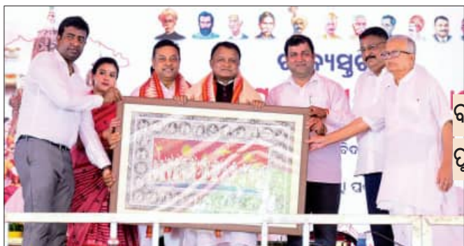
ଏହି କାର୍ଯ୍ୟକ୍ରମକୁ ବରପୁତ୍ରମାନଙ୍କ ଜନ୍ମଦିନରେ କରାଯାଇଛି ବୋଲି

ସାକ୍ଷୀଗୋପାଳ, ୦୧ ୧୪ (ସବୁ): ସ୍ୱତନ୍ତ୍ର ପ୍ରଦେଶ ଭାବେ ଓଡ଼ିଶା ପଦାର୍ପଣ କରିଛି ୯୧ ବର୍ଷରେ । ଓଡ଼ିଶା ବିବସ ରାଜ୍ୟସ୍ୱରାୟ ଉତ୍ପାଦ ଉତ୍ପାଦନ ପଣ୍ଡିତ ଗୋପବନ୍ଧୁ ଦାସଙ୍କ ଜନ୍ମଦିନ ପୂର୍ତ୍ତା ଦିନ ସତ୍ୟବାଦୀ ସ୍ଥିତ ସୁଆଣ୍ଡୋ ଗ୍ରାମରେ ଅନୁଷ୍ଠିତ ହୋଇଛି । ଗତ ବର୍ଷ ଏହା ଅନୁଷ୍ଠିତ ହୋଇଥିଲା ଉତ୍କଳ ଗୌରବ ମଧୁସୂଦନଙ୍କ ଜନ୍ମଦିନରେ । ଓଡ଼ିଶାର ଜନସାଧାରଣ ତଥା ଯୁବପିଢ଼ିଙ୍କୁ ବରପୁତ୍ର ମାନଙ୍କ ସ୍ମୃତି ସହିତ ଯୋଡ଼ି ରଖିବାକୁ ଏବଂ ସେମାନଙ୍କ ତ୍ୟାଗ ଓ ବଳିଦାନରେ ଅନୁପ୍ରାପ୍ତ ହେବା ପାଇଁ