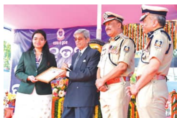
ସେ କହିଥିଲେ ଯେ, ବିଗତ ଏବଂ ଚଳିତ ବର୍ଷରେ ଓଡ଼ିଶା ପୋଲିସର କ୍ୱାଡ୍ରାବିତମାନେ ସର୍ବଭାରତୀୟ ସ୍ତରରେ ରାଜ୍ୟର ଗୌରବ

ନିୟୁକ୍ତ ପ୍ରକ୍ରିୟା ବ୍ୱରାନ୍ତିତ କରିବା ସହ ବିଭିନ୍ନ ବାଟାଲିୟନ ଓ ଯୁନିଟ୍ ଗଠନ କରୁଛନ୍ତି । ପୋଲିସ ବାହିନୀର କ୍ୱାଡ୍ରା ଶ୍ରେତ୍ରେ ସଫଳତାକୁ ଉଲ୍ଲେଖ କରି ବକ୍ତାବଳୀ ଦିଆଯାଇଛି । ଏହି ଅବସରରେ ରାଜ୍ୟପାଳ ଓ ପୁଞ୍ଜମମଣ୍ଡଳ ଶ୍ରଦ୍ଧାଞ୍ଜଳି ବାଉଁଶୁ ଅତିରିକ୍ତ ଆରକ୍ଷା ମହାନିର୍ଦ୍ଦେଶକ (ପୁଞ୍ଜମ) ପ୍ରତୀକ ସମ୍ପର୍କରେ ଗୋଟିଏ ଦିନ ଓଡ଼ିଶା ପୋଲିସର ଗଠନ ଓ ବିକାଶର ଇତିହାସକୁ ଗୁଣାଖିଳି ଅର୍ପଣ କରିବା ସହ ସେମାନଙ୍କ ପରିବାରଙ୍କୁ ସମବେଦନା ଜଣାଇଥିଲେ । ଏ ପ୍ରସ୍ତୁତ ୧୯୩୬ ମସିହାରେ ନୂତନ ଓଡ଼ିଶା ପ୍ରଦେଶ ଗଠନ ହୋଇଥିଲା । ଗତ ୯୧ ବର୍ଷର ଏହି ଯାତ୍ରା ଫାଦର୍, ସମର୍ପଣ ଓ ସଫଳତାର ଏକ ଗୌରବମୟ ଆଧାର ବୋଲି ଡିପ୍ଟି ଉଲ୍ଲେଖ କରିଥିଲେ । ଏହି ଅବସରରେ ଡିପ୍ଟି ଶ୍ରୀ ଖୁରାନିଆ ପୁଞ୍ଜମ ଅତିଥି ଭାବେ ଯୋଗଦେଇ ପ୍ୟାରେଡ଼ରେ ଅଭିବାଦନ ଗ୍ରହଣ କରିଥିଲେ । ଏହାସହ ପୋଲିସ ସେବାରେ ଉଲ୍ଲେଖନୀୟ କୃତିତ୍ୱ ପ୍ରଦର୍ଶନ କରିଥିବା ଅଧିକାରୀ ଓ କର୍ମଚାରୀଙ୍କୁ ପୁରସ୍କୃତ କରିଥିଲେ ।