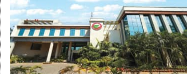
ପ୍ରତିପାଦିତ କରିପାରିଛି । ସୋଆ ପରିଚାଳିତ ଇନଷ୍ଟିଚ୍ୟୁଟ୍ ଅଫ୍ ମେଡିକାଲ୍ ସାଇନ୍ସରେ ସୋଆ ସମ୍ପଦ ସହକୃତ୍ୱାଳ୍ ଦେଶର ଅଗ୍ରଣୀ ମେଡିକାଲ୍ କଲେଜ ଭାବେ ନ୍ୟାସ୍ନାଲ୍ ଇନଷ୍ଟିଚ୍ୟୁସନାଲ୍ ର୍ୟାଙ୍କିଙ୍ଗ୍ ପ୍ରେମିୟର୍ (ଏନ୍ଏଆଇଆରଏଏ) ର୍ୟାଙ୍କିଙ୍ଗ୍ରେ ୧୫୦ତମ ସ୍ଥାନ ହାସଲ କରିଥିବା ବେଳେ ବିଶ୍ୱ ବିଦ୍ୟାଳୟ କ୍ୟାଟେଗୋରୀରେ ସୋଆ ୧୫୦ତମ ସ୍ଥାନରେ ରହିଛି ।

ଭୁବନେଶ୍ୱର, (ସବୁ୍ୟ) : ସମ୍ମାନଜନକ କ୍ୟୁଏସ୍ ଖାଲୁୟୁନିଭର୍ସିଟି ର୍ୟାଙ୍କିଙ୍ଗ୍-୨୦୨୬ (ମେଡିସିନ କ୍ୟାଟେଗୋରୀ)ରେ ଶିକ୍ଷା ଓ ଅନୁସନ୍ଧାନ (ସୋଆ) ତିମ୍ବତ ରୁ ବି ବିଶ୍ୱବିଦ୍ୟାଳୟ ମହତ୍ୱପୂର୍ଣ୍ଣ ସ୍ଥାନ ହାସଲ କରିଛି । ବିଷୟ ଭିତ୍ତିକ ମେଡିସିନ କ୍ୟାଟେଗୋରୀରେ ୭୦୧-୮୫୦ ରାଙ୍କିଙ୍ଗରେ ସ୍ଥାନୀତ ହୋଇ ସୋଆ ବିଶ୍ୱବିଦ୍ୟାଳୟ ଶ୍ରେଣିକ୍ରମ ଓ ଗବେଷଣାକୁ ଉତ୍ତମତରା ନିମନ୍ତେ ନିଜକୁ