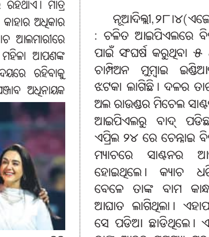
ଶ୍ରେୟସ ଆୟର ଓ କୋଟ ରିଜି ପକ୍ସିଙ୍କ ଯୋଡି ଏପର୍ଯ୍ୟନ୍ତ ଗୋଟିଏ ବି ମ୍ୟାଚ ହାରିନାହିଁ। ଗତ ସିଜନରେ ପଞ୍ଜାବ ୧୧ ବର୍ଷ ପରେ ଫାଇନାଲରେ ପ୍ରବେଶ କରିଥିଲା। କିନ୍ତୁ ଆରବିବି ନିକଟରୁ ହାରିଯାଇଥିଲା। ୨୦୨୫ ରେ ଆୟର ଓ ପକ୍ସି ପଞ୍ଜାବ ସହ ଯୋଡି ହୋଇଥିଲେ।

ନୂଆଦିଲ୍ଲୀ, ୨୮୪ (ଏକେନ୍ଦ୍ରି) : ଚଳିତ ଆଇପିଏଲରେ ପଞ୍ଜାବ କିଙ୍ଗ୍ସ ଚମତ୍କାର ପ୍ରଦର୍ଶନ କରି ଯୁ ଅଫରେ ପ୍ରବେଶ କରିବାର ନିକଟତର ହୋଇଛି। ବଲିଉଡ ଅଭିନେତ୍ରୀ ତଥା ପଞ୍ଜାବ କିଙ୍ଗ୍ସର ମାଲିକ ପ୍ରୀତି କିଶ୍ୱା ଚାକ୍ ଦଳ ପ୍ରଦର୍ଶନ ନେଇ ଖୁସି ଅଛନ୍ତି। ସ୍ୱାମିନୀରେ ସେ ଦଳକୁ ଭରପୁର ସମର୍ଥନ ଦେଇଛନ୍ତି। ଏହା ଭିତରେ ସୋସିଆଲ ମିଡିଆରେ ପ୍ରୀତିଙ୍କ ଏକ ପୋଷ୍ଟକୁ ବେଶ୍ ପସନ୍ଦ କରାଯାଇଛି। ପଞ୍ଜାବ ଏପର୍ଯ୍ୟନ୍ତ ଆଇପିଏଲରେ ଚୁପ୍ ଚିପିନାହିଁ। ଜଣେ ଯୁକ୍ତ ବ୍ୟକ୍ତିଙ୍କୁ ପ୍ରୀତି କିଶ୍ୱା ଏପର୍ଯ୍ୟନ୍ତ ଚୁପ୍ ଚିପି ପାରିନାହିଁ, କାରଣ ସେ ନିଜେ ଗୋଟିଏ ଚୁପ୍। ଏହାର ଜବାବରେ ପ୍ରୀତି କିଶ୍ୱାଙ୍କୁ ଏକ ଫୋଟୋ ପଞ୍ଜାବ ଏପର୍ଯ୍ୟନ୍ତ ଆଇପିଏଲରେ ଚୁପ୍ ଚିପିନାହିଁ। ଜଣେ ଯୁକ୍ତ ବ୍ୟକ୍ତିଙ୍କୁ ପ୍ରୀତି କିଶ୍ୱା ଏପର୍ଯ୍ୟନ୍ତ ଚୁପ୍ ଚିପି ପାରିନାହିଁ, କାରଣ ସେ ନିଜେ ଗୋଟିଏ ଚୁପ୍। ଏହାର ଜବାବରେ ପ୍ରୀତି କିଶ୍ୱାଙ୍କୁ ଏକ ଫୋଟୋ ପଞ୍ଜାବ ଏପର୍ଯ୍ୟନ୍ତ ଆଇପିଏଲରେ ଚୁପ୍ ଚିପିନାହିଁ। ଜଣେ ଯୁକ୍ତ ବ୍ୟକ୍ତିଙ୍କୁ ପ୍ରୀତି କିଶ୍ୱା ଏପର୍ଯ୍ୟନ୍ତ ଚୁପ୍ ଚିପି ପାରିନାହିଁ, କାରଣ ସେ ନିଜେ ଗୋଟିଏ ଚୁପ୍। ଏହାର ଜବାବରେ ପ୍ରୀତି କିଶ୍ୱାଙ୍କୁ ଏକ ଫୋଟୋ ପଞ୍ଜାବ ଏପର୍ଯ୍ୟନ୍ତ ଆଇପିଏଲରେ ଚୁପ୍ ଚିପିନାହିଁ।