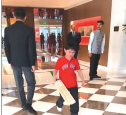
କଥା ପ୍ରୋଟୋକଲ ପାଳନ କରନ୍ତି। କ୍ରିକେଟରଙ୍କୁ ସାଧାରଣତଃ ହୋଟେଲରେ ପ୍ରଶଂସକଙ୍କ ସେକ୍ଟି କିମ୍ବା ଅପେକ୍ଷାପୂର୍ଣ୍ଣ ଅନୁରୋଧକୁ ପ୍ରତ୍ୟାଖାନ କରିବାକୁ ପରାମର୍ଶ ଦିଆଯାଇଛି।

ପୁମ୍ପାଲ, ୨୮୪ (ଏକେନ୍ଦ୍ରି) : ଗତ ସୋମବାର ଦିଲ୍ଲୀ କ୍ୟାପିଟାଲ୍ସ ବିପକ୍ଷରେ ଚଳାଇ ଚ୍ୟାଲେଞ୍ଜର୍ସ କୋର୍ଟରୁ ୯ ଓଭରରେ ବିଜୟ ହାସଲ କରିଥିଲା। ତେଣୁ ଦଳ ଏବେ ଯୁ ଅଫ ସ୍ଥାନ ପାଇଁ ଦୃଢ଼ ଦାବିଦାର ପାଇଛି। ଏହି ମ୍ୟାଚରେ ଅକ୍ଷର ହୋଇଥିଲେ ବି ବିରାଟ କୋହଲିଙ୍କ ପ୍ରଭାବଶାଳୀ ଇନିଂସ ଦେଖିବାକୁ ମିଳିଥିଲା। ବିରାଟ ଏହି ସିଜନରେ ଏପର୍ଯ୍ୟନ୍ତ ଚଳ ଫର୍ମରେ ଅଛନ୍ତି। ମ୍ୟାଚ ପରେ କୋହଲି ହୋଟେଲ ପହଞ୍ଚିବା ସମୟରେ ଏମିତି କିଛି କରିଛନ୍ତି ଯାହା ଜଣେ କୃମି ପ୍ରଶଂସକଙ୍କୁ ଆଘାତ ଦେଇଛି। ସ୍ଥିତି ଏମିତି ହୋଇଥିଲା ଯେ କୃମି ପିଲାଟି ବ୍ୟାଟ ପିଞ୍ଜି ଦେଇଥିଲେ। ଯାହାର ଭିତ୍ତି ସୋସିଆଲ ମିଡିଆରେ ଜୋରଦାର ଭାବରେ ହେବାରେ ଲାଗିଛି। ଏହି ଭିତ୍ତିରେ ଆରବିବି ରହିଥିବା ହୋଟେଲ ବାହାରେ ଜଣେ କୃମି ପିଲା ହାତରେ ବ୍ୟାଟ ଧରି ବିରାଟଙ୍କୁ ଅପେକ୍ଷା କରିଥିଲେ। ବାଉଁଶର ବିରାଟ କୋହଲିଙ୍କୁ ଅପେକ୍ଷା ପାଇଁ ତାକୁସ୍ତରୀର ଦେଖାଇଥିଲେ। କୋହଲି ଦଳର ଅଧ୍ୟକ୍ଷ ସଦସ୍ୟଙ୍କ ସହିତ କଥା ସୁରକ୍ଷା ମଧ୍ୟରେ ହୋଟେଲରେ ପ୍ରବେଶ କରିଥିଲେ। ପିଲାଟି ଯେତେ ଡାକିଲେ ମଧ୍ୟ କୋହଲି ଅପେକ୍ଷା ନଦେଇ ଆଉଟ୍ ରାଲିଯାଇଥିଲେ। କୋହଲି ହେଉ ଫୋନ କରାଉଥିଲେ, ହୁଏତ କୃମି ପ୍ରଶଂସକଙ୍କ ତାଙ୍କ ଚାକ୍ ଶୁଣାଯାଇନଥିଲା। ତେବେ କୃମି ପ୍ରଶଂସକଙ୍କର ରାଗରେ ବ୍ୟାଟ ପିଞ୍ଜିଦେଇଥିଲେ। ସେ କାନ୍ଦୁଥିବାର ମଧ୍ୟ ଭିତ୍ତିରେ ଦେଖାଯାଇଛି। ସୁରକ୍ଷା ଚୁଟିକୁ ଏତାଇବା ପାଇଁ ହୋଟେଲରେ ମଧ୍ୟ ଖେଳାଳି ଓ ସର୍ବୋଚ୍ଚ ଷ୍ଟାଫ