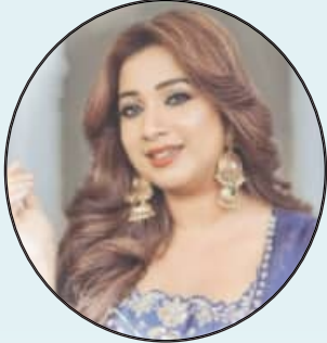
ଶ୍ରେୟା ଘୋଷାଲ, ସିଙ୍ଗର

ଭା ରତର ବାର୍ଷିକ ପ୍ରାୟ ୩.୫ ମିଲିୟନ ଟନ ପ୍ଲାଷ୍ଟିକ୍ ବର୍ଜ୍ୟବସ୍ତୁ ସୃଷ୍ଟି ହେଉଥିବା ବେଳେ ଏହାର ସଠିକ୍ ପରିଚାଳନା ଏକ ବଡ଼ ଆହ୍ୱାନ ସାଜିଛି । ଏହି ସମସ୍ୟାର ସମାଧାନ ପାଇଁ ଔରଙ୍ଗାବାଦର ବୁଲ୍ ବାନ୍ଧବା ନିମିତ୍ତ କମିଟି ଏକ କଲ୍ୟାଣୀ ଭରଣ୍ଡେ ଏକ ଅଭିନବ ପଦ୍ଧତି ଆପଣେଇଛନ୍ତି । ସେମାନେ ୧୬,୦୦୦ ପ୍ଲାଷ୍ଟିକ୍ ପାଣି ବୋତଲ, ଗୋବର, ମାଟି ଏବଂ ପ୍ରାୟ ୧୨-୧୩ ଟନ୍ ନନ ରିସାଇକେଲ ଯୋଗ୍ୟ ପ୍ଲାଷ୍ଟିକ୍ ବ୍ୟବହାର କରି ଏକ ପରିବେଶ ଅନୁକୂଳ ଘର ନିର୍ମାଣ କରିଛନ୍ତି ।