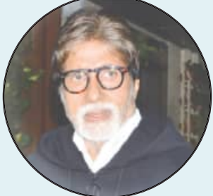
ଅମିତାଭ ବଚ୍ଚନ, ଅଭିନେତା