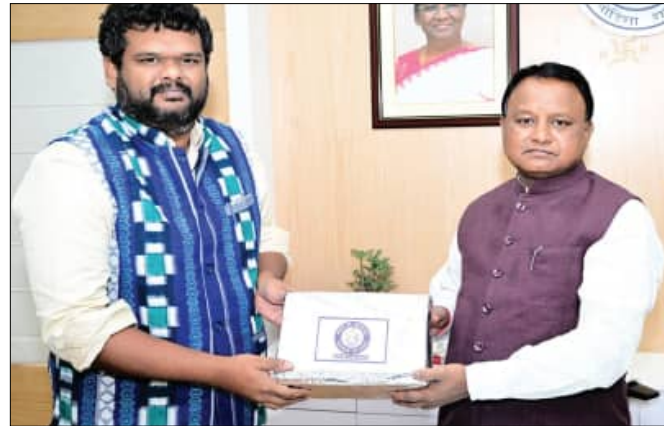
ଭୁବନେଶ୍ୱର, ୦୩।୪ (ସନ୍ଧ୍ୟା): ଭାରତ ସରକାରଙ୍କ ଗୃହ ମନ୍ତ୍ରଣାଳୟର

ଜନଗଣନା ନିର୍ଦ୍ଦେଶାଳୟ ଏବଂ ଓଡ଼ିଶା ସରକାରଙ୍କ ରାଜସ୍ୱ ଓ ବିପର୍ଯ୍ୟୟ