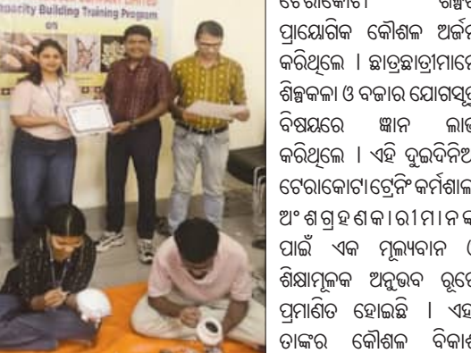
ଟେରାକୋଟା ଶିଳ୍ପ ପ୍ରାୟୋଗିକ କୌଶଳ ଅର୍ଦ୍ଧନ କରିଥିଲେ । ଛାତ୍ରଛାତ୍ରୀମାନେ ଶିଳ୍ପକଳା ଓ ବଜାର ଯୋଗସୂତ୍ର ବିଷୟରେ ଜ୍ଞାନ ଲାଭ କରିଥିଲେ । ଏହି ଦୁଇଦିନିଆ ଟେରାକୋଟା ଟ୍ରେନିଂ କର୍ମଶାଳା ଅଂଶଗ୍ରହଣକାରୀମାନଙ୍କ ପାଇଁ ଏକ ମୂଲ୍ୟବାନ ଓ ଶିକ୍ଷାମୂଳକ ଅନୁଭବ ରୂପେ ପ୍ରମାଣିତ ହୋଇଛି । ଏହା ତାଙ୍କର କୌଶଳ ବିକାଶ ସହ ସ୍ୱତନ୍ତ୍ରତାକୁ ନେଇଯାଇଛି ।