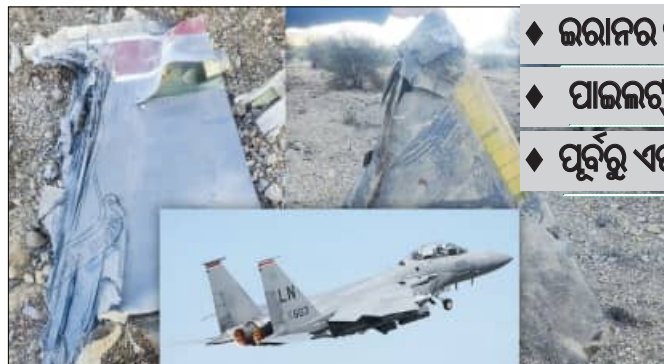
ଦାବି କରାଯାଇଛି। ଆମେରିକା ଯୁଦ୍ଧ ବିମାନ ନିଶ୍ଚଳ ମାତରେ ଧ୍ୱଂସ ହୋଇଛି। ବିମାନ ଧ୍ୱଂସ ହୋଇଥିଲେ

ନୂଆଦିଲ୍ଲୀ, ୩।୪ (ଏକେଡି): ଆମେରିକା-ଇସ୍ରାଏଲ ଇରାନ ଯୁଦ୍ଧ ଘୋଷଣା କରିଛନ୍ତି। ଆମେରିକାର ଶକ୍ତିଶାଳୀ ଯୁଦ୍ଧ ବିମାନ ଖସାଇ ଦେଇଥିବା ଦାବି କରିଛନ୍ତି। ୨୪ ଘଣ୍ଟା ମଧ୍ୟରେ ଆମେରିକା ଦୁଇଟି ବିମାନକୁ ଖସାଇ ଦେଇଛି ବୋଲି ଦାବି କରୁଛି। ତେବେ ଆମେରିକା ପକ୍ଷରୁ ଏହାକୁ ଖଣ୍ଡନ କରାଯାଇଛି। ଆମେରିକାର ଏଫ-୧୫ ଯୁଦ୍ଧ ବିମାନକୁ ଇରାନ ତାର ଦକ୍ଷିଣ ପ୍ରାନ୍ତରେ ଖସାଇ ଦେବାନେଇ ଦାବି କରିଛି। ବିମାନ ପୁରା ଧ୍ୱଂସ ହୋଇଯାଇଥିବାବେଳେ ପାଇଲଟଙ୍କୁ ନିକ୍ତ ହୋଇଥିବା ବୋଲି ଦାବି କରାଯାଇଛି।