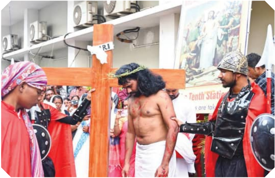
ଭୁବନେଶ୍ୱର ସତ୍ୟନଗର କ୍ୟାଥୋଲିକ୍ ଚର୍ଚ୍ଚରେ ଗୁଡ଼ ପ୍ରାଙ୍ଗଣରେ ପାଳନ