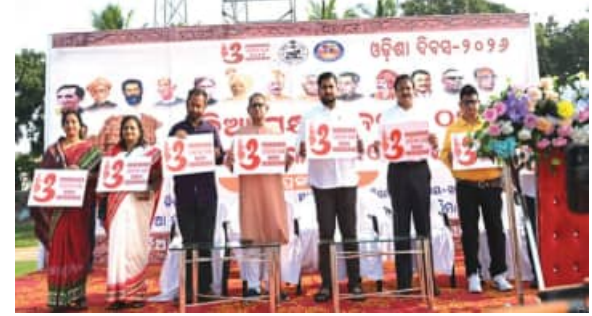
"ବନ୍ଦେ ଉତ୍କଳ ଜନନୀ" ଗାନ କଲେ ଝିଅ-ଝିଅ ଉତ୍କଳ ଛାତ୍ରଛାତ୍ରୀ ଓ ଜନତା

ଭୁବନେଶ୍ୱର, (ସବୁ୍ୟ) : ଭଦ୍ରକ ନେତୃତ୍ୱ ସ୍ୱାଧିକାରରେ ଓଡ଼ିଶା ଦିବସ ପାଳନ କରାଯାଇଛି । ଏହି ଅବସରରେ ଜିଲ୍ଲା ପ୍ରଶାସନ ପକ୍ଷରୁ ଭଦ୍ରକ ମାଟିର ବାଉଁଶ କାନ୍ତକବିଙ୍କୁ ସମ୍ବର୍ଦ୍ଧନା କରାଯାଇଛି । ଏହାକୁ ସହଜରେ ଉତ୍ସାହ ପାଇଁ ଉଦ୍ଘାଟନ କରାଯାଇଥିଲା । ଏହାକୁ ସହଜରେ ଉଦ୍ଘାଟନ କରାଯାଇଥିଲା । ଏହାକୁ ସହଜରେ ଉଦ୍ଘାଟନ କରାଯାଇଥିଲା ।