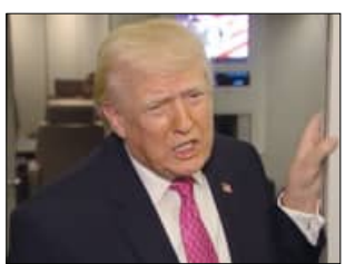
ଖାର୍ଜି ଦ୍ୱୀପକୁ ମଧ୍ୟ ଉତ୍ତାର ଦେବା

ଭୁବନେଶ୍ୱର, ୩୦/୩ (ସବୁ) : ମଧ୍ୟପ୍ରାନ୍ତରେ ଯୁଦ୍ଧର ପରିସ୍ଥିତି ଘନାଘୋଟ ହୋଇଛି। ଏହି ପରିସ୍ଥିତିରେ ଆମେରିକା ରାଷ୍ଟ୍ରପତି ଡୋନାଲ୍ଡ ଟ୍ରମ୍ପ ଇରାନକୁ ଖୋଲି ଧକ୍କା ଦେଇଛନ୍ତି। ଟ୍ରମ୍ପ କହିଛନ୍ତି ଯେ ହରମୁଜ୍ ପ୍ରଶାଳୀକୁ ମୁକ୍ତ କର ନଚେତ ଶକ୍ତି ପ୍ରକାଶ ଟେଲ କୁପ ଉତ୍ତାର ଦିଆଯିବ। ଏପରିକି ଖାର୍ଜି ଦ୍ୱୀପକୁ ମଧ୍ୟ ଉତ୍ତାର ଦେବା ଲାଗି ଟ୍ରମ୍ପ ଚେତାବନୀ ଦେଇଛନ୍ତି।