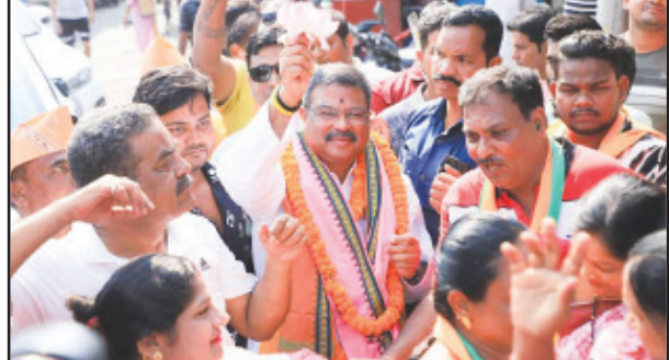
କେନ୍ଦ୍ରମନ୍ତ୍ରୀ ଧର୍ମେନ୍ଦ୍ର ବିଜେପିକୁ ନେଇ ଲୋକଙ୍କ ମଧ୍ୟରେ ବହୁତ ଶ୍ରଦ୍ଧା ଓ ଉତ୍ସାହ ଅଛି ।

ମୁରବିମାନେ ଦେଖାଇଥିଲେ ଏବଂ ଆଗାମୀ ଦିନରେ ସେ ନିର୍ବାଚନ ହେଲେ ଅଧା ରହିଥିବା କାର୍ଯ୍ୟ ଗୁଡ଼ିକ ସଂପୂର୍ଣ୍ଣ ହେଉଥିବ ବୋଲି କହିଥିଲେ । ସୁବ ନେତୃତ୍ୱ ଦଳକୁ ଭେଦ ତାଙ୍କୁ କଟକ ସହରର ପ୍ରାର୍ଥୀ କରି ଥିବାରୁ ସେ କଟକ ସହରର ମୌଳିକ ସମସ୍ୟା ପ୍ରତି ସମ୍ବନ୍ଧନ ହେବା ସହିତ ଯୁକ୍ତ ମହିଳାଙ୍କର ବିକାଶ ପାଇଁ ଗୁରୁତ୍ୱ ଦେବେ ବୋଲି ଲୋକଙ୍କୁ ପ୍ରତିଶ୍ରୁତି ଦେଇଥିଲେ ।