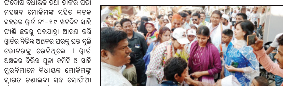
କେନ୍ଦ୍ରମନ୍ତ୍ରୀ ଧର୍ମେନ୍ଦ୍ର ବିଜେପିକୁ ନେଇ ଲୋକଙ୍କ ମଧ୍ୟରେ ବହୁତ ଶ୍ରଦ୍ଧା ଓ ଉତ୍ସାହ ଅଛି ।