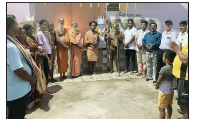
ପୁଲନଖରା, (ସବୁ୍ୟ) : ସର ଆନା ଅନ୍ତର୍ଗତ କୁଟାଳ-ଭିଙ୍ଗାରପୁର ଗ୍ରାମ୍ୟର ଗଞ୍ଜେଶ୍ଵର ଛକରେ ଏକନୂତନ ଥଣ୍ଡା ପାନୀୟ ଜଳ ପ୍ରକଳ୍ପ ସ୍ଥାପନ ହୋଇଛି । ଏହାଦ୍ଵାରା ପ୍ରକଳ୍ପ ଏବଂ

ଯାତ୍ରାଙ୍କ ସମେତ ନିକଟବାସୀମାନଙ୍କ କଲେଜ ଓ ଅବୁଝାପୁଡ଼ି କଲେଜ ଛାତ୍ରଛାତ୍ରୀମାନେ ବିଶେଷ ଭାବରେ ଉପକୃତ ହୋଇପାରିବେ । ଏହି ଉପକଳ୍ପରେ ବରିଷ୍ଠ ସମାଜସେବୀ