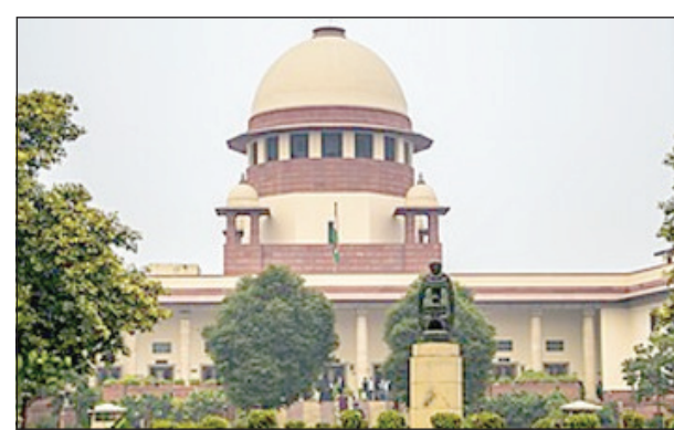
ସିଧାସଳଖ ରୂପେ କାର୍ଯ୍ୟକ୍ରମ ପ୍ରସ୍ତୁତ ହେବ । ତୁଳନାତ୍ମକ ଭାବରେ କୋର୍ଟ କହିଥିଲେ । ଏହି ମାମଲାର ପରବର୍ତ୍ତୀ ଶୁଣାଣି ଆସନ୍ତା ଜୁଲାଇ ୧୬ ତାରିଖରେ ହେବ । ଏହି ମାମଲାର ପରବର୍ତ୍ତୀ ଶୁଣାଣି ଆସନ୍ତା ଜୁଲାଇ ୧୬ ତାରିଖରେ ହେବ ।

କୋର୍ଟ କଥା କହିଥିଲେ ମଧ୍ୟ ତାଙ୍କ ଜାମିନ ଆଦେଶ ଉପରେ କିଛି କିଛି ନିଷ୍ପତ୍ତି ଶୁଣାଇ ନାହାନ୍ତି । ମେ' ୯ ତାରିଖ ପରେ ଏହି ମାମଲାର ପରବର୍ତ୍ତୀ ଶୁଣାଣି ହେବ । ଆଜି କିଛି ସମ୍ପର୍କୀତ ଖାତା ଓ କର୍ତ୍ତୃତ୍ୱ ଦାପତର ଦଖଲ କରାଯାଇଛି । ଏହି ସମ୍ପର୍କରେ ଇଡିକୁ ଅନେକ ମହତ୍ତ୍ୱପୂର୍ଣ୍ଣ ପ୍ରଶ୍ନ ପଚାରିଥିଲେ ଖଣ୍ଡପୀଠ । ବିଲୁ ଅବକାରୀ ନୀତି ମାମଲାର ତଦତ୍ତରେ କାର୍ଯ୍ୟକ୍ରମ ୨ ବର୍ଷ ସମୟ ଲାଗିଲା ବୋଲି କୋର୍ଟ ପ୍ରଶ୍ନ କରିଥିଲେ । ଏଥିପ୍ରତି ଏହି ମାମଲାର ସାକ୍ଷୀ ଓ ଅଭିଯୁକ୍ତ