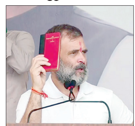
କହିଛନ୍ତି । ବିଜେପି ସରକାର ୫ଟି ଟିକସ ସ୍ତର ସହ ଲୁଚା ଜିଏସ୍ଟି ଯୋଜନା କାର୍ଯ୍ୟକାରୀ କରିଛନ୍ତି ।

ନୂଆଦିଲ୍ଲୀ: କଂଗ୍ରେସ ନେତା ରାହୁଲ ଗାନ୍ଧି ମଙ୍ଗଳବାର ଘୋଷଣା କରିଛନ୍ତି ଯେ ଯଦି 'ଇଣ୍ଡିଆ' ମେଣ୍ଟ ଯୋଜନାକୁ ଆଦେଶ ଦେବେ ତେବେ ଅଗ୍ନିବୀର ଯୋଜନାକୁ ଉଚ୍ଛେଦ କରାଯିବ । କାରଣ ଏହା ସେବା ଦ୍ୱାରା ନୁହେଁ ବରଂ ପ୍ରଧାନମନ୍ତ୍ରୀ ନରେନ୍ଦ୍ର ମୋଦୀଙ୍କ ଦ୍ୱାରା ଆରମ୍ଭ କରା ଯାଇଥିଲା । ଏଥିପ୍ରତି ବିପରୀତରେ ସଂଶୋଧନ କରିବା ସହ ଆଦିବାସୀଙ୍କ ପାଇଁ ଏକ ପୃଥକ ଧାର୍ଯ୍ୟ କୋଡ୍ ଆଣିବାକୁ ମଧ୍ୟ ସେ ପ୍ରତିଶ୍ରୁତି ଦେଇଛନ୍ତି । 'ଅଗ୍ନିବୀର ଯୋଜନାକୁ 'ଇଣ୍ଡିଆ' ମେଣ୍ଟ ରଦ୍ଦ କରିବ, ଯାହା କି ମୋଦୀ ଆଣିଥିବା ଯୋଜନା, ସେବା ଦ୍ୱାରା ନୁହେଁ । ଆମେ ସହିଦଙ୍କ ମଧ୍ୟରେ ପାର୍ଥକ୍ୟ କରିବାକୁ ଚାହୁଁନାହିଁ । ଦେଶ ପାଇଁ ବଳିଦାନ ଦେଇଥିବା ବ୍ୟକ୍ତିଙ୍କୁ ସହିଦ ମାନ୍ୟତା ଦିଆଯିବା ଉଚିତ, ତାଙ୍କୁ ପେନସନ ଦିଆଯିବା ଉଚିତ' ବୋଲି ସେ ଝଡ଼ଖଣ୍ଡର ସୁମଲୀରେ ଆୟୋଜିତ ଏକ ନିର୍ବାଚନୀ ରାଲିରେ