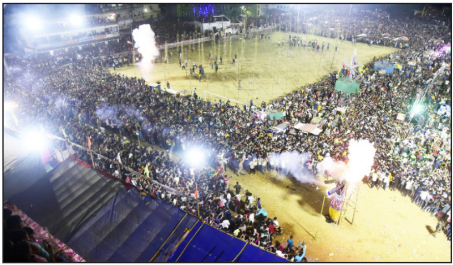
ଦଶପଲ୍ଲୀର ପ୍ରସିଦ୍ଧ ଲଙ୍କା ପୋଡ଼ି ଯାତ୍ରାର ଶେଷ ଦିନରେ ରାବଣ ପୋଡ଼ିର ଦୃଶ୍ୟ