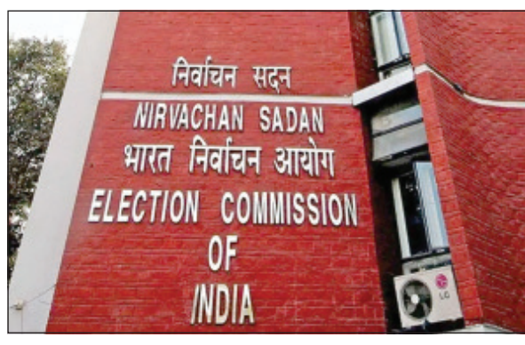
କର୍ମାଚର ନିର୍ବାଚନ ଅଧିକାରୀ ନିର୍ଦ୍ଦେଶ ଦେଇଥିଲେ । କିନ୍ତୁ ବଳ ଏହାକୁ ଖାତିର କରି ନଥିଲା । ତେଣୁ ଆଜି ଭାରତୀୟ ନିର୍ବାଚନ କମିଶନ ଏଥିରେ ହସ୍ତକ୍ଷେପ କରିଛନ୍ତି । ଏଥିପ୍ରତି ଏକ୍ସକୁ ବିଜେପିର ପୋଷ୍ଟକୁ ହଟାଇବା ପାଇଁ

ନୂଆଦିଲ୍ଲୀ : ଏହା ପୂର୍ବରୁ ବିଜେପି କାରି କରିଥିବା ଭିଡିଓକୁ ଏକ୍ସକୁ ହଟାଇବା ପାଇଁ କର୍ମାଚର ନିର୍ବାଚନ ଅଧିକାରୀ ନିର୍ଦ୍ଦେଶ ଦେଇଥିଲେ । କିନ୍ତୁ ବଳ ଏହାକୁ ଖାତିର କରି ନଥିଲା । ନିର୍ବାଚନ ସମୟରେ ଅତ୍ୟନ୍ତ ଆପତ୍ତିକର ଓ ବିଦ୍ୱେଷ ସୃଷ୍ଟିକାରୀ ପୋଷ୍ଟ କରିଥିବା କର୍ମାଚର ବିଜେପିକୁ ଶକ୍ତ ଝଟକା ଲାଗିଛି ।