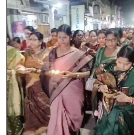
ବିଜେଡି ପ୍ରାର୍ଥୀମାନଙ୍କୁ ମାଙ୍କୁ ମଧ୍ୟ ହାତରେ ଦୀପ ନେଇ ସହର ପବ୍ଲିକ୍ସ ମାଳିକା କରିବା ଦେଖିବାକୁ ମିଳିଥିଲା ।

ବଲାଙ୍ଗିର, (ସବୁ୍ୟ): ବଲାଙ୍ଗିର ଜିଲ୍ଲା ଚିଟିଲାଗଡ଼ ନିର୍ବାଚନ ମଞ୍ଚଳର ଉତ୍ତମ କାର୍ଯ୍ୟକ୍ରମ ଗୁଡିକୁ ଆଖିଆଗରେ ରଖି ଶୁକ୍ରବାର ଚିଟିଲାଗଡ଼ ଅଞ୍ଚଳର ହତ୍ୟା ହତ୍ୟା ମହିଳା ଏକତ୍ରିତ ହୋଇ ସହରରେ ଆଧ୍ୟାତ୍ମିକ ଭେଜିକା ସହ ମା ଘଣ୍ଟାଶୁନି ମନ୍ଦିରରେ ୨୧୦୦ ଦୀପ ଦାନ କରିବା ସହ ବିଜେଡି ପ୍ରାର୍ଥୀମାନଙ୍କୁ ସାମ୍ବଳି ବିଜୟ ନେଇ ପୂଜାର୍ଚ୍ଚନା କରିଥିଲେ । ଚିଟିଲାଗଡ଼ ସହର ତଥା ଆଖି ପାଖ ଅଞ୍ଚଳର ମହିଳା ସମାଜ ଜଗନ୍ନାଥ ମନ୍ଦିରରେ ଏକତ୍ରିତ ହେବା ସହ ୨୧୦୦ ମହିଳା ହାତରେ ଦୀପ ନେଇ ପ୍ରଭୁଙ୍କୁ ଜଗନ୍ନାଥ ଆସନ ଶୋଭାଯାତ୍ରାରେ ସହର ବିଭିନ୍ନ ସ୍ଥଳ ଦେଇ ମା ଘଣ୍ଟାଶୁନି ମନ୍ଦିରରେ ପହଞ୍ଚିଥିଲେ । ଏହି ଆଧ୍ୟାତ୍ମିକ ଶୋଭାଯାତ୍ରାରେ ଭଜନ, କାର୍ତ୍ତବୀଜ ଘଣ୍ଟାବାଦ୍ୟରେ ସମଗ୍ର ସହର ଦେଖି ଆଧ୍ୟାତ୍ମିକ ବାତାବରଣରେ ମଜ୍ଜି ଯାଇଥିଲା । ସେଠାରେ ମାଙ୍କୁ ପୂଜାର୍ଚ୍ଚନା କରିବା ସହ ବିଜେଡି ପ୍ରାର୍ଥୀମାନଙ୍କୁ ସାମ୍ବଳି ହ୍ୟାଟ୍ରିକ ବିଜୟ କାମନା କରିଥିଲେ । ଚିଟିଲାଗଡ଼ ସହର ପବ୍ଲିକ୍ସ ମାଳିକା କରିବା ଦେଖିବାକୁ ମିଳିଥିଲା ।