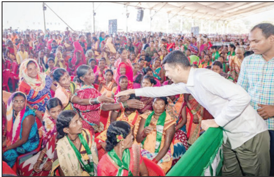
ନବରଙ୍ଗପୁର, ଡାକୁଗାଁ, ଉପରକୋଟ ଓ ଝରିଗାଁରେ କାର୍ଯ୍ୟକ୍ରମ ପାଇଁ ଆସିଥିବା ବିଭିନ୍ନ ଲାଗି କୋରଦାର ପ୍ରଚାର କରୁଛନ୍ତି ।