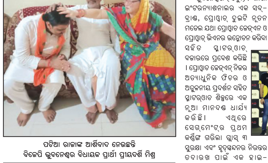
ପଠିଆ ରାଜାଙ୍କ ଆର୍ତ୍ତବ୍ୟବଚ୍ଛେଦ ବିଜେପି କୁବନେଶ୍ୱର ବିଧାନସଭା ପ୍ରାଣୀ ପ୍ରାୟଦର୍ଶି ମିଶ୍ର