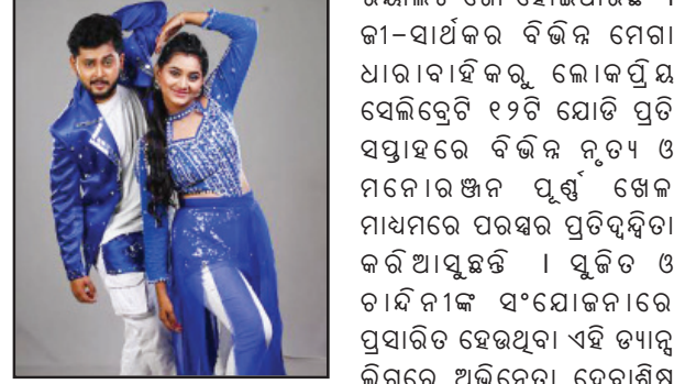
ହେବ । ଏହି ରୋମାଞ୍ଚକର ପ୍ରତିଯୋଗିତାରେ କଳାକାର ମାନଙ୍କୁ ଏବଂ ସେମାନଙ୍କର ପ୍ରଦର୍ଶନକୁ ଦର୍ଶକ ଯେଉଁ ଭାବପାଇବା ଦେଇଛନ୍ତି, ଆଜି ତ୍ୟାନ୍ସ ଓଡ଼ିଶା ତ୍ୟାନ୍ସ ୧୨ ନୟର