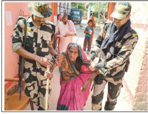
ରାହୁଲ, ହେମାନାଲିନୀ, ଓମ୍ ବିର୍ଲା, ରାଜୀବଙ୍କ ଭାଗ୍ୟ ନିର୍ଦ୍ଧାରଣ ହେବ

ନୂଆଦିଲ୍ଲୀ, ୨୬/୪ : ଲୋକସଭା ନିର୍ବାଚନ ଲାଗି ଦ୍ୱିତୀୟ ପର୍ଯ୍ୟାୟ ଭୋଟ୍ ଗ୍ରହଣ ଆଜି ଶେଷ ହୋଇଛି । ସନ୍ଧ୍ୟା ୫ଟା ସୁଦ୍ଧା ୧୩ ଲାକ୍ଷର ୮୮ ଲୋକସଭା ନିର୍ବାଚନପତ୍ରିକା ଲାଗି ୬୦.୬% ଭୋଟ୍ ହୋଇଥିବା ସୂଚନା ମିଳିଛି । କେରଳର ୨୦ ଲୋକସଭା ଆସନର ଭୋଟ୍ ସରିଛି । ସମସ୍ତଙ୍କ ଆଖି ଏବେ କେରଳ ଉପରେ ରହିଛି । କାରଣ କେରଳର ଡେମୋକ୍ରେଟିକ୍ କଂଗ୍ରେସର ପ୍ରମୁଖ ନେତା ରାହୁଲ ଗାନ୍ଧି ନିର୍ବାଚନ ଲଢୁଛନ୍ତି । ତେବେ ପଶ୍ଚିମବଙ୍ଗରେ ସର୍ବାଧିକ ୨୯% ଭୋଟ୍ ଆସିଛି । ମାଣିପୁର, ଛତିଶଗଡ, ପଶ୍ଚିମବଙ୍ଗ, ଆସାମ ଓ ତ୍ରିପୁରାରେ ୨୦%ରୁ ଅଧିକ ଭୋଟ୍ ହୋଇଥିବା ଜଣାପଡିଛି । ସେହିଭଳି ଉତ୍ତରପ୍ରଦେଶ, (୯ ପୁଷ୍ପାରେ)