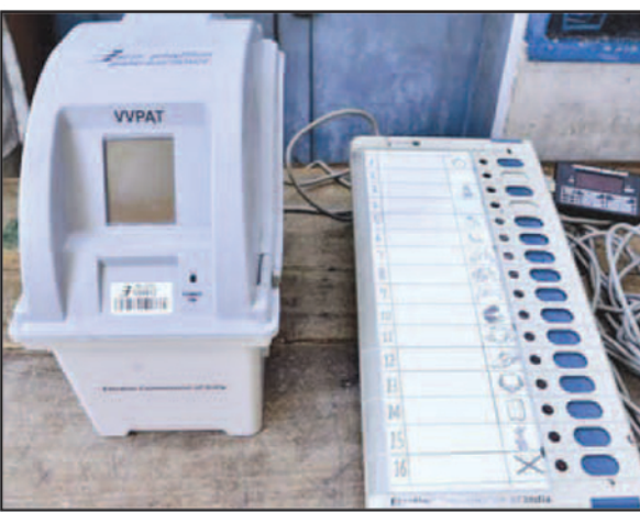
କହିଥିଲେ ଯେ ଭୋଟରଙ୍କ ଗୋପନୀୟତା ଭୋଟରଙ୍କ ଅଧିକାରକୁ ପରାସ୍ତ କରିବ ବ୍ୟବହାର କରାଯାଇପାରେ ନାହିଁ । ଆତ୍ମଭୋକେର୍ ପ୍ରଶ୍ନାତ ଲୁପ୍ତ ହେଉଥିଲେ ଯେ ଭିଜିପାର୍ ମେସିନ୍ରେ

ସୁପ୍ରିମକୋର୍ଟ ଆଜି ଭିଜିପାର୍ ମେସିନ୍ ସହ ଭିଜିପାର୍ରେ ପ୍ରଥମ ସ୍ଥିତ ମେନାକର ପାଇଁ ହୋଇଥିବା ଆବେଦନର ଶୁଣାଣି କରିଥିଲେ । ବିଶେଷ ଆଇନ୍‌କାରୀ ନିର୍ବାଚନ କମିଶନରୁ ପକ୍ଷ ରଖିଥିଲେ । ଜଣେ ଆବେଦନକାରୀଙ୍କ ପକ୍ଷରୁ ଆଇନ୍‌କାରୀ ନିର୍ଦ୍ଦେଶ ଦେଇଥିଲେ ଯେ ଭୋଟରମାନଙ୍କୁ ଭୋଟ ଦେବାପରେ ଭିଜିପାର୍ ସ୍ଥିତ କାର୍ଯ୍ୟାଳୟ ବାଟରେ ଗମନ କରିବା ପାଇଁ ଅନୁମତି ଦିଆଯାଉ । ତେବେ କମିଶ୍ନ ଶାନ୍ତୀ ପଚାରିଥିଲେ ଯେ ଏହି ପ୍ରକ୍ରିୟା ଭୋଟରମାନଙ୍କର ବ୍ୟକ୍ତିଗତ ସ୍ୱାଧୀନତାକୁ ପ୍ରଭାବିତ କରିବନାହିଁ କି । ଏହାର ଜବାବରେ ଆଇନ୍‌କାରୀ