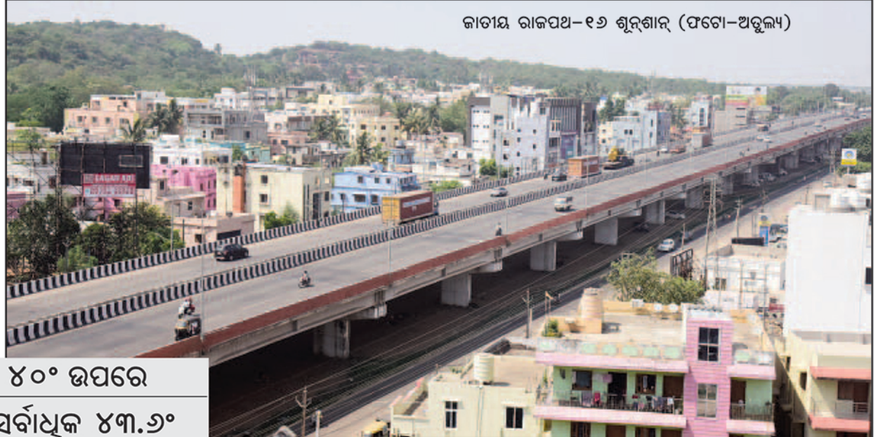
କାନ୍ଥର ରାଜପଥ-୧୬ ଶୁଭମେନ୍ଦ୍ର

ଭୁବନେଶ୍ୱର, ୧୮ (ସମ୍ବୁ) : ସକାଳ ହେଉଛି ଯେତେକି ତାତି କମୁନି । ଦିନ ତମାମ ଗ୍ରୀଷ୍ମ ଲହରୀରେ କାଳି ବାତ୍ର ତତେଇ ଦେଉଥିବା ବେଳେ ଭାଟିରେ ତାତି କମିବା ବେଳକୁ ପୁଣି ସକାଳୁ ପୂର୍ବ୍ୟକ ଉଦ୍‌ଘାଟ ପାଉଛି । ଫଳରେ ଦିନ କି ରାତି ସବୁ ସମୟରେ ଗରମ କମିବାରେ ନାଁ ଧରୁନି । ଭୁବନେଶ୍ୱର ପାଇଁ ସବୁଠୁ ଉତ୍ତମ ସହର । ଏଠାରେ ସର୍ବାଧିକ ଉତ୍ତମ ଟିପ୍ପା ୪୩.୬ ଡିଗ୍ରୀ ରହିଥିଲା । ଚଳିତ ମାସ ୫ ତାରିଖରେ ଭୁବନେଶ୍ୱର ସର୍ବାଧିକ ଉତ୍ତମ ଟିପ୍ପା ୫୫.୫ ଡିଗ୍ରୀ ରେକର୍ଡ