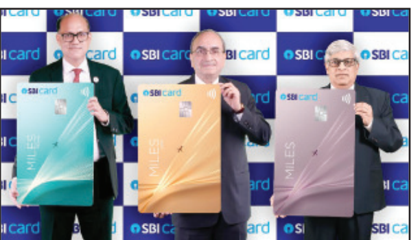
କରୁଥିବା ଏହି କାର୍ଡ ଏହାର ବିଭାଗ, ଏହାର ଲକ୍ଷିଆ, ସ୍ୱାଇପକେଡ୍, ଏହାର ଫ୍ରେକ୍-ଏୟାର, ଏହିଦ୍ୱାର

ଆକର ଆଦି ୨୦ଟି ବିମାନ ଚଳାକ ସଂସ୍ଥା ଏବଂ ହୋଟେଲ ଗ୍ରାହକଗୁଡ଼ିକ ସହିତ ସହଯୋଗୀତା କରିଛି ।