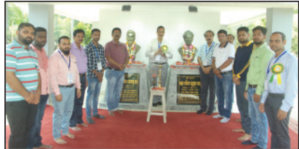
ଆନୁକମ୍ପାରେ ପାଳିତ ହୋଇଥିଲା । ଏହି ଉପଲକ୍ଷେ ଶିକ୍ଷାନୁଷ୍ଠାନ ପରିସରରେ ଥିବା ମଧୁବାବୁ ଓ ଉତ୍କଳମଣି ପଣ୍ଡିତ ଗୋପବନ୍ଧୁ ଦାସଙ୍କ ଅର୍ପଣ କରି କହିଲେ ସ୍ୱତନ୍ତ୍ର ଉଦ୍ଦଳ ପ୍ରଦେଶ ଗଠନ, ଏକ ସମୃଦ୍ଧ ଓ ସ୍ୱାଧିନତା କାଳି ନିର୍ମାଣରେ ମଧୁବାବୁଙ୍କ ଜୀବନଦୀପୀ ସାଧନା

ଅନୁକମ୍ପାରେ ପାଳିତ ହୋଇଥିଲା । ଏହି ଉପଲକ୍ଷେ ଶିକ୍ଷାନୁଷ୍ଠାନ ପରିସରରେ ଥିବା ମଧୁବାବୁ ଓ ଉତ୍କଳମଣି ପଣ୍ଡିତ ଗୋପବନ୍ଧୁ ଦାସଙ୍କ ଅର୍ପଣ କରି କହିଲେ ସ୍ୱତନ୍ତ୍ର ଉଦ୍ଦଳ ପ୍ରଦେଶ ଗଠନ, ଏକ ସମୃଦ୍ଧ ଓ ସ୍ୱାଧିନତା କାଳି ନିର୍ମାଣରେ ମଧୁବାବୁଙ୍କ ଜୀବନଦୀପୀ ସାଧନା