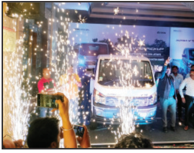
ଭୁବନେଶ୍ୱରରେ ଲକ୍ଷ୍ମୀ ଭି-୭୦ର ଲୋକାରମ୍ଭ ହେଉଛି ।

ବିତରଣ କରିବା ପାଇଁ ଚିନ୍ତାଧରଣ କରାଯାଇଛି । ଓଡ଼ିଶାର ଏହି ଆ ମାଧ୍ୟମରେ, ଟାଟାମୋଟର୍ସ ଯୁବବୀ ଭଗ୍ନୋଚିତ ବିଷୟରେ କହିଛନ୍ତି । 'ନୂତନ ଲକ୍ଷ୍ମୀ ଭି-୭୦' ଉପସ୍ଥାପନ କରି ଆମେ ଆନନ୍ଦିତ