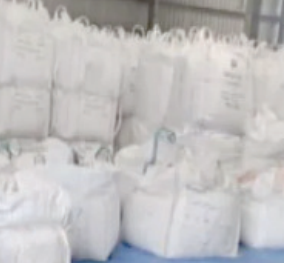
କଣକୁ ଗିରଫ ମଧ୍ୟ କରାଯାଇଛି । ଭାରତୀୟ ପତାକା ଲାଗିଥିବା ମାସ୍ ଧରା ତଳାରେ ହିଁ ଏପରି ନିଶାତ୍ରବ୍ୟର ବୋତଲୁ ନିଶାତ୍ରବ୍ୟ ମିଳିଥିଲା । ଏହି ତଳାଗ ହେଉଥିଲା । ସେମାନେ ଏତେ ପରିମାଣର ନିଶାତ୍ରବ୍ୟ କେଉଁଠୁ ଆଣିଲେ ଓ ଏହାକୁ କାହା ପାଖକୁ ନେଇଥିଲେ, ତା'ର ତଦନ୍ତ ଆରମ୍ଭ ହୋଇଛି । ଏହାପୂର୍ବରୁ ଏପ୍ରିଲ ୨୮ରେ ଚଳରକ୍ଷା ବାହିନୀ ଗୋଟିଏ ପାକିସ୍ତାନୀ

ନୂଆଦିଲ୍ଲୀ: ଗୁଜରାଟ ଏବେ ସତେ ଯେମିତି ନିଶିଷ୍ଟ ନିଶାତ୍ରବ୍ୟର ପେଶକ୍ଷମି ପାଇଁ ଗଲାଣି । କ୍ରମାଗତ ଭାବେ ଏଠାରୁ ଜବତ ହେବାରେ ଲାଗିଛି ଦେଶର ବ୍ୟାପକ ହୋଇଥିବା ବିଭିନ୍ନ ପ୍ରକାରର ନିଶାତ୍ରବ୍ୟ । ଏହିକ୍ରମରେ ଭାରତୀୟ ଚଳରକ୍ଷା ବାହିନୀ ଓ ଆରକ୍ଷକବାଦ ନିରୋଧ ଷ୍ଟାଫ୍ଟର ମିଳିତ ଅପରେସନରେ ଆଜି ଗୁଜରାଟ ଉପକୂଳରୁ ଧରାପଡ଼ିଛି ୧୭୩ କୋଟିର ନିଶାତ୍ରବ୍ୟ । ଗୋଟିଏ ମାସ ଧରା ତଳାରେ ଏତେ ପରିମାଣର ନିଶାତ୍ରବ୍ୟ ଗୁଜରାଟକୁ ଆସିଥିଲେ । ସୁରକ୍ଷାକର୍ମୀମାନେ ବେଶ୍ ଚମତ୍କାର ତଳାରେ ତଳାକୁ ଯାଆନ୍ତୁ କରିବା ସହ, ତା' ମଧ୍ୟରୁ ନିଶାତ୍ରବ୍ୟକୁ ଜବତ କରିଛନ୍ତି । ନିଶାତ୍ରବ୍ୟ ମିଳିବା ଘଟଣାରେ ୨