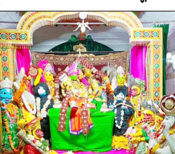
ସୋମବାର ଅଯୋଧ୍ୟା ପ୍ରତ୍ୟାବର୍ତ୍ତନ ନୀତି ଓ ପାଣିଖେଳ ଉତ୍ସବ ଅନୁଷ୍ଠିତ ହୋଇଛି । ଏଥିରେ ଶ୍ରୀଜୀଉଙ୍କ ଚଳଚ୍ଚିତ୍ର ପ୍ରମାଣ ମନ୍ଦିର ବେଢ଼ା

ଶ୍ରୀରାମ ଜଗନ୍ନାଥଙ୍କ ଅବତାରର ସମସ୍ତ ଲୀଳା ଖେଳା ଓଡ଼ିଶା ଶ୍ରୀରଘୁନାଥ ଜୀଉଙ୍କ ଶ୍ରୀରାମ ନବମୀ ଯାତ୍ରା ମହୋତ୍ସବରେ ପ୍ରଦର୍ଶିତ ହୋଇଛି । ଶ୍ରୀଜୀଉଙ୍କ ସମାଗମ ମହୋତ୍ସବର ବାତାବରଣ ସୃଷ୍ଟି କରିଥିଲା । ଶ୍ରୀଜୀଉଙ୍କ ସ୍ମୃତିରେ ବେଶ୍ ଦର୍ଶନ କରି ଶ୍ରୀଜୀଉ ନିକଟ ଧନ୍ୟ ମଣିଛନ୍ତି । ଶ୍ରୀଜୀଉଙ୍କ ସମାଗମ ମହୋତ୍ସବର ବାତାବରଣ ସୃଷ୍ଟି କରିଥିଲା । ଶ୍ରୀଜୀଉଙ୍କ ସ୍ମୃତିରେ ବେଶ୍ ଦର୍ଶନ କରି ଶ୍ରୀଜୀଉ ନିକଟ ଧନ୍ୟ ମଣିଛନ୍ତି । ଶ୍ରୀଜୀଉଙ୍କ ସମାଗମ ମହୋତ୍ସବର ବାତାବରଣ ସୃଷ୍ଟି କରିଥିଲା ।