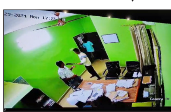
ଏହିଘଟଣାପରେ ଭୟରେ ନିକନିକ କାର୍ଯ୍ୟାଳୟକୁ ଅଧିକାରୀମାନଙ୍କଠାରୁ ଆରମ୍ଭ କରି କାର୍ଯ୍ୟାଳୟରେ ଥିବା ଚଳ କର୍ମଚାରୀମାନଙ୍କ ପର୍ଯ୍ୟନ୍ତ କେହି ଆଉ ବାହାରିନଥିବାର ଜଣାପଡ଼ିଥିଲା । ତେବେ ଖବରପାଇ ପୋଲିସ

ବାରଙ୍ଗ,(ସବୁ୍ୟ) ସୋମବାର ଦିନ ଜଣେ ଯୁବକ ହାତରେ ଖଣ୍ଡା ଓ କରୁରି ଧରି ନୟନକାନନ ଭିତରେ ପ୍ରାୟ ଅଧରାଘ ଉତ୍ପାତ କରିଛି । ଯାହାଫଳରେ କର୍ମଚାରୀ ମାନଙ୍କ ଭିତରେ କୋଳୁଆ ଭୟ ସୃଷ୍ଟି ହୋଇଥିବା ବେଳେ ୨ଜଣ ଅଧିକାରୀ କୁ ଆକ୍ରମଣ କରି ଆହତ ହୋଇଛନ୍ତି । ସୋମବାର ଦିନ ଅପରାହ୍ଣରେ ନୟନକାନନ ଉପ-ନିର୍ଦ୍ଦେଶକଙ୍କ କାର୍ଯ୍ୟାଳୟରେ ଯୁବକ ଉତ୍ପାତ ଉତ୍ପାତ କରି କଞ୍ଚୁଡ଼,ଝରକାକାଟ, ଚେତୁଲ ଓ ଅଧ୍ୟାୟ ସାମଗ୍ରୀରାଜି ବାସହ ୨ଜଣ ସହକାରୀ ନିର୍ଦ୍ଦେଶକଙ୍କୁ ଆକ୍ରମଣ କରିଥିବାର ସୂଚନା ମିଳିଛି ।