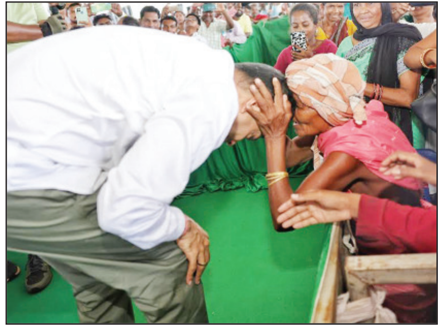
କଳାହାଣ୍ଡି, ନୂଆପଡ଼ା ଜିଲ୍ଲାରେ କାର୍ଯ୍ୟ ପାଣ୍ଠିଆନଙ୍କ ବିଜେଡି ଭାରି ଜୋରଦାର ପ୍ରଚାର