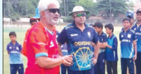
ଠାକୁ ଉର୍ଦ୍ଧ୍ୱ ପୁରୁଷ ଓ ମହିଳା କ୍ରକେଟ୍ ଟିମ୍ସ ଯାହା ଏସିଆ ରଗର୍ବା ଚାମ୍ପିଅନ୍ସିପ୍ ଆୟୋଜିତ ହୋଇଥିଲା । ଏହି ଦଳରେ ଅନ୍ତର୍ଭୁକ୍ତ ଉପସ୍ଥାପନ କରାଯାଇଛି ।

ଭୁବନେଶ୍ୱର, ୨୪୪ (ଏକେନ୍ନ) : ଓଡ଼ିଶା କ୍ରକେଟ୍ ଆସୋସିଏସନ୍ ପକ୍ଷରୁ ରାଜ୍ୟରେ କ୍ରକେଟ୍ ଦକ୍ଷତା ବିକାଶ ଶିବିର କାର୍ଯ୍ୟକ୍ରମ ହେଉଛି । ଏହି କ୍ରମରେ କ୍ରକେଟ୍ ଦକ୍ଷତା ବିକାଶ ଶିବିର ଆୟୋଜିତ ହୋଇଥିଲା । ଟେକନିକାଲ୍ ଓ ସାମାଜିକ୍ ଉପସ୍ଥାପନ କରାଯାଇଛି । ଏହି ଶିବିରରେ ଯୋଗଦେଇଥିବା