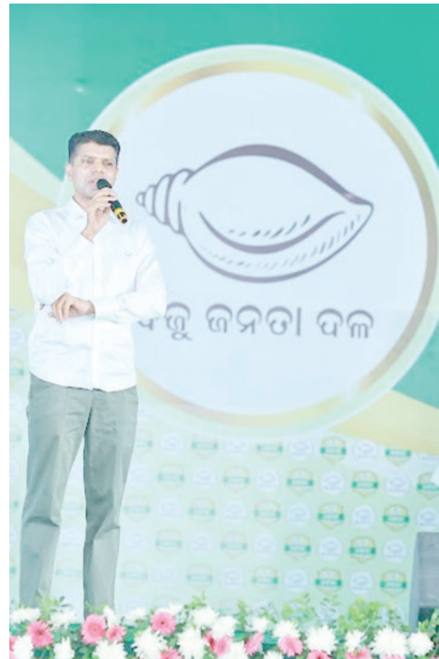
ହିଞ୍ଜିଳିରୁ ପ୍ରଚାର ଆରମ୍ଭ କଲେ ବିଜେଡ଼ି ସଭାପତି ନବୀନ ପଟ୍ଟନାୟକ