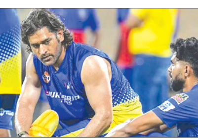
କ୍ୟାପ୍ଟେନ୍ କୁଲ୍ ମହେନ୍ଦ୍ର ସିଂ ଧୋନୀ ଭାଗ୍ୟଶାଳୀ ଭାବରେ ଉଦ୍ଭବ ହେଲେ । ରାଗିଗଲେ କ୍ୟାପ୍ଟେନ୍ କୁଲ୍ ମହେନ୍ଦ୍ର ସିଂ ଧୋନୀ ଭାଗ୍ୟଶାଳୀ ଭାବରେ ଉଦ୍ଭବ ହେଲେ ।

ନୂଆଦିଲ୍ଲୀ, ୨୪୪ (ଏକେନ୍ନ) : ଲାଲକ୍ଷ୍ମୀ ମ୍ୟାଚ୍ରେ କ୍ୟାପ୍ଟେନ୍ କୁଲ୍ ମହେନ୍ଦ୍ର ସିଂ ଧୋନୀ ଭାଗ୍ୟଶାଳୀ ଭାବରେ ଉଦ୍ଭବ ହେଲେ । ରାଗିଗଲେ କ୍ୟାପ୍ଟେନ୍ କୁଲ୍ ମହେନ୍ଦ୍ର ସିଂ ଧୋନୀ ଭାଗ୍ୟଶାଳୀ ଭାବରେ ଉଦ୍ଭବ ହେଲେ । ରାଗିଗଲେ କ୍ୟାପ୍ଟେନ୍ କୁଲ୍ ମହେନ୍ଦ୍ର ସିଂ ଧୋନୀ ଭାଗ୍ୟଶାଳୀ ଭାବରେ ଉଦ୍ଭବ ହେଲେ ।