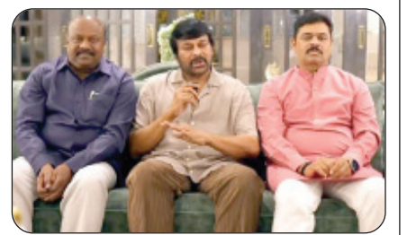
ତିରଞ୍ଜାବୀ ୨୦୦୮ରେ ପ୍ରଜା ରାଜ୍ୟମ ପାଇଁ ଗଠନ କରିଥିଲେ ଏବଂ ୨୦୦୯ରେ ବିଧାନ ସଭା ନିର୍ବାଚନରେ ୧୮ ଟି ସିଟ୍ (୨୯୪ ଟି ସିଟ୍ ମଧ୍ୟରୁ) ରେ ଜିତିଥିଲେ ।

ନୂଆଦିଲ୍ଲୀ: ଆନ୍ଧ୍ରପ୍ରଦେଶରେ ବିଜେପିକୁ ବଡ଼ ଖୁବ୍ ଖବର । ବିଧାନସଭା ନିର୍ବାଚନ ଏବଂ ଲୋକସଭା ନିର୍ବାଚନ ପାଇଁ ମୋରାୟୀର ତିରଞ୍ଜାବୀ ଚିତିପି-ଜନସେନା-ବିଜେପି ସହଯୋଗୀ ଦଳକୁ ସମର୍ଥନ କରିଛନ୍ତି ।