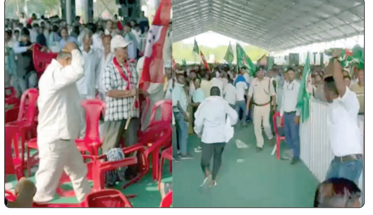
ଆରମ୍ଭ ହୋଇଥିଲା । ପରେ ଏହା ଉଗ୍ର ରୂପ ନେଇଥିଲା । ଉଭୟ ପରସ୍ପରକୁ ଚୌକି ଫିଙ୍ଗି ଥିଲେ । ଲାଠି ମାଡ଼ ମଧ୍ୟ କରିଥିଲେ ।

ନୂଆଦିଲ୍ଲୀ: ରାଲି ବେଳେ ବୁଲି ଶେଷୀ ମଧ୍ୟରେ ହେଲା ସଫର୍ଷ । ବିରୋଧୀଙ୍କ ଇଞ୍ଜିଆ ଆଲ୍ୟାଏନ୍ସର ଉଲଗୁଲାନ ରାଲି ବେଳେ ମୁହାଁମୁହିଁ ହେଲେ ସମର୍ଥକ ।