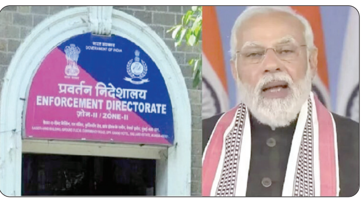
ପୂର୍ବରୁ ଏବଂ ପରେ ହୋଇଥିବା ସର୍ବ ଅପରେସନ ସଂଖ୍ୟା ମଧ୍ୟ ବୃଦ୍ଧି ପାଇଛି ବୋଲି କହିଛନ୍ତି ।

ନୂଆଦିଲ୍ଲୀ: ଏକ ଘରୋଇ ଟିଭି ଚ୍ୟାନେଲକୁ ସାକ୍ଷାତକାର ଦେଇ ଇଡି ପ୍ରବର୍ତନ ନିର୍ଦ୍ଦେଶକମନ୍ତ୍ରୀ ଦକ୍ଷତାକୁ ପ୍ରଶଂସା କରିଛନ୍ତି ପ୍ରଧାନମନ୍ତ୍ରୀ ନରେନ୍ଦ୍ର ମୋଦି ।