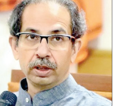
ଆଶୀର୍ବାଦରେ ହିନ୍ଦୀ ସ୍ୱରାଜ ପ୍ରତିଷ୍ଠା କରିଥିଲେ । ଆମେ ଦେବା କିମ୍ପା ହିନ୍ଦୁ ଧର୍ମ ନାମରେ ଭୋର୍ ମାଗୁନାହିଁ । ଏହା ଏକ ଅପମାନ ।

ମୁମ୍ବାଇ: ଦଳୀୟ ସଂଗୀତରୁ ଜୟ ଭବାନୀ ଏବଂ ହିନ୍ଦୁ ଶବ୍ଦ ହଟାଇବେନି ଶିବସେନା ମୁଖ୍ୟ ଉଦ୍ଧବ ଠାକରେ ।