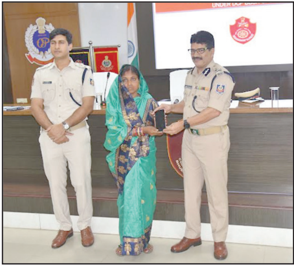
ସେମାନଙ୍କର ପ୍ରକୃତ ମାଲିକମାନଙ୍କୁ ହସ୍ତାନ୍ତର କରିଥିଲେ । ହସ୍ତାନ୍ତର ହୋଇଥିବା ମୋବାଇଲ୍ ଗୁଡ଼ିକ ମଧ୍ୟରୁ ଓପିପିଓ ସେଲ ଦ୍ୱାରା ସର୍ବାଧିକ ୬୦ ମୋବାଇଲ୍ ଫୋନ୍ ଉଦ୍ଧାର ହୋଇଥିବା ବେଳେ