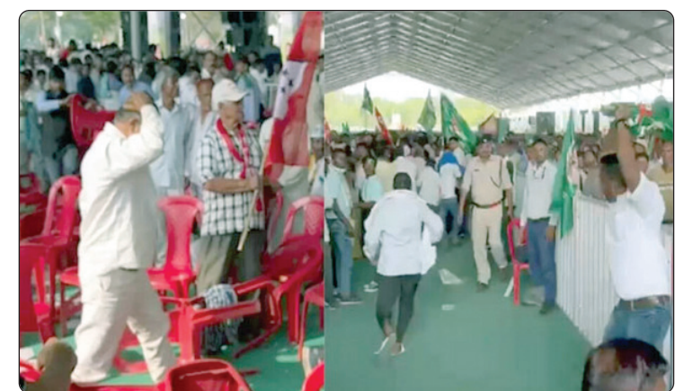
ଆରମ୍ଭ ହୋଇଥିଲା । ପରେ ଏହା ଉଗ୍ର ରୂପ ନେଇଥିଲା । ଉଭୟ ପରସ୍ପରକୁ ଚୌକି ଫିଙ୍ଗି ଥିଲେ । ଲାଠି ମାଡ ମଧ୍ୟ କରିଥିଲେ ।

ନୂଆଦିଲ୍ଲୀ: ରାଲି ବେଳେ ବୁଲି ଶେଷୀ ମଧ୍ୟରେ ହେଲା ସଫର୍ଷ । ବିରୋଧୀଙ୍କ ଇଞ୍ଜିଆ ଆଲ୍ୟାଏନ୍ସର ଉଲଗୁଲାନ ରାଲି ବେଳେ ମୁହାଁମୁହିଁ ହେଲେ ସମର୍ଥକ ।