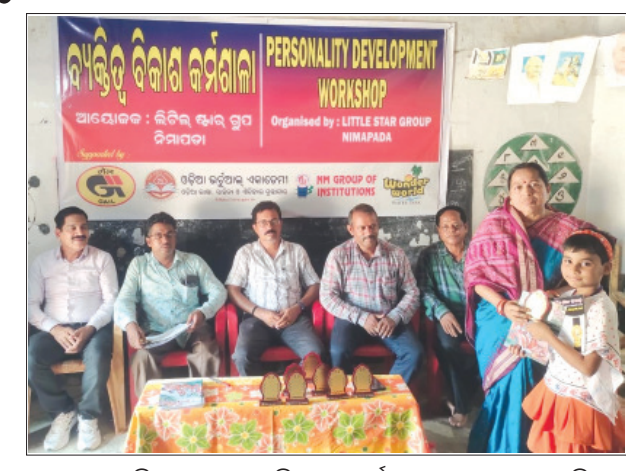
ଯୋଗଦେଇ ପିଲାମାନଙ୍କୁ ଲୁକାୟିତ ପ୍ରତିଭା ବଳରେ ଭଲ ମଣିଷ ହେବାକୁ ପରାମର୍ଶ ଦେଇଥିଲେ। ପରିଯୋଗିତାରେ ଭାଗନେଇ କୃତ୍ରିମ ହାସଲ କରିଥିବା ପ୍ରତିଯୋଗିତା ପୁରସ୍କୃତ କରାଯାଇଥିଲା।