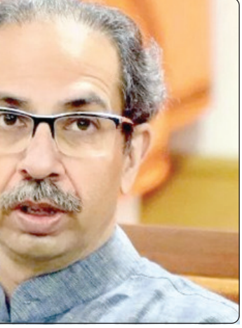
ଆଶୀର୍ବାଦରେ ହିନ୍ଦୀ ସ୍ୱରାଜ ପ୍ରତିଷ୍ଠା କରିଥିଲେ । ଆମେ ଦେବା କିମ୍ପା ହିନ୍ଦୁ ଧର୍ମ ନାମରେ ଭୋର୍ ମାଗୁନାହିଁ । ଏହା ଏକ ଅପମାନ ।

ମୁମ୍ବାଇ: ଦଳୀୟ ସଂଗୀତରୁ ଜୟ ଭବାନୀ ଏବଂ ହିନ୍ଦୁ ଶବ୍ଦ ହଟାଇବେନି ଶିବସେନା ମୁଖ୍ୟ ଉଦ୍ଧବ ଠାକରେ ।