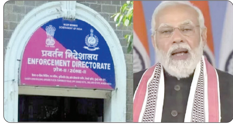
ପୂର୍ବରୁ ଏବଂ ପରେ ହୋଇଥିବା ସର୍ବ ଅପରେସନ ସଂଖ୍ୟା ମଧ୍ୟ ବୃଦ୍ଧି ପାଇଛି ବୋଲି କହିଛନ୍ତି ।

ନୂଆଦିଲ୍ଲୀ: ଏକ ଘରୋଇ ଟିଭି ଚ୍ୟାନେଲକୁ ସାକ୍ଷାତକାର ଦେଇ ଇଡି ପ୍ରବର୍ତନ ନିର୍ଦ୍ଦେଶକମନ୍ତ୍ରୀ ଦକ୍ଷତାକୁ ପ୍ରଶଂସା କରିଛନ୍ତି ପ୍ରଧାନମନ୍ତ୍ରୀ ନରେନ୍ଦ୍ର ମୋଦି ।