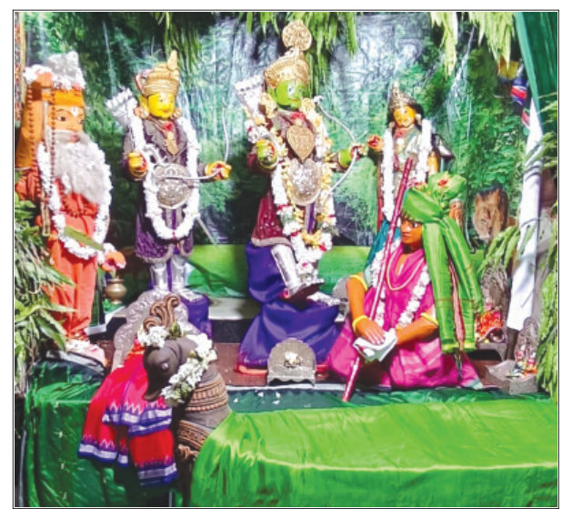
ବର୍ଷ ନବବିନାୟକ ଶ୍ରୀଜୀଉଙ୍କ ବାଲ୍ୟକାଳୀ ଅନୁଷ୍ଠିତ ହୋଇଥିଲା। ତାତ୍କାଳୀ ବନ୍ଧୁ ଅହଲ୍ୟା ଉଦ୍‌ବାର ବେଶରେ ଶ୍ରୀଜୀଉମାନଙ୍କର ଲୀଳା ମଧ୍ୟରେ ଅନୁଷ୍ଠିତ ହୋଇଥିଲା। ତାତ୍କାଳୀ ବନ୍ଧୁ ଉତ୍ସବରେ ବିଶ୍ୱାସ କୁ ଦୃଢ଼ିଭୂତ

ନୟାଗଡ଼, (ସବୁ୍ୟ): ରାଜ୍ୟ ପ୍ରସିଦ୍ଧ ଶ୍ରୀରଘୁନାଥ ଜୀଉ ପୀଠ ଓଡ଼ିଶାରେ ନବବିନାୟକ ଶ୍ରୀରାମନବମୀ ଉତ୍ସବ ପାଳିତ ହେଉଛି। ଶ୍ରୀରାମ ଜନ୍ମ ତିଥିରୁ ସମସ୍ତ ରିତା ନୀତି ମଧ୍ୟରେ ଶ୍ରୀଜୀଉଙ୍କ ଜନ୍ମ ଉତ୍ସବ ପାଳନ କରାଯାଇଛି। ରବିବାର ସନ୍ଧ୍ୟାରେ ଶ୍ରୀରଘୁନାଥ ଜୀଉଙ୍କ ହୁଲୁଭ ରଙ୍ଗାପାର ବେଶ ଭକ୍ତଙ୍କ ମନ କୁ ବିନୋଦିତ କରିଛି। ରାଜ୍ୟର ବିଭିନ୍ନ ସ୍ଥାନରୁ ହଜାର ହଜାର ସଂଖ୍ୟାରେ ଶ୍ରଦ୍ଧାଳୁ ଶ୍ରୀଜୀଉଙ୍କ ସନ୍ଧ୍ୟା ବେଶ ଦର୍ଶନକରୁ ଧନ୍ୟ ମଣ୍ଡିଛନ୍ତି। ଶ୍ରୀରାମ ନବମୀ ତିଥିରେ ଓଡ଼ିଶା ଶ୍ରୀରଘୁନାଥ ଜୀଉଙ୍କ ଜନ୍ମ ନୀତି ସହ ପୂଜାବିଧି ରୁ ଚଳିତ ବର୍ଷ ନବବିନାୟକ ଯାତ୍ରା ଉତ୍ସବ ଆରମ୍ଭ ହୋଇଛି। ପ୍ରଥମ ଦିବସରେ ଶ୍ରୀଜୀଉଙ୍କ ଜନ୍ମ ମାନ୍ଦାୟ ବେଶ