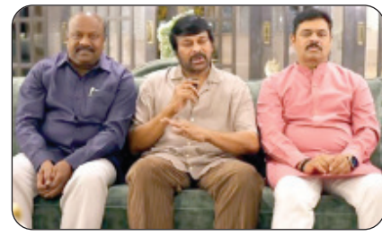
୨୦୦୮ ମେ ପ୍ରଜା ରାଜ୍ୟମ ପାର୍ଟି ଗଠନ କରିଥିଲେ ଏବଂ ୨୦୦୯ ମେ ବିଧାନ ସଭା ନିର୍ବାଚନରେ ୧୮ ଟି ସିଟ୍ (୨୯୪ ଟି ସିଟ୍ ମଧ୍ୟରୁ) ରେ ଜିତିଥିଲେ ।

ନୂଆଦିଲ୍ଲୀ: ଆନ୍ଧ୍ରପ୍ରଦେଶରେ ବିଜେପିକୁ ବଡ଼ ଖୁବ୍ ଖବର । ବିଧାନସଭା ନିର୍ବାଚନ ଏବଂ ଲୋକସଭା ନିର୍ବାଚନ ପାଇଁ ମୋରାୟୀର ତିରଞ୍ଜାବୀ ଚିତିପି-ଜନସେନା-ବିଜେପି ସହଯୋଗୀ ଦଳକୁ ସମର୍ଥନ କରିଛନ୍ତି ।