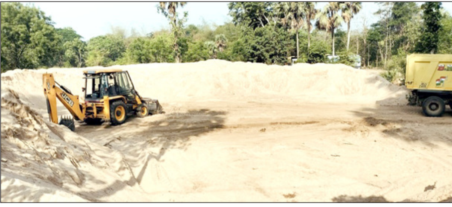
ବିଭାଗୀୟ କର୍ତ୍ତୃପକ୍ଷଙ୍କ ମଧୁପୁରୀ ଯୋଗୁଁ ଉଚ୍ଚତମ ମାଲିମାଲ ହେଉଛି । ଦୈନିକ ଶହ ଶହ ଟ୍ରକ, ଟାକ୍ସି ଓ ହାଇଡ୍ରା ମାଧ୍ୟମରେ ଦିନ

କଗଡ଼ସିଂହପୁର, (ସବୁ୍ୟ) : କଗଡ଼ସିଂହପୁର ଜିଲ୍ଲା ପ୍ରଶାସନ, ମାଲସ୍ୟ ବିଭାଗ ଓ ବାଲିମାପିଆଳ ବୃକ୍ଷରେ ମଧୁପୁରୀ ଚାଲିଛି । ଜିଲ୍ଲାର ପଟପରୀ, ଆଳିପିଙ୍ଗଳ, ବହୁସାଲକୋ ଯାତ୍ରା ବୃତ୍ତିକରୁ ଦିନରାତି ବାଲି ଉତ୍ତୋଳନ କରାଯାଇ ଗୋଟିଏ ସ୍ଥାନରେ ଗଚ୍ଛିତ କରାଯାଇ ତତ୍ତା ଦରରେ ବିକ୍ରି ହେଉଛି । ଏପଟେ ମାଲସ୍ୟ ବିଭାଗ କହୁଛି ବାଲିଗାଡ଼ ବନ୍ଦ ରହିଛି । ମାତ୍ର ଦିନକୁ ଦିନ ଚୋରା ବାଲି ବେପାର ହୁଏ ବୃଦ୍ଧିପାଇଁ ଥିବା ବେଳେ ସରକାରଙ୍କ କୋଟି କୋଟି ଟଙ୍କା ରାଜସ୍ୱ ହାନି ହେଉଛି ।