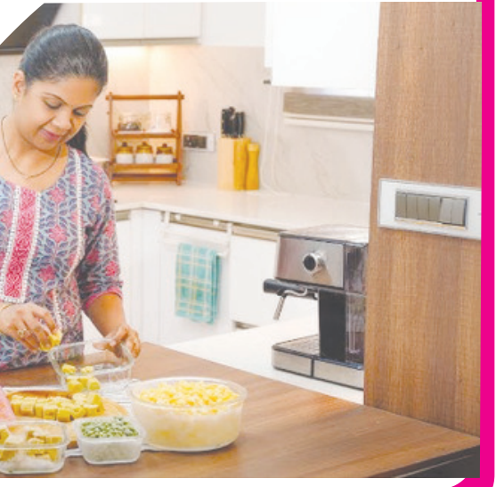
କନ୍ୟା ପଣ୍ଡା ପରିବାବାଦ, ହରିଆନା

- ବାସିଗୁଡି ଥିଲେ ତାକୁ ନଫିଙ୍ଗି ଗରମ ତେଲରେ ସେକି ଉପରେ ଗରମ ମସଲା ଓ ଦହି ଢାଳନ୍ତୁ । ଖାଆନ୍ତୁ ଗରମାଗରମ ଜଳଖିଆ । - ଯଦି ବହୁତ ମିଠା ବଳିଯାଇଛି ଓ ଖରାପ ହେବାର ଆଶଙ୍କା ରହିଛି, ତେବେ ସବୁକୁ ମିଶାଇ ଦିଅନ୍ତୁ ଓ ଘିଅରେ କିଛି ସମୟ ଭାଜନ୍ତୁ । ତାକୁ ମିଠା ପୁରିରେ ବ୍ୟବହାର କରିପାରିବେ । - ମୁଗଡାଲି ମିଶ୍ରଣରେ ଯଦି ୧ ପୁରାମତର ତାଉଳ ଅଟା ମିଶାଇ ଦିଅନ୍ତି, ତେବେ ମୁଗର 'ଡିଲେ କରାରେ' ହୋଇଯିବ । - ଦହିକୁ ଗାଢ଼ ରଖି କମାଇବା ପାଇଁ ଖାଁରରେ ମକାର କିଛି ଦାନା ପକାଇ ଦିଅନ୍ତୁ । - ଆଳୁକୁ ଯଦି କୁରୁକୁରେ କରିବାର ଅଛି, ତେବେ ତା ଉପରେ କିଛି ପରିମାଣର ଅଟା ଗୋଳାଇ ଦିଅନ୍ତୁ ଦେଖିବେ କେମିତି ଭଲ ହେବ । - ଅଣ୍ଡା ଭୁଜିଆ ବନାଇବା ସମୟରେ ସେଥିରେ କଟା ପାକଜ ପକାନ୍ତୁ, ତାହା ଅଧିକ ସ୍ୱାଦିଷ୍ଟ ହେବ । - ଯଦି ବହୁଦିନ ଧରି ଫ୍ରିଜରେ ଲୁହ ରଖିଛନ୍ତୁ, ତାହେଲେ ପରଷିବା ପୂର୍ବରୁ ତାକୁ ୧୫-୨୦ ସେକେଣ୍ଡ ପର୍ଯ୍ୟନ୍ତ ମାଇକ୍ରୋୱେଭରେ ରଖି ଦିଅନ୍ତୁ । ଏହାଦ୍ୱାରା କେବଳ ଲୁହ ନରମ ହେବନାହିଁ, ତାହା ମଧ୍ୟ ବେଶାଯିବ । - ଚପୁଟା, ଅଟା ଓ ଲାଲ ଲଙ୍କାର ପେଷ୍ଟ ଯଦି ବେଶିଦିନ ପର୍ଯ୍ୟନ୍ତ ରଖିବାକୁ ଚାହୁଁଥାନ୍ତି, ତେବେ ତାକୁ ତିଆରି କରିବା ସମୟରେ ସେଥିରେ କିଛି ଲୁଣ ଓ ଅଳ୍ପ ଗରମ ତେଲ ମିଶାଇ ଫ୍ରିଜରେ ରଖନ୍ତୁ ।