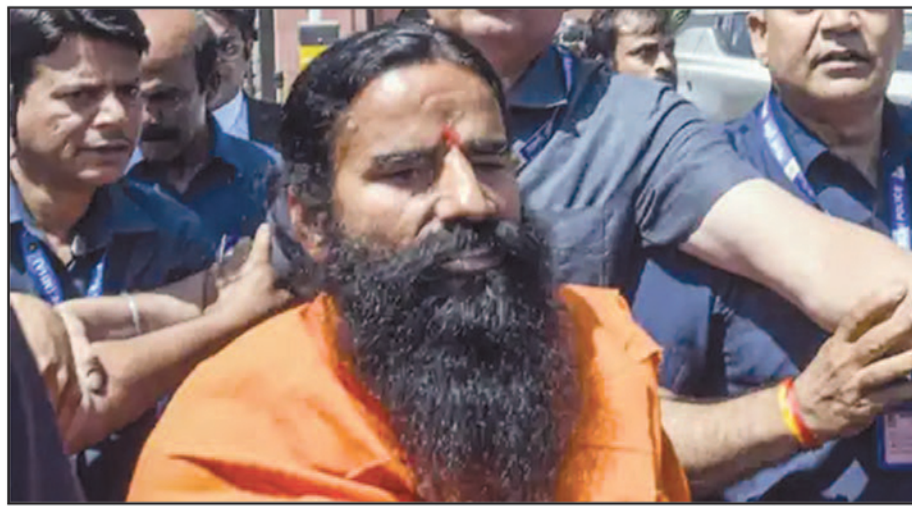
ରାମଦେବଙ୍କୁ ପ୍ରଦାନକାରୀ କର୍ତ୍ତୃପକ୍ଷ କାର୍ଯ୍ୟକ୍ରମରେ ଅକଳରେ ରାମଦେବଙ୍କୁ ପ୍ରଦାନ କରାଯାଇଛି ।