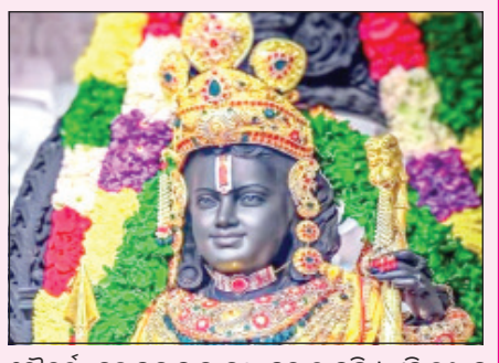
ସୂର୍ଯ୍ୟାଭିଷେକ ପାଇଁ ରାମଲୀଳାଙ୍କ ମସ୍ତକରେ ସିଧାପଡ଼ିବ ସୂର୍ଯ୍ୟଙ୍କ କିରଣ

ନୂଆଦିଲ୍ଲୀ: ପବିତ୍ର ରାମନବମୀ ଅବସରରେ ରାମ ଲୀଳାଙ୍କର ହେବ ସୂର୍ଯ୍ୟାଭିଷେକ । ଅପ୍ତି ମେକାନିକାଲ ସିଷ୍ଟମ କରିଆରେ ପ୍ରଭୁ ରାମଲୀଳାଙ୍କ ମସ୍ତକରେ ୪ ମିନିଟ୍ ଧରି ଶୋଭାବର୍ଣ୍ଣନ କରିବ ସୂର୍ଯ୍ୟ ଆଲୋକ । ୧୭ ତାରିଖ ଦିନ ୧୨ଟାରେ ଏକଜି ଅଲୋକିକ ତୃଣ୍ୟ ଦେଖିବାର ସୁଯୋଗ ପାଇବେ ରାମ ଭକ୍ତ । ଏଥିପାଇଁ ମନ୍ଦିର ପ୍ରଶାସନ ପକ୍ଷରୁ ଆଜି ତ୍ରାଏଲ ରନ୍ଦ କରାଯାଇଛି । ବେଙ୍ଗାଲୁରୁର ଇଣ୍ଡିଆନ ଇନଷ୍ଟିଚ୍ୟୁଟ୍ ଅଫ୍ ଆଷ୍ଟ୍ରୋନିକ୍ସ ଏବଂ ରୁରକର ବିଏସଆଇଆର-ସିଟିଆରଅକ୍ସ ସହଯୋଗରେ ଏହି ପ୍ରୋଜେକ୍ଟ ପ୍ରସ୍ତୁତ କରାଯାଇଛି । ଉତ୍ତର ଧରଣର ଦର୍ପଣ, ଲେନ୍ସ ଏବଂ ଅଷ୍ଟ୍ରୋଲୁମିନେସେନ୍ସ ନିର୍ମିତ ପାଇପ ମାଧ୍ୟମରେ ସୂର୍ଯ୍ୟ ଆଲୋକ ରାମ ଲୀଳାଙ୍କ ମସ୍ତକ ଉପରେ ପଡ଼ିବା ସହ ମୁଖମୁଖରେ