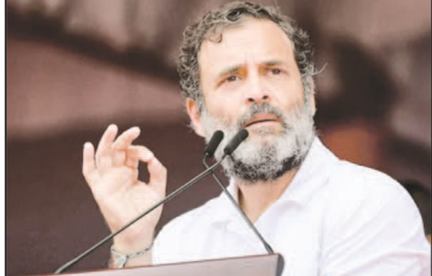
ପାଇକା ଜବାବ ରଖିଛନ୍ତି । ରାହୁଲ କହିଛନ୍ତି ଯେ ଇତିହାସ ଏବେବି ବଦଳି ନାହିଁ । ଭାରତେତିକ ପ୍ଲାଟଫର୍ମରେ ମିଛ ଅଭିଯୋଗ କରାଯାଇଛି । ଏଥର ନିର୍ବାଚନ ଦୁଇ

ବିଚାର ଧାରାର ଲଢ଼େଇ । ଗୋଟିଏପଟେ କଂଗ୍ରେସ ରହିଛି ଯାହା ଭାରତର ସ୍ୱାଧୀନତାରେ ଗୁରୁତ୍ୱପୂର୍ଣ୍ଣ ଭୂମିକା ରଖିଥିଲା । ଅପରପକ୍ଷରେ