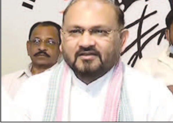
ଆଗାମୀ ମୋର୍ ୯ ବର୍ଷ ପାଇଁ କୌଣସି ପ୍ରକାର ନିର୍ବାଚନରେ ପ୍ରାର୍ଥୀ ହୋଇପାରିବେ ନାହିଁ । ସୁତରାଂଯୋଗ୍ୟ ଯେ, ଓଡ଼ିଶା ଗ୍ରାମ୍ୟ ଗୃହ ନିର୍ମାଣ

ଏବଂ ଉତ୍ତର ନିଗମଠାରୁ ରଣ ନେଇ ସେଥିରେ କାଲିଆତି କରିବା ଅଭିଯୋଗରେ ଭିଜିଲାନ୍ସ ଅଦାଲତ