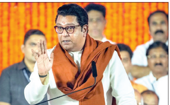
ରାଜ୍ ଠାକରେ କହିଛନ୍ତି ଯେ, ସର୍ବୋଚ୍ଚ ଅଧିକ ସମୟ ଧରି ମୋଦୀ ସହ ମହାରାଷ୍ଟ୍ର ମୁଖ୍ୟମନ୍ତ୍ରୀ ଏକନାଥ ସିନ୍ଧେ ସମ୍ପର୍କରେ

ନୂୟାୟ: ପ୍ରଧାନମନ୍ତ୍ରୀଙ୍କ ସମର୍ଥନରେ ବାହାରିଲେ ରାଜ୍ ଠାକରେ । ମଙ୍ଗଳବାର ମହାରାଷ୍ଟ୍ର ନବ ନିର୍ମାଣ ସେନାର ମୁଖ୍ୟ ରାଜ୍ ଠାକରେ ନୂୟାୟର ଶିବାଜୀ ପାର୍କରେ ଏକ ରାଲିକୁ ସମୋୟତ କରିଥିଲେ । ଏହି ଅବସରରେ ସେ କହିଛନ୍ତି ଯେ, ମହାରାଷ୍ଟ୍ର ନବ ନିର୍ମାଣ ସେନା ପ୍ରଧାନମନ୍ତ୍ରୀ ନରେନ୍ଦ୍ର ମୋଦୀଙ୍କୁ ବିନା କୌଣସି ସର୍ତ୍ତରେ ସମର୍ଥନ ଦେବ । ସେ ଆହୁରି ମଧ୍ୟ କହିଛନ୍ତି ଯେ, ସେ ହେଉଛନ୍ତି ପ୍ରଥମ ବ୍ୟକ୍ତି ଯିଏକି ନରେନ୍ଦ୍ର ମୋଦୀ ପିଏମ୍ ହେବା ଉଚିତ ବୋଲି କହିଥିଲେ । ତା ସହିତ ଧାରା ୩୭୦ ଉଲ୍ଲେଖକୁ ମଧ୍ୟ ସେ ସମର୍ଥନ କରିଥିଲେ