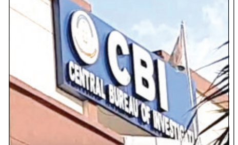
ପଚାରିବାର ଏକେଡ୍ରି ପାଖରେ କ୍ଷମତା ରହିବ ବୋଲି କୋର୍ଟ କହିଛନ୍ତି । କୋର୍ଟ କହିଛନ୍ତି ଯେ, 'କୋର୍ଟ ଏହି ଘଟଣା ଉପରେ ଦାକ୍ଷିଣ୍ୟ ନକର ରଖିବେ । ୧୫ ଦିନ ମଧ୍ୟରେ ସିବିଆଇ କ୍ୟାମେରା ସ୍ଥାପନ କରାଯିବ । ଏକଲତ୍ତି ଷ୍ଟ୍ରିଟ୍ ଲାଇଟ୍ ମଧ୍ୟ ଲାଗାଯିବ । ଆବଶ୍ୟକ ଅନୁଯାୟୀ ରାଜ୍ୟ ପାଣି ପ୍ରଦାନ କରିବେ । ଏହାପୂର୍ବରୁ ପ୍ରବର୍ତ୍ତନ ନିର୍ଦ୍ଦେଶାଳୟ (ଇଡି)ର ଏକ ଟିମ୍ ଉପରେ ହୋଇଥିବା ଆକ୍ରମଣର ତଦନ୍ତ କରି ସିବିଆଇକୁ ହସ୍ତାନ୍ତର କରାଯାଇଥିଲା । ଏହାକୁ ନେଇ କୋର୍ଟ କହିଛନ୍ତି, କାର୍ଯ୍ୟାଳୟ ୫ ତାରିଖରେ ସନ୍ଦେଶଖାଲିରେ ଛାଡ଼ି ଅଧିକାରୀଙ୍କ ଉପରେ ହୋଇଥିବା ଆକ୍ରମଣର ଯାଞ୍ଚ ଉପରେ କୋର୍ଟ ତଦାରଖ କରିବେ ।

କୋଲକାତା: ପଶ୍ଚିମବଙ୍ଗର ବହୁ ଚର୍ଚ୍ଚିତ ସନ୍ଦେଶଖାଲି ମାମଲାରେ ଏବେ ତଦନ୍ତ କରିବ ସିବିଆଇ । ସନ୍ଦେଶଖାଲିର ଚୁଷ୍ଟି, ଯୌନ ନିର୍ଯାତନା ଓ ଜମି ହତ୍ୟା ମାମଲାର ସିବିଆଇକୁ ତଦନ୍ତ କରିବାକୁ କଲିକତା ସାଇକୋର୍ଡ ନିର୍ଦ୍ଦେଶ ଦେଇଛନ୍ତି । କୋର୍ଟଙ୍କ ଏହି ନିର୍ଦ୍ଦେଶ ଆସିବା ପରେ ପଶ୍ଚିମବଙ୍ଗର ଟିଏମ୍ ସରକାରଙ୍କୁ ଏକ ଝଟ୍ଟୁ ଲାଗିଛି । ରୂପବାର ମାମଲାର ଶୁଣାଣି କରି କୋର୍ଟ କହିଛନ୍ତି, ଲୋକସଭା ନିର୍ବାଚନ ପୂର୍ବରୁ ପଶ୍ଚିମବଙ୍ଗର ସନ୍ଦେଶଖାଲିରେ କୋର ଜବରଦସ୍ତି ବର୍ତ୍ତି ଆସିବା, ଜମି ହତ୍ୟା ଓ ଯୌନ ଉପହାସ ମାମଲାର ତଦନ୍ତ ସିବିଆଇ କରିବ । ସନ୍ଦେଶଖାଲି ମାମଲାର ଜଟିଳତାକୁ ବିଚାରକୁ ନେଇ ନିକ୍ଷେପ ତଦନ୍ତ କରାଯିବାର କୋର୍ଟ ସହମତ ନାହିଁ । ଯେଉଁ ସଂସ୍ଥାକୁ ଯାହା ଦିଆଯାଇଛି ଗଠ୍ଟୁ ରାଜ୍ୟ ତଦନ୍ତ ପାଇଁ ଉଚିତ ସମର୍ଥନ ଦେବ । ଅଭିଯୋଗ ଗ୍ରହଣ ପାଇଁ ଏକ ପୋର୍ଟାଲ୍/ ଇମେଲ୍ ଆଇଡି ଉନ୍ମୋଚନ କରାଯିବ । ମାମଲାର ତଦନ୍ତ କରି ସିବିଆଇ ଏକ ବିସ୍ତୃତ ରିପୋର୍ଟ ଦାଖଲ କରିବ । ଏହି ରିପୋର୍ଟରେ ଭଲଭଲ ଜମିର ଜବରଦସ୍ତୀ ଉଲ୍ଲେଖ ଏବଂ ଯେନ ମାମଲା ସଂପର୍କରେ ଉଲ୍ଲେଖ ରହିବ । ସାଧାରଣ ଲୋକ, ସରକାରୀ ବିଭାଗ, ଅଣ-ସରକାରୀ ସଂଗଠନ (ଏନଜିଓ)ଙ୍କ ସମେତ ଯେକେଣସି ବ୍ୟକ୍ତିଙ୍କୁ