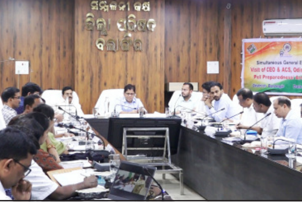
ଦେବାସହ ଆପ ବ୍ୟବହାର ଉପରେ ପର୍ଯ୍ୟାପ୍ତ କୁଖଣୀ ହେବାକୁ କହିଥିଲେ । ସି ବିଜିଲି ଆପ, ଆବର୍ଷ ଆବରଣ ବିଧି, ଖର୍ଚ୍ଚ ବିବରଣୀ ଟିମ୍, ଆଦି ତିନି ଗୁଡ଼ିକର କାର୍ଯ୍ୟ ପଦ୍ଧତି ମଧ୍ୟ ସମୀକ୍ଷା ହୋଇଥିଲା । ଦ୍ଵିତୀୟ ପର୍ଯ୍ୟାୟରେ ହୁଇ ଜିଲ୍ଲାର ଆଇନ ଶୁଖିଳା ସ୍ଥିତିକୁ ନେଇ ପୋଲିସ୍