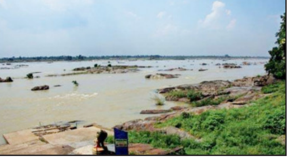
ଗାଧୁଆ ଯୋଗ୍ୟ ବି ନୁହେଁ ହେଲେ ବାସ୍ତବ ସ୍ଥିତିକୁ ଦେଖିଲେ, ସଚେତନତା ଅଭାବକୁ ଏବେବି ଲୋକେ ନଜରେ ଗାଧୋଉଛନ୍ତି । ବାଲଟିରେ ପାଣି ବି ନେଉଛନ୍ତି ।

ପ୍ରତି କ୍ଷତିକାରକ । ଏଭଳି ସ୍ଥିତିରେ ମହାନଦୀକୁ ଅଧିକ ମୃତ୍ୟୁରୁ ରୋକିବାକୁ ବେଳ ମାତ୍ର ଆଉ ପ୍ରଶାସନ ଯଥାଶୀଘ୍ର ଉଚିତ ପଦକ୍ଷେପ ନେବା ଜରୁରୀ ହୋଇପଡ଼ିଛି । ସମ୍ବଲପୁରର ମହାନଦୀ ଜଳ ବିଶୁଦ୍ଧି କଳର ଦୁଃସ୍ଥିତି ଫେବୃଆରୀରେ ସମ୍ବଲପୁରର ୪ଟି ସ୍ଥାନରୁ ମହାନଦୀ ଜଳ ନମୁନା ପରୀକ୍ଷା କରି ଏହାକୁ ବିଶୁଦ୍ଧୀକରଣ ଦର୍ଶାଇଥିଲା । ରାଜ୍ୟ ପ୍ରତ୍ୟକ୍ଷ ନିୟନ୍ତ୍ରଣ ବୋର୍ଡ଼ ଅଧିକାରୀଙ୍କ ସୂଚନା ଅନୁସାରେ ମହାନଦୀର ଜଳ ଅନେକ ସ୍ଥାନରେ ବ୍ୟବହାର ଅନୁପଯୋଗୀ ଓ ସ୍ଵାସ୍ଥ୍ୟ